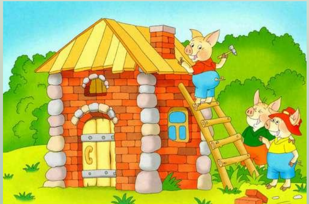
Домики трёх поросят