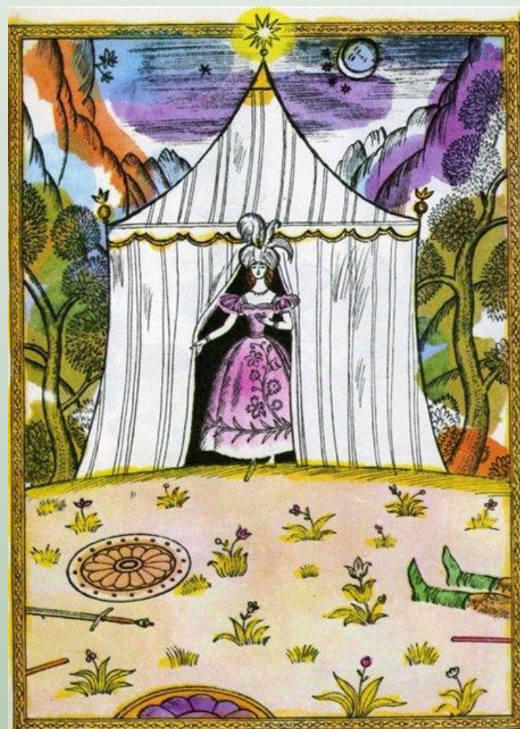
Шалаш шамаханской царицы