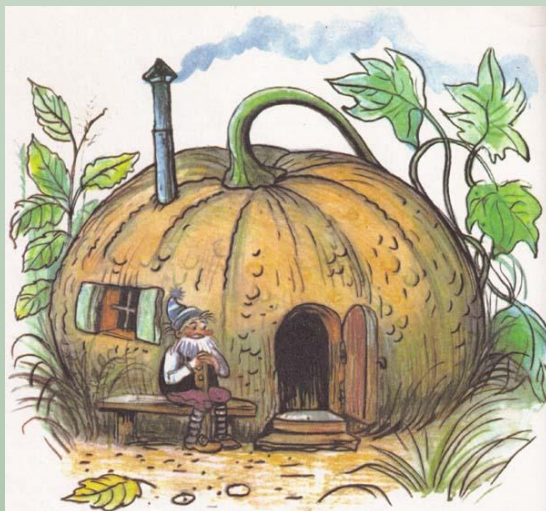
Домик – тыква для гнома