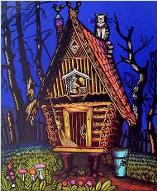
Избушка на курьих ножках

Вспомни, в каких жилищах жили твои любимые сказочные герои.