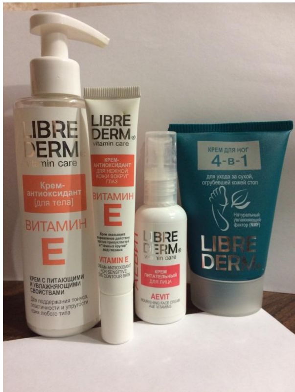
Либре Дерм Крем для лица, тела и ног С различными витаминами

Расскажите подробнее о каждом средстве для дополнительного ухода, которое у вас есть: