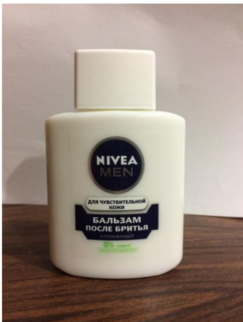
Бальзам после бритья Нивея Для чувствительной кожи

Если у Вас несколько средств, скопируйте эти 2 слайда и продолжите!