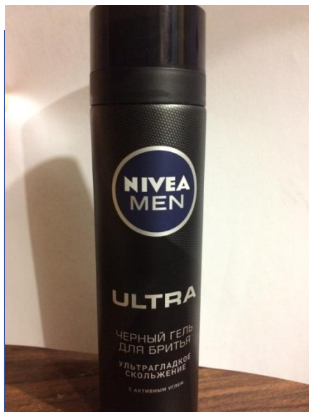
Гель для бритья Нивея Ультра

Если у Вас несколько средств, скопируйте эти 2 слайда и продолжите!