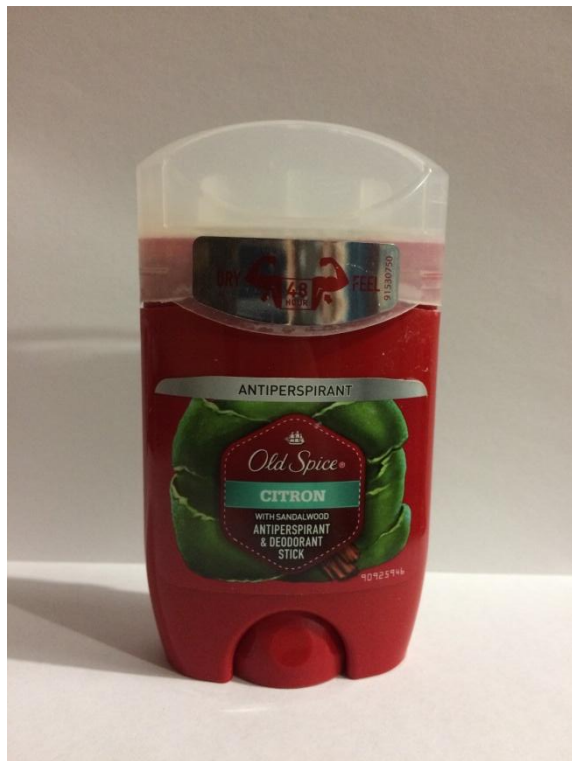
Антиперспирант Олд Спайс Ситрон

Расскажите подробнее о каждом средстве для дополнительного ухода, которое у вас есть: