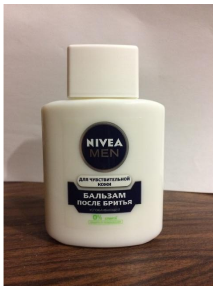
Бальзам после бритья Нивея Для чувствительной кожи

Если у Вас несколько средств, скопируйте эти 2 слайда и продолжите!