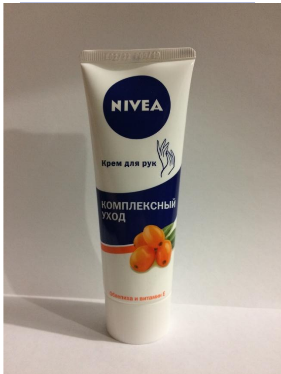
Крем для рук Нивея Комплексный уход

Расскажите подробнее о каждом средстве для дополнительного ухода, которое у вас есть: