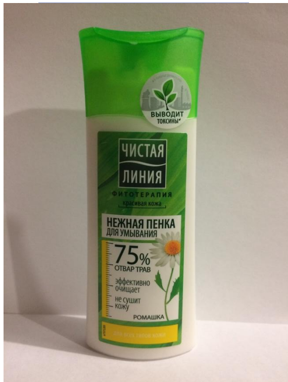
Пена для умывания Чистая линия Для всех типов кожи

Расскажите подробнее о каждом средстве для дополнительного ухода, которое у вас есть: