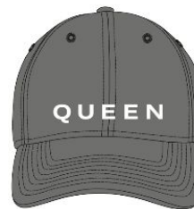
Бейсболка с надписью Queen