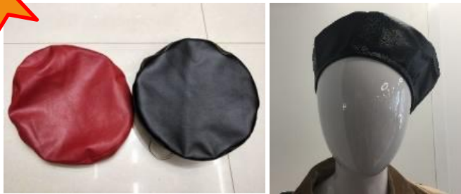
Модные береты из эко-кожи