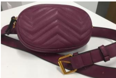
Поясная сумка или сумка-ремень