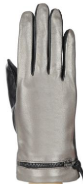
Текстильные перчатки с металлизированной нитью и кожаные перчатки из металлизированной кожи