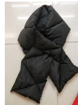
Эффектный стеганный шарф, утепленный синтепоном