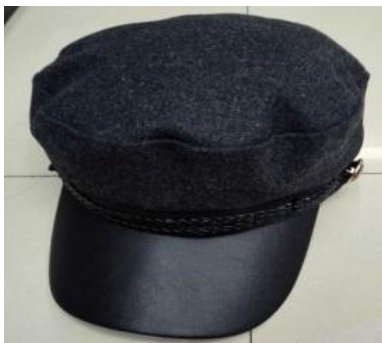
Фуражка с козырьком из эко-кожи

на вершинах модных хит-парадов! Сумки, перчатки и детали из практичного материала незаменимы в холодные времена года.