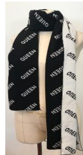
Широкий двусторонний палантин с надписями - Queen