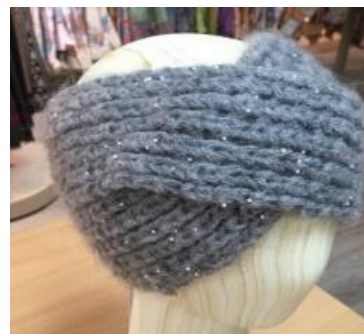
Вязаная повязка на голову