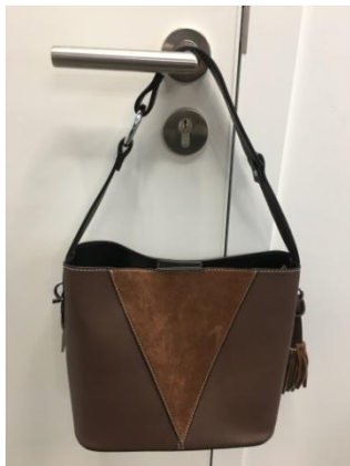
Сумка на плечо в ковбойском стиле, сочетающая в себе две фактуры: кожу и замшу, декорированная брелками-кисточками подчеркнет вашу индивидуальность