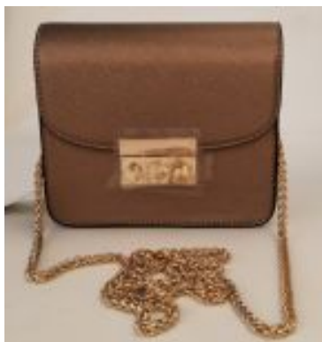
Кросс-боди из эко-кожи с сафьяновым тиснением