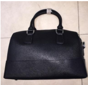
Вместительная сумка Боулинг-бэг из натуральной кожи с сафьяновым тиснением