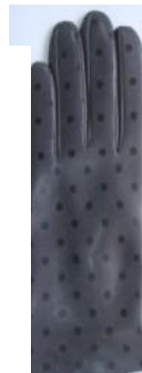
Перчатки с принтами