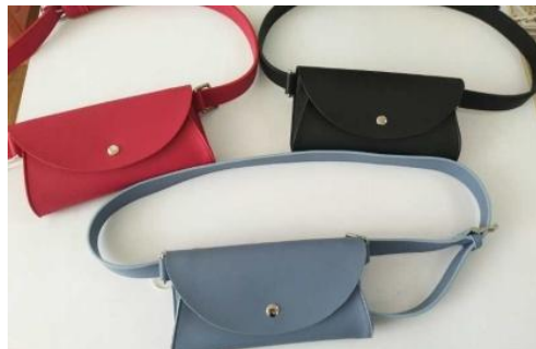
Поясная сумка или сумка-ремень освободит руки во время движения. Носить ее можно и на поясе, и через плечо. Абсолютный тренд сезона!