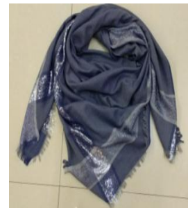
Платок и перчатки с металлизированными нитями