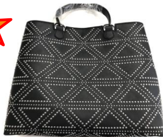
Хэнд-бэг декорированный металлической фурнитурой выглядит эффектно.