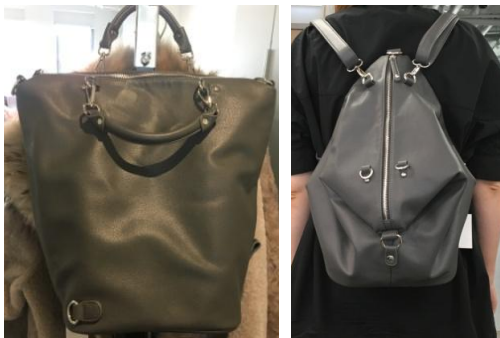
Сумка-трансформер – многофункциональная модель. Её можно носить 3 разными способами: как сумку шоппинг-бэг, на плечо и как рюкзак