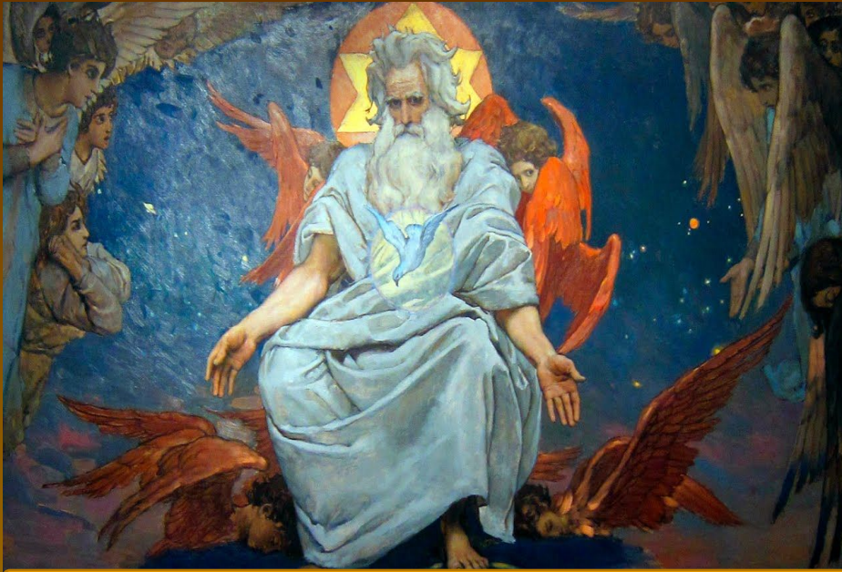
Яхве - творец мира