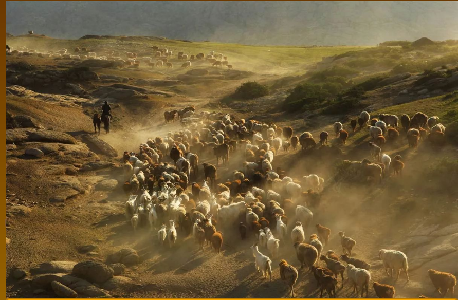
Кочевое скотоводство евреев

Между Египтом и Двуречьем располагались сухие степные районы, в которых почти не было плодородной земли, но была трава и кустарники.