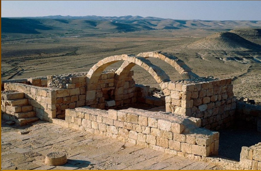
Места проживания древних евреев