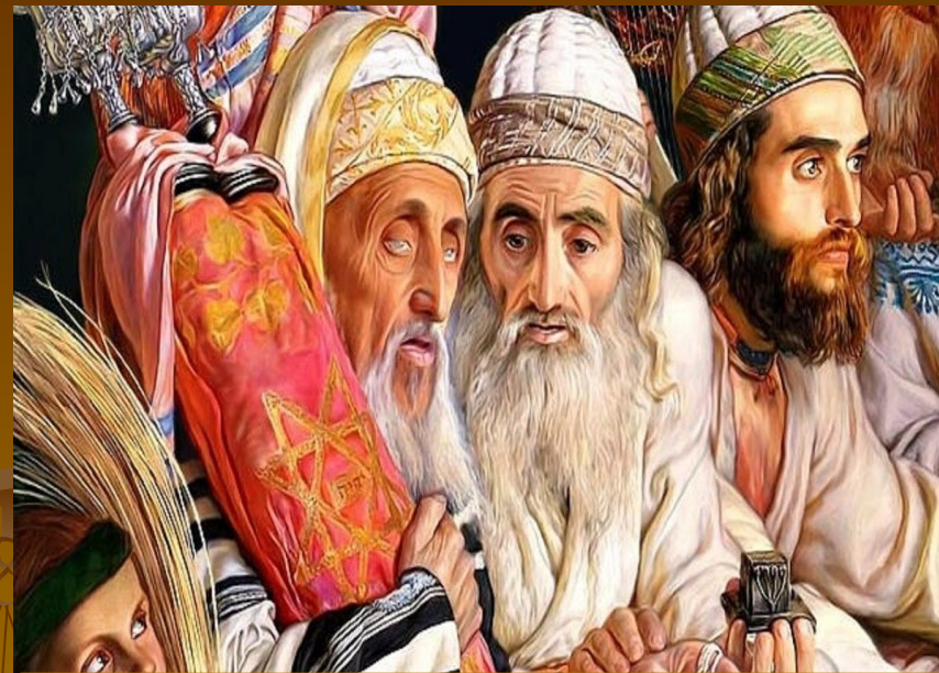
Хранитель древних преданий

Во главе еврейских племён стояли старейшины – наиболее уважаемые, опытные и богатые люди.