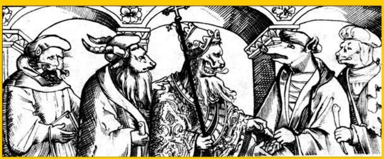
Папа Римский и богословы