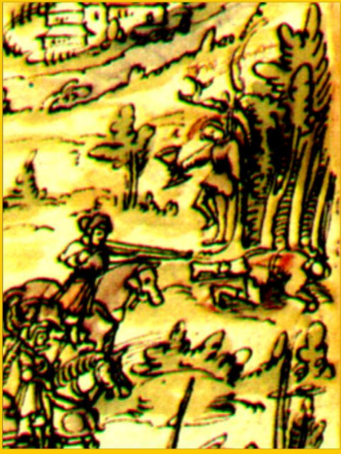
Казнь восставших. Миниатюра 16 в.

Лето 1524 года на юге Германии вспыхнула Крестьянская война.