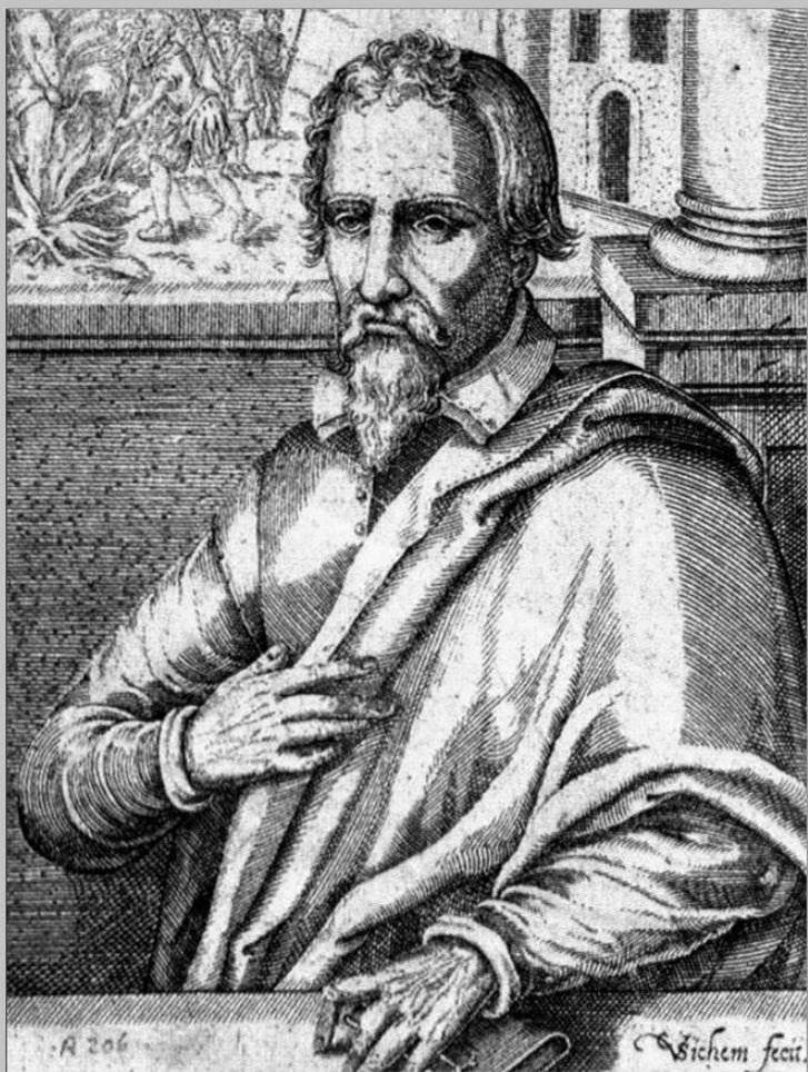
Жан Кальвин. Гравюра 17 в.

В 40-х гг. 15 в. начался второй этап Реформации. Его возглавил Жан Кальвин, выдвинувший идею «божественного предопределения».