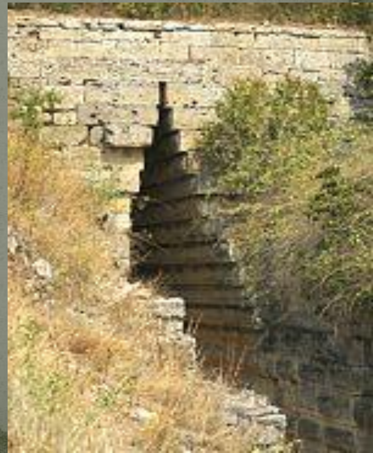
Керч, Царський курган, архаїчне склепіння

Дослідження збережених незначних решток античних будов та інших мистецьких творів вказують, що спочатку у VIII — VI ст. до н. е. Причорномор'я мало вплив т.зв. іонійського стилю, а з V ст. тут поширюються зразки афінського та з початком нової ери до II ст. римського будівництва. Знайдені фундаменти оборонних мурів міст (Ольвія, Пантікапей, Німфей, Горгіппія), житлових будинків, храму Аполлона в Ольвії й різні уламки колон, капітелей тощо вказують на відмінність їх від чисто грецьких зразків — аттичних і малоазійських. Особливий інтерес мають гробівці (наприклад, у Керчі) зі склепінням, зложеним з клинуватого каміння. Цей новий на той час конструктивний засіб перекриття не був відомий у самій Греції, а лише в деяких грецьких колоніях, наприклад, в Александрії.