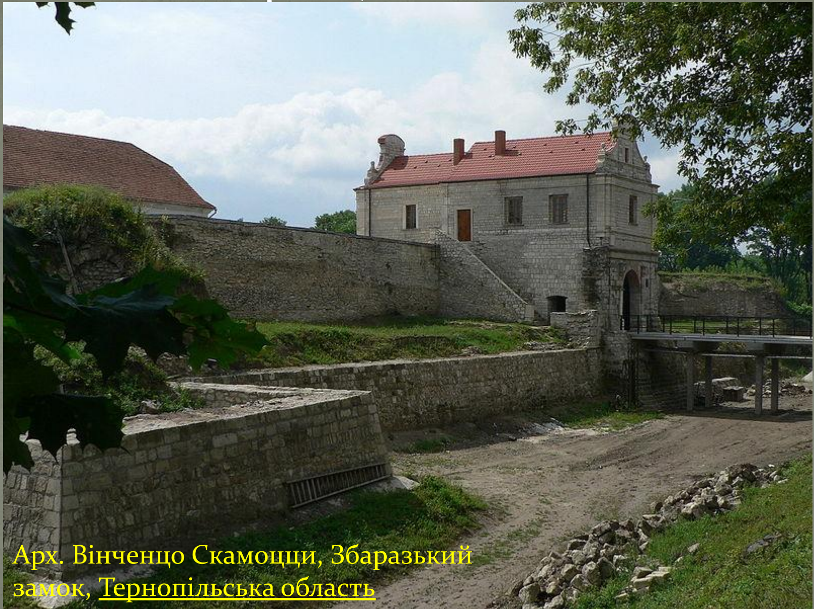
Арх. Вінченцо Скамоцци, Збараський замок, Тернопільська область