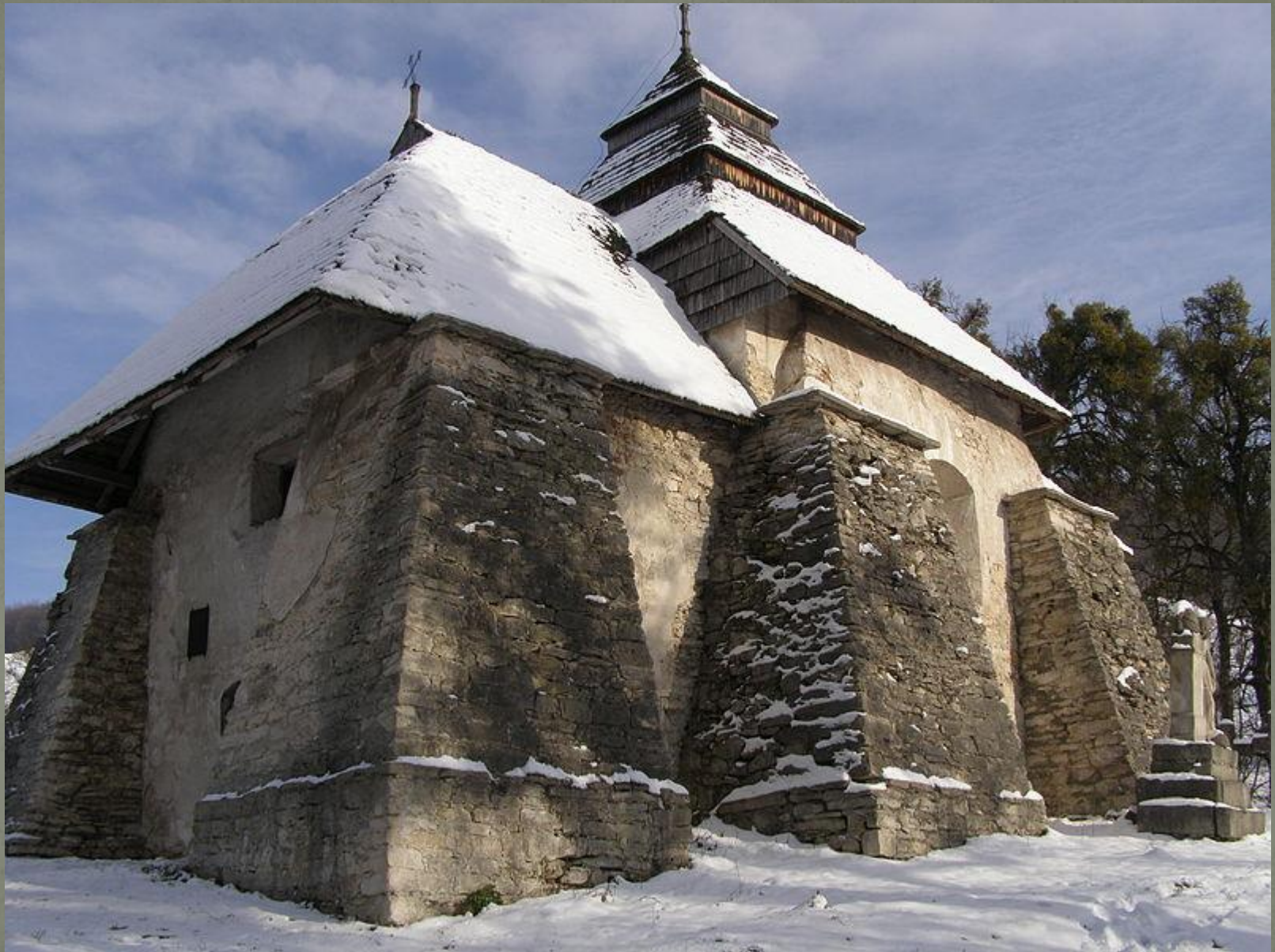
Церква Св. Миколая, Чесники, XIV–XVI ст