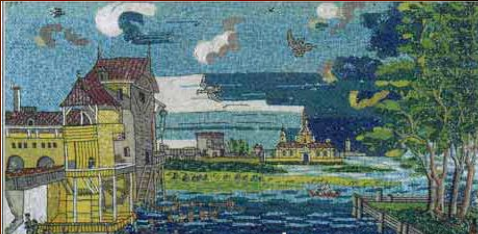
Фабрика М. В. Ломоносова. Мозаика

Увеличение палитры дало ему возможность создавать мозаики, которые по силе впечатления не уступали живописи.