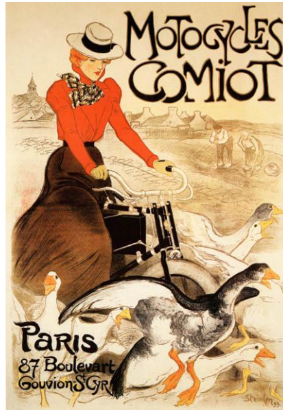
Плакат . Т. Стейлен

в начале XIX века и выполняли агитационные функции. Распространяться они стали в связи с развитием зрелищных учреждений, увеличением количества промышленных и художественных выставок, с появлением митингов. В то время большинство плакатов еще делали вручную.