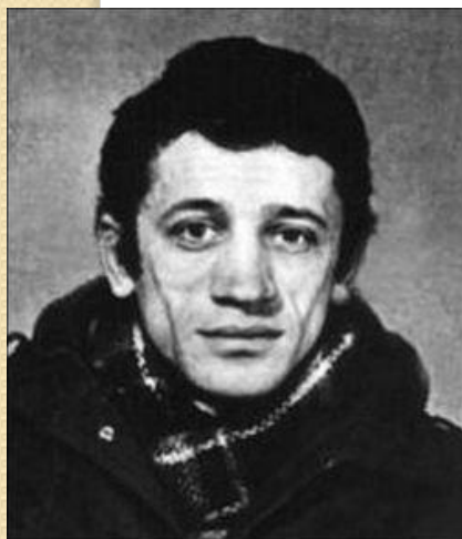
Валерій Марченко, 1947 – 1984 рр.