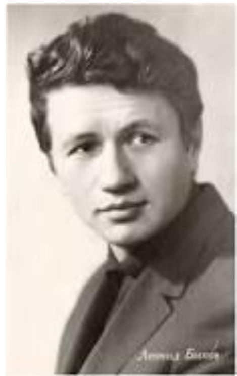
Леонід Биков 1928-1979 рр., кінорежисер, актор,