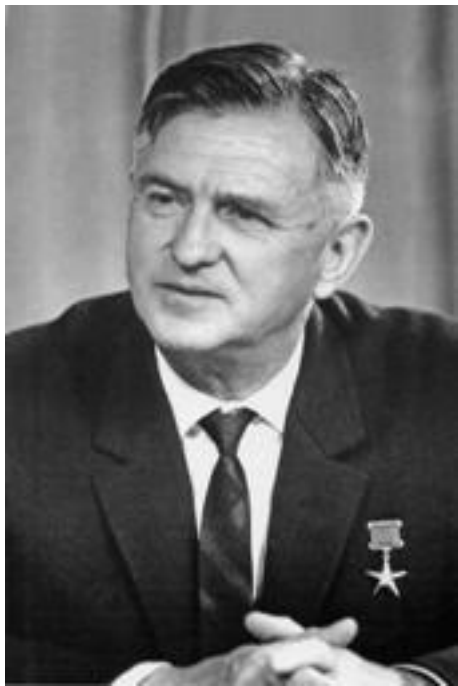
Олег Антонов 1906-1984 рр., авіаконструктор