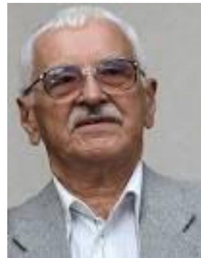
Євген Сверстюк, 1928-2014 рр.