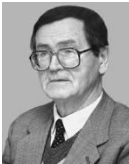
Іван Дзюба, 1931 р.