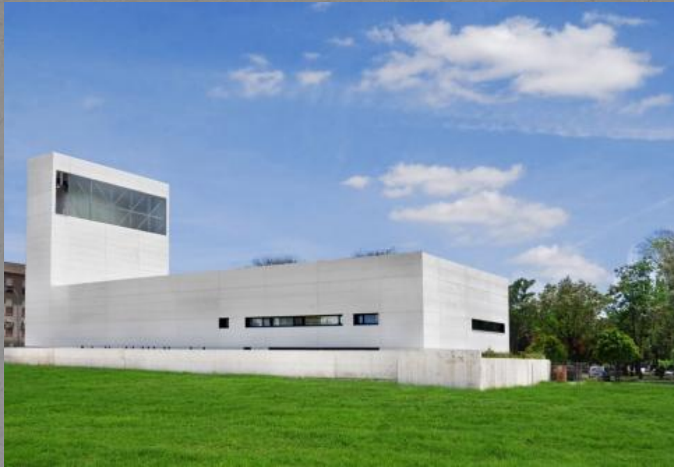
Церковь утешения в Кордобе