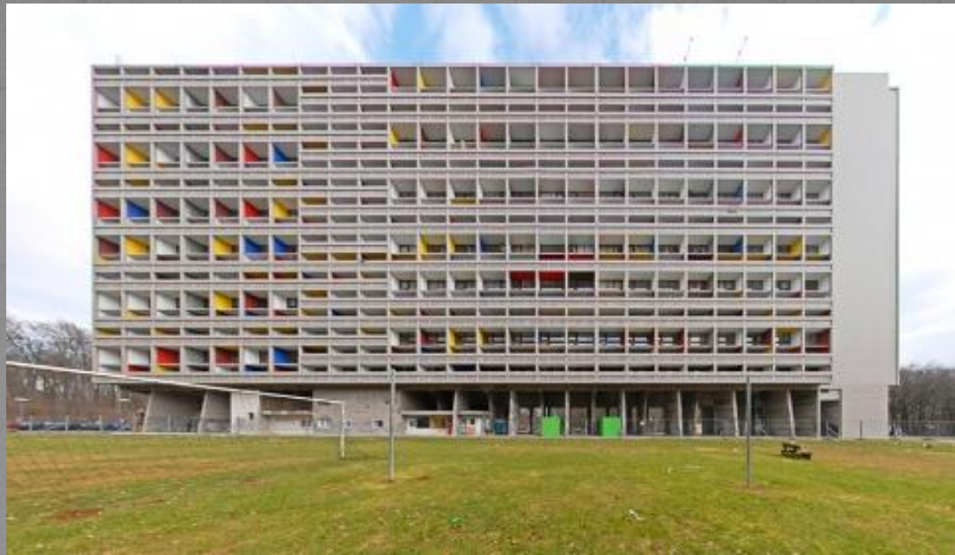
Жилой дом в Марселе