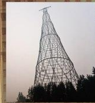
Шуховская башня В. Шухов 1920-1922