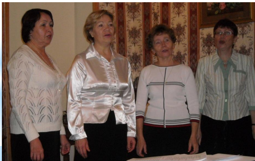
Ансамбль «Надежда» ГКЦ