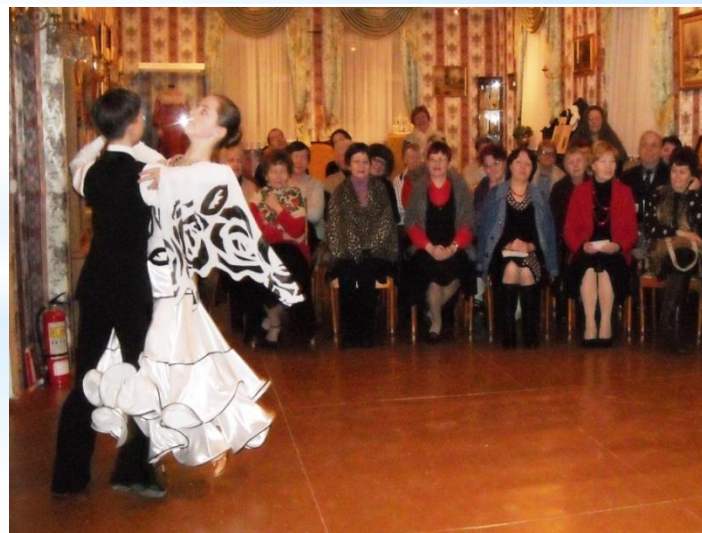
Юные солисты ансамбля бального танца