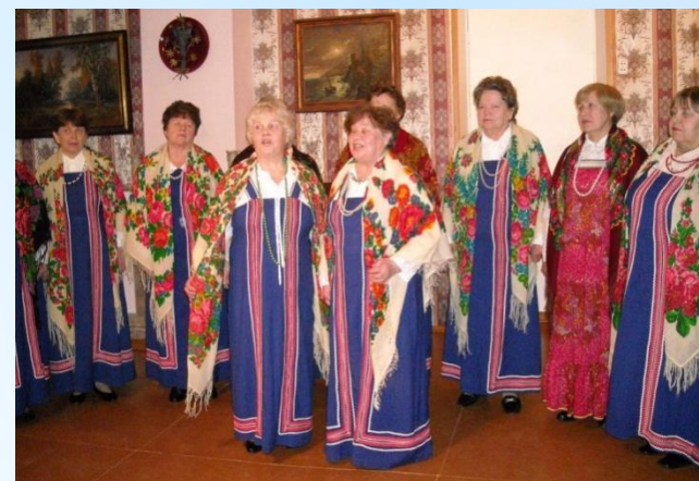
Ансамбль «Родные напевы»

Представление «Бабий переполох в крещенский вечерок» в Дни духовной культуры г. Новодвинска (декабрь 2011 г)