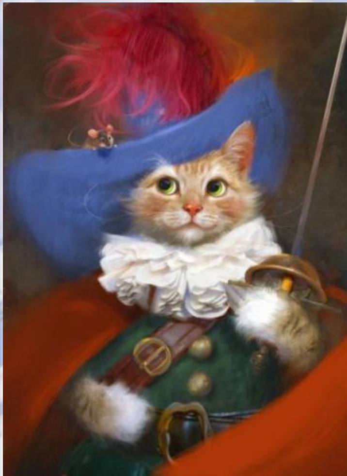
Кот в сапогах