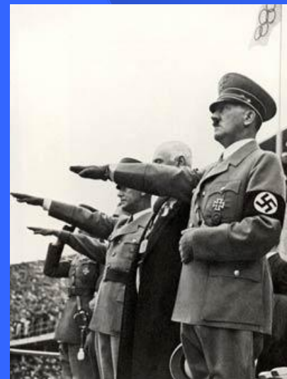
После оккупации Чехословакии в распоряжении Гитлера оказались мощнейшие военные заводы