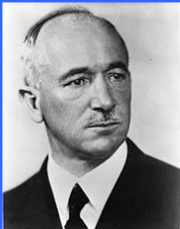
Эдвард Бенеш - 2-й президент Чехословакии с 18 декабря 1935 года по 5 октября 1938 года.