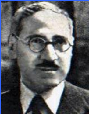
Рашид Али аль-Гайлани -руководитель прогерманского восстания в Ираке

Арабы. Когда 2 мая 1941 года в Ираке вспыхнул антибританский мятеж под руководством Рашида Али аль-Гайлани, немцы сформировали специальный штаб «Ф» для оказания помощи арабским инсургентам. Были созданы два небольших подразделения – 287-е и 288-е специальные соединения, набранные из личного состава дивизии «Бранденбург». Но прежде чем они смогли вступить в дело, мятеж был подавлен. 288-е соединение, состоявшее полностью из немцев, было отправлено в Северную Африку в состав Африканского корпуса. 287-е соединение было оставлено в Греции, недалеко от Афин, и ему поручена организация добровольцев с Ближнего Востока. В основном это были палестинские сторонники прогермански настроенного верховного муфтия Иерусалима и иракцы, поддерживавшие эль Галиани. Когда три батальона были набраны, соединение прошло в Греции подготовку для ведения боевых действий в условиях тропиков. В конце концов один батальон был отправлен в Тунис, а два остальных сражались с партизанами сначала на Кавказе, а затем – в Югославии.