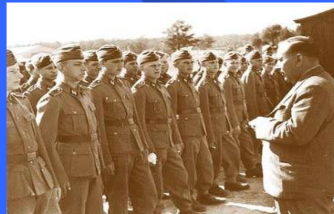
Эстонские легионеры вермахта воевали против СССР с особой яростью