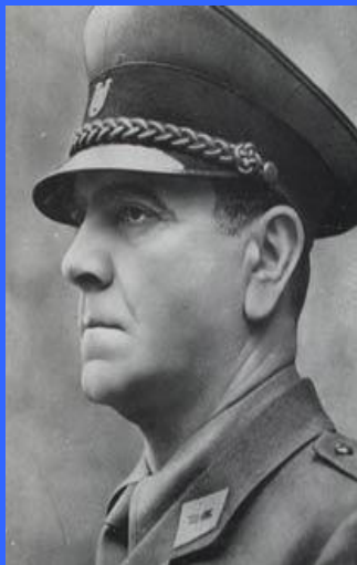
Анте Павелич -глава хорватской фашистской организации усташей

Кроме того, самолеты хорватского военно-воздушного легиона совершали налеты на Москву и Кавказ, а хорватские военно-морские суда вели бои с советскими кораблями в Черном и Азовском морях.