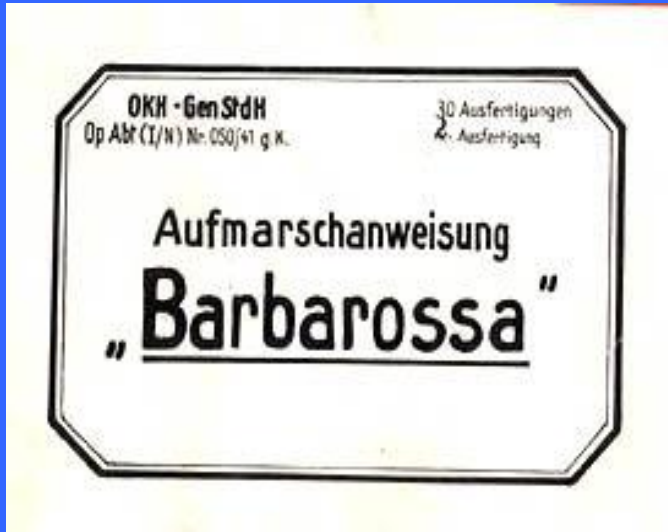
План «Барбаросса», фрагмент обложки

«В годы войны против нас воевала вся Европа, и не только она, – говорит президент Академии военных наук, генерал армии Махмут Гареев. – 350 млн человек, вне зависимости от того, сражались они с оружием в руках или стояли у станка, производя оружие для вермахта, делали одно дело. За время Второй мировой войны погибло 20 000 членов французского Сопротивления. А против нас сражалось 200 000 французов. Мы также взяли в плен 60 000 поляков. За Гитлера против СССР сражалось 2 млн европейских добровольцев».