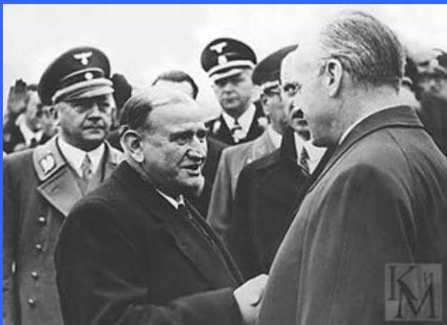
Даладье (слева) и Риббентроп обсуждают детали Мюнхенского соглашения. 1938 год. Мюнхен. Только что подписано Мюнхенское соглашение.