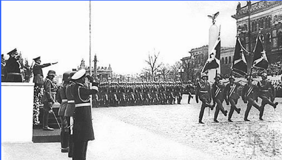
Гитлер принимает парад вермахта, 1940 год (megabook.ru)

Бельгийцы. Когда Германия вторглась на территорию СССР, многие бельгийцы пришли на вербовочные пункты, чтобы принять участие в «крестовом походе против большевизма». Но если фламандские добровольцы поступали в легион СС, то валлоны в основном принимались в армейские подразделения. Получив официальное название 373-го пехотного батальона, легион «Валлония» был придан 100-й егерской дивизии на южном участке советского фронта. Первое крупное сражение легиона произошло у Громовой Балки во время советского контрнаступления зимой 1941 года, где валлонское подразделение потеряло до 30% личного состава. Легион принимал участие в форсировании Днепра 2 ноября и провел зиму в долине Донца. В марте 1942 года, потеряв треть личного состава и 20 из 22 офицеров, легион был отведен с линии фронта. Вновь принять участие в сражениях ему довелось в мае в битве за Харьков, а также в июле во время общего наступления немецких войск, когда он был прикреплен к 97-й пехотной дивизии. С тяжелыми боями легион достиг Майкопа. Снова разбитый, он был выведен в Германию на реорганизацию, был преобразован в бригаду СС «Валлония», которую, в свою очередь, впоследствии переформировали в 28-ю добровольческую танково-гренадерскую дивизию СС «Валлония».