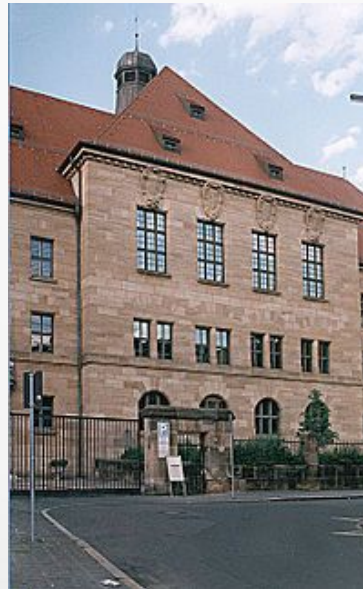
Здание суда присяжных. Нюрнберг