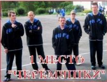
1 МЕСТО "ЧЕРЕПУШКИ"