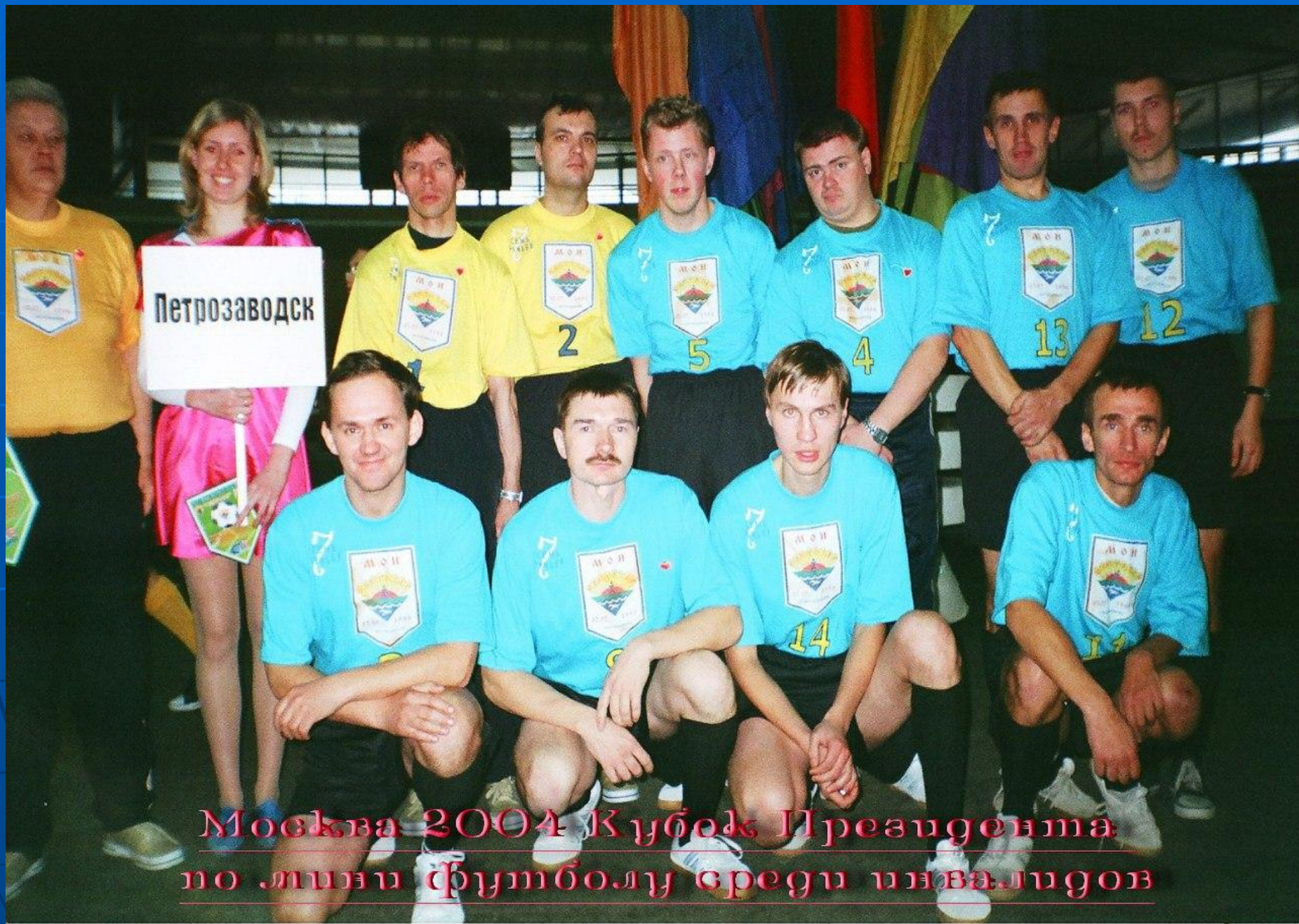
Москва 2004 Кубок Президента по мини футболу среди инвалидов