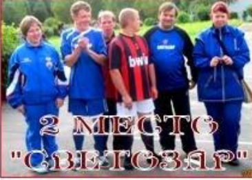
2 МЕСТО "СВЕТОЗАР"