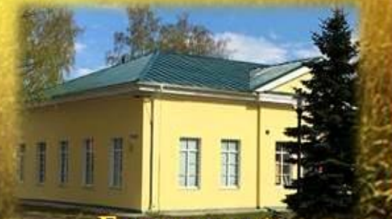
Городской Дом Культуры