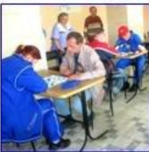
1 МЕСТО "ЧЕРЕПУШКИ" 29 АВГУСТА 2012 2 МЕСТО "СВЕТОЗАР"