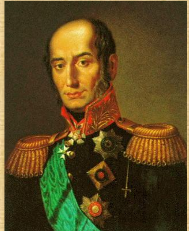
Генерал М.Б. Барклай-де-Толли