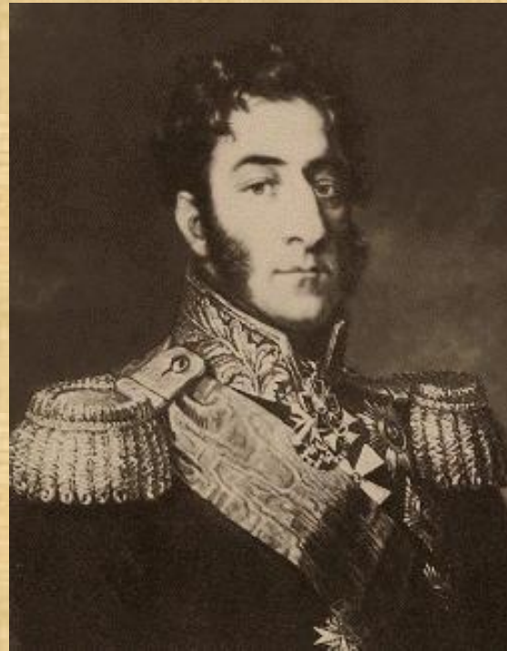
Генерал П.И. Багратион