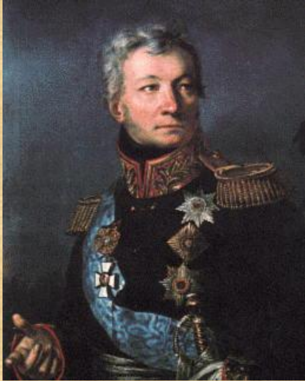
Генерал А.П. Тормасов