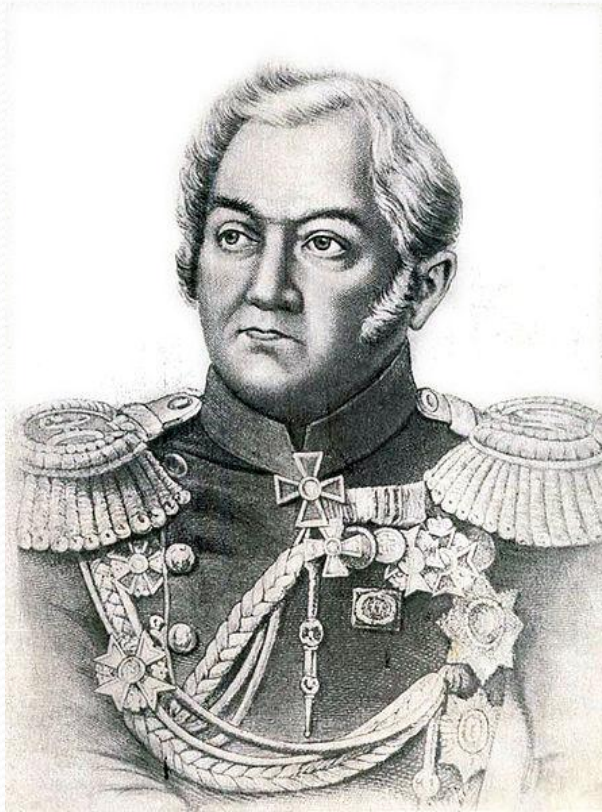
Михаил Петрович Лазарев