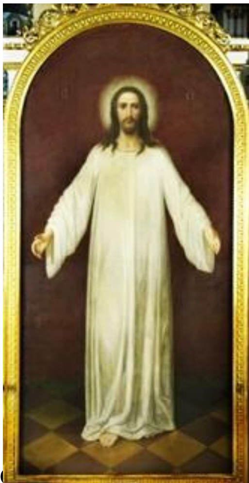
Иисус Христос в хитоне