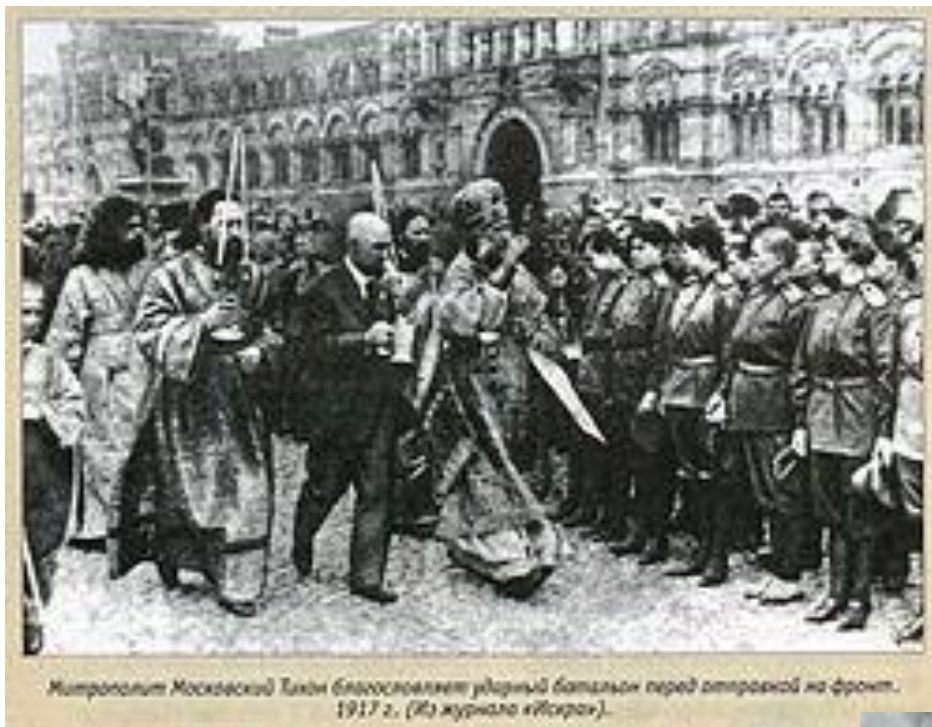
Митрополит Московский Тихон благословляет ударный батальон перед отправкой на фронт, 1917 г. (Из журнала «Искра»).

Митрополит благословляет батальон перед отправкой на фронт, 1917г.