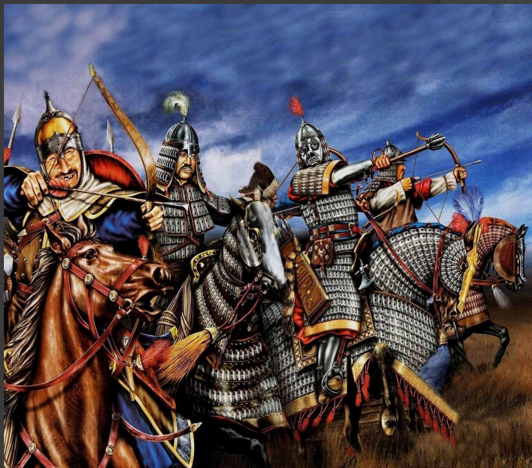
МОНГОЛЬСКАЯ ТЯЖЁЛАЯ КОННИЦА

Огромное монгольское войско отличалось высокой боеспособностью, железной дисциплиной, четкой организацией. Большое внимание уделялось разведке территорий и вооруженных сил противника.