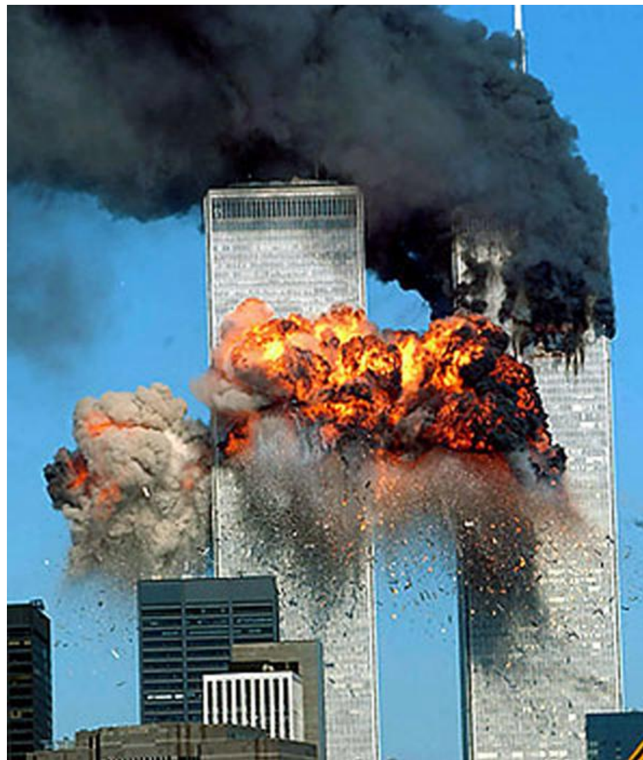
11 сентября 2001 год