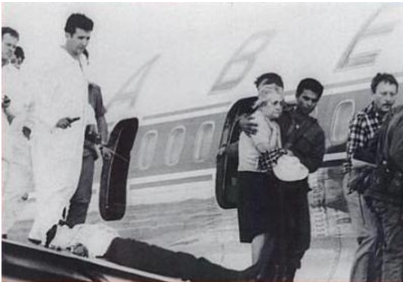
Освобождение заложников рейса «Сабена 572». Операция «Изотоп», 1972 год