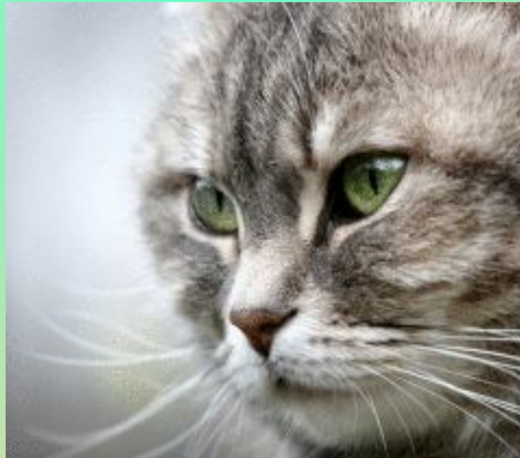
Усы – «вибриссы»