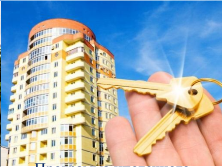
Программа ипотечного кредитования