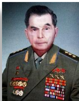
Ильюшин Сергей Владимирович

Выдающийся авиаконструктор и ученый, основатель одноименного конструкторского бюро, в дальнейшем ОАО «Ил». Генеральный конструктор, академик АН СССР, генерал-полковник-инженер. Под его руководством создан легендарный самолет штурмовик Ил-2, Ил-14, Ил-18, Ил-62. Вклад, который внес Сергей Владимирович в развитие воздушного транспорта, прогресс технических наук и технологии авиационной промышленности, неоценим. Трижды Герой Социалистического Труда, лауреат семи Сталинских премий, Ленинской премии и Государственной премии СССР. Награжден многочисленными орденами и медалями. Генеральный конструктор ОКБ им. С.В. Ильюшина в период с 1970 по 2005г., академик РАН, доктор технических наук, заслуженный конструктор РФ. Под руководством Генриха Васильевича созданы самолеты: тяжелый военно-транспортный Ил-76, являющийся основным самолетом ВТА России, первые отечественные пассажирские широкофюзеляжный Ил-86 и дальнемагистральный Ил-96, легкий многоцелевой Ил-103, региональный Ил-114, реактивный штурмовик Ил-102. Дважды Герой Социалистического Труда, лауреат Ленинской премии, награжден многочисленными орденами и медалями.