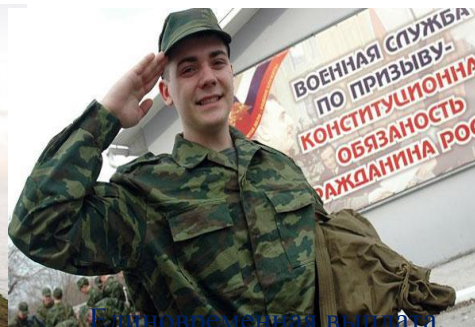
Единовременная выплата при возвращении из рядов Вооруженных Сил РФ – 15 000 руб.