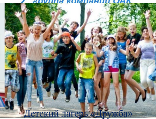
Детский лагерь «Дружба»