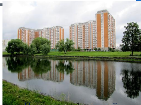
Программа частичной денежной компенсации найма жилья