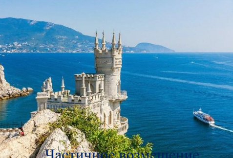
Частичное возмещение за санаторно-курортное лечение в санаториях и пансионатах 50%