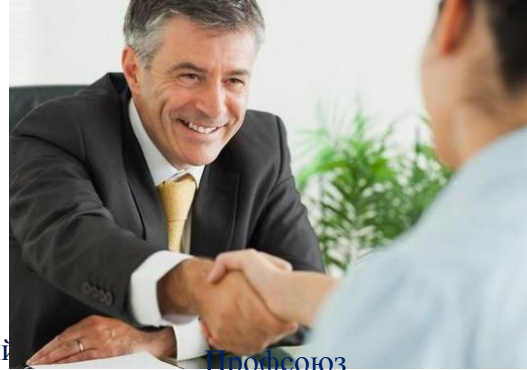
Профсоюз Совет молодых специалистов