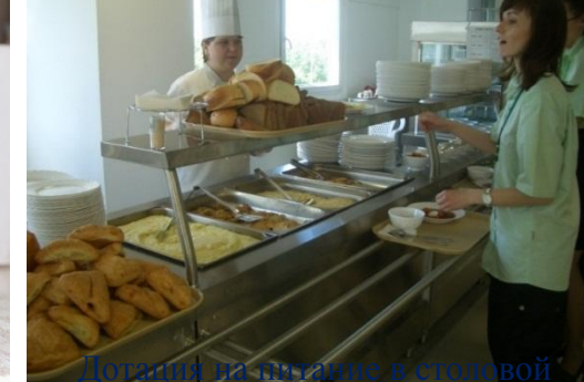
Досуг и питание в столовой Предприятия.