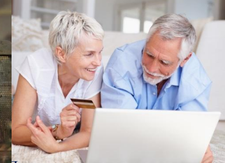
Программа негосударственного пенсионного обеспечения