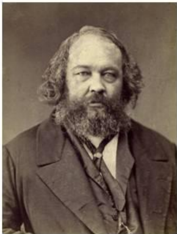
Михаил Александрович Бакунин