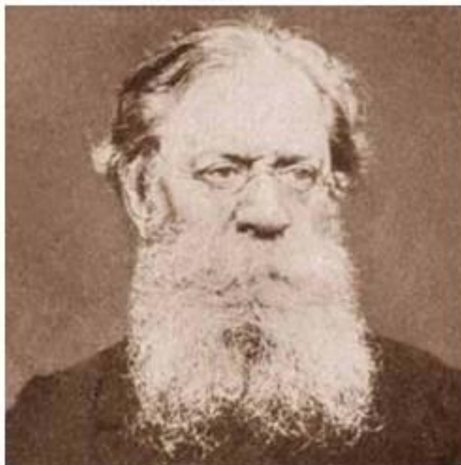
Петр Лаврович Лавров