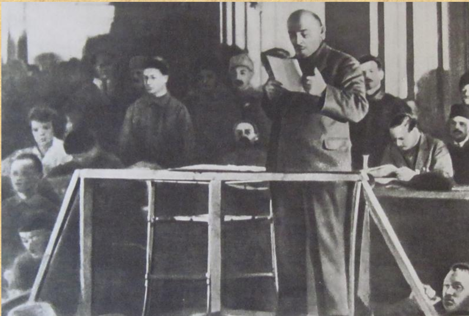
В.И. Ленин читает доклад о переходе к НЭПу на X съезде РКП (б)