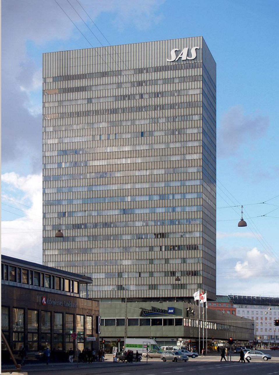
Отель Рэдиссон Блу Роял (англ.)русск. в Копенгагене