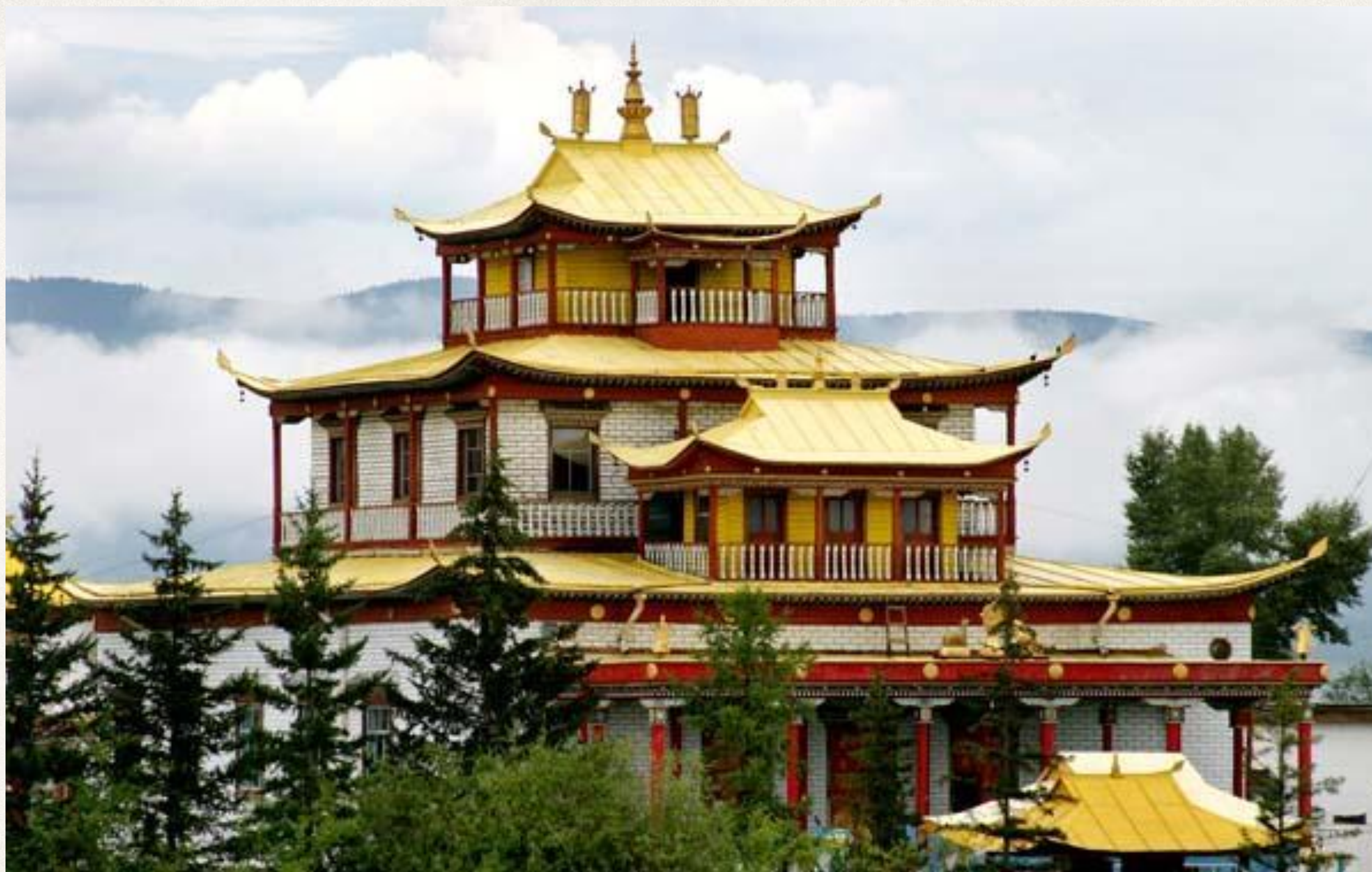
Иволгинский дацан. Бурятия