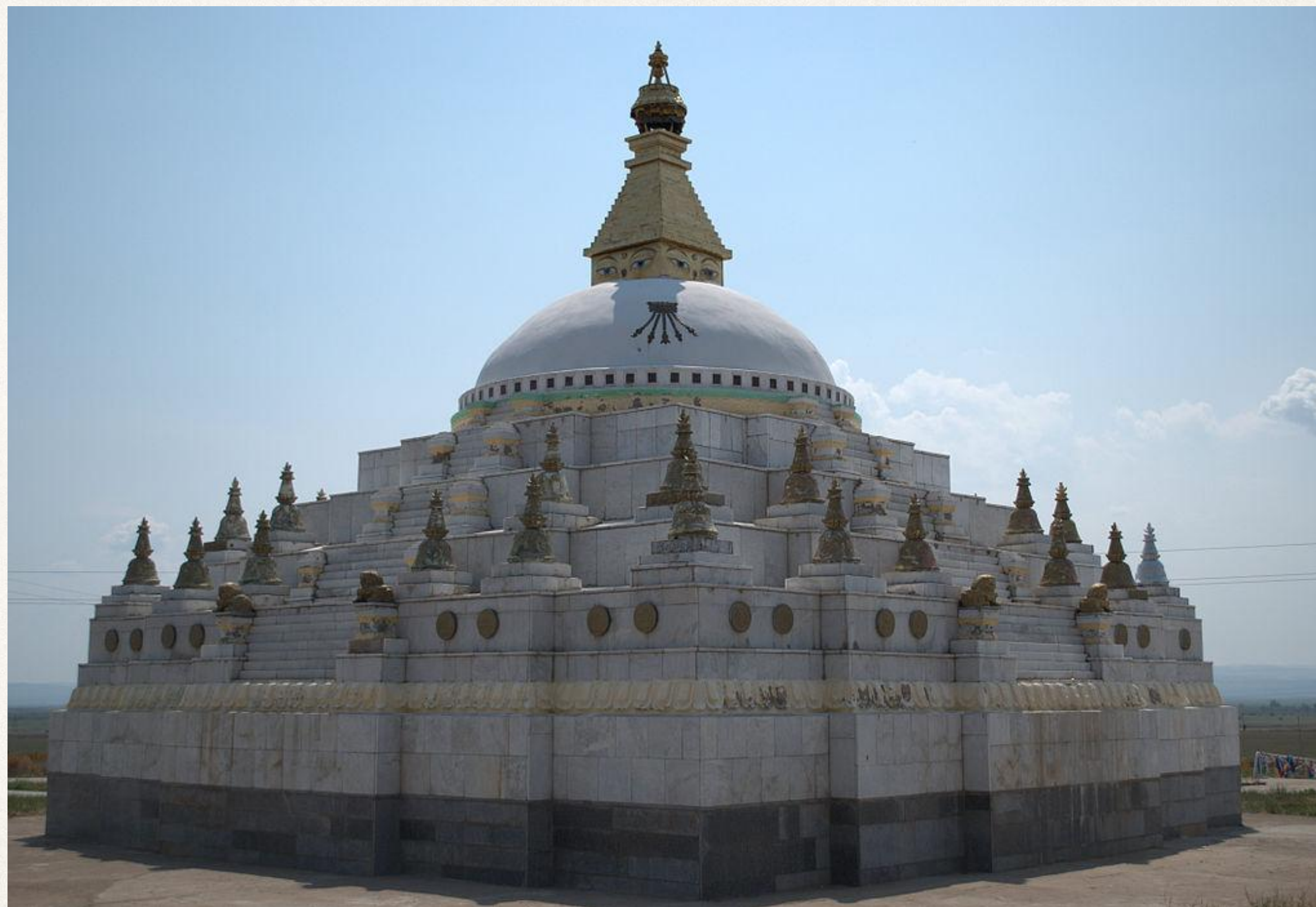
Ступа Джарун Хашор. Бурятия