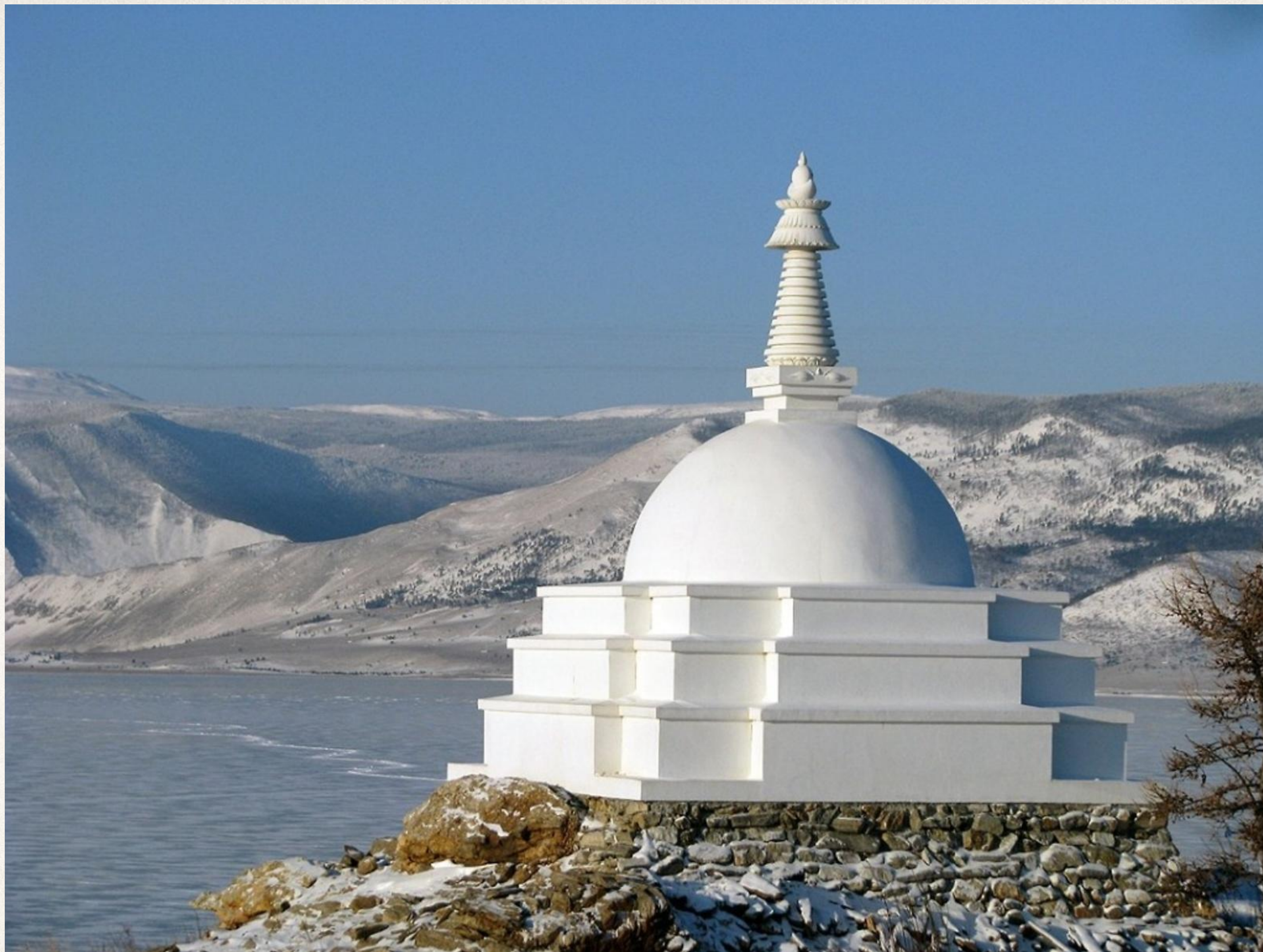
Буддийская ступа на озере Байкал