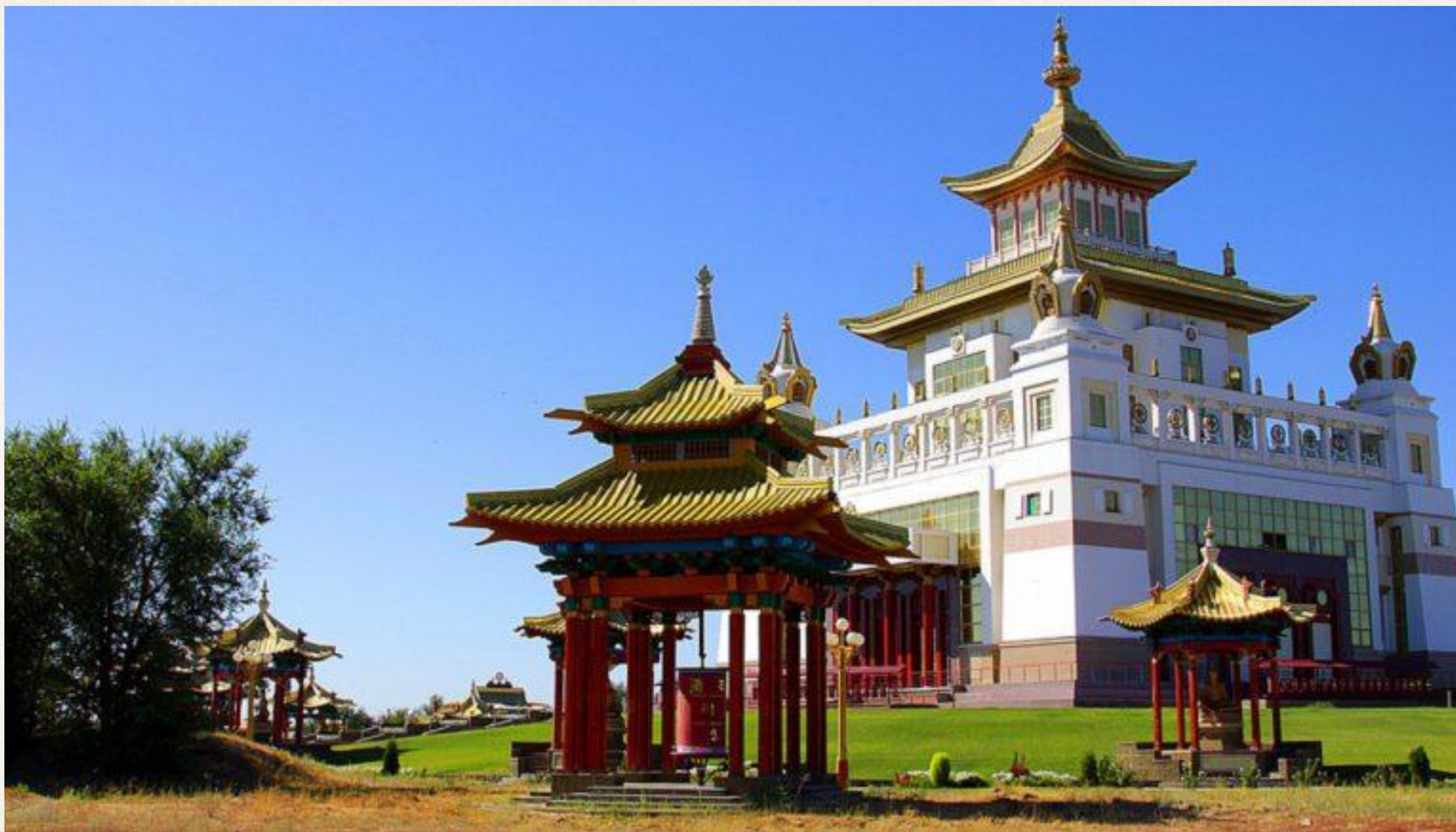
Храм Будды в Элисте. Калмыкия