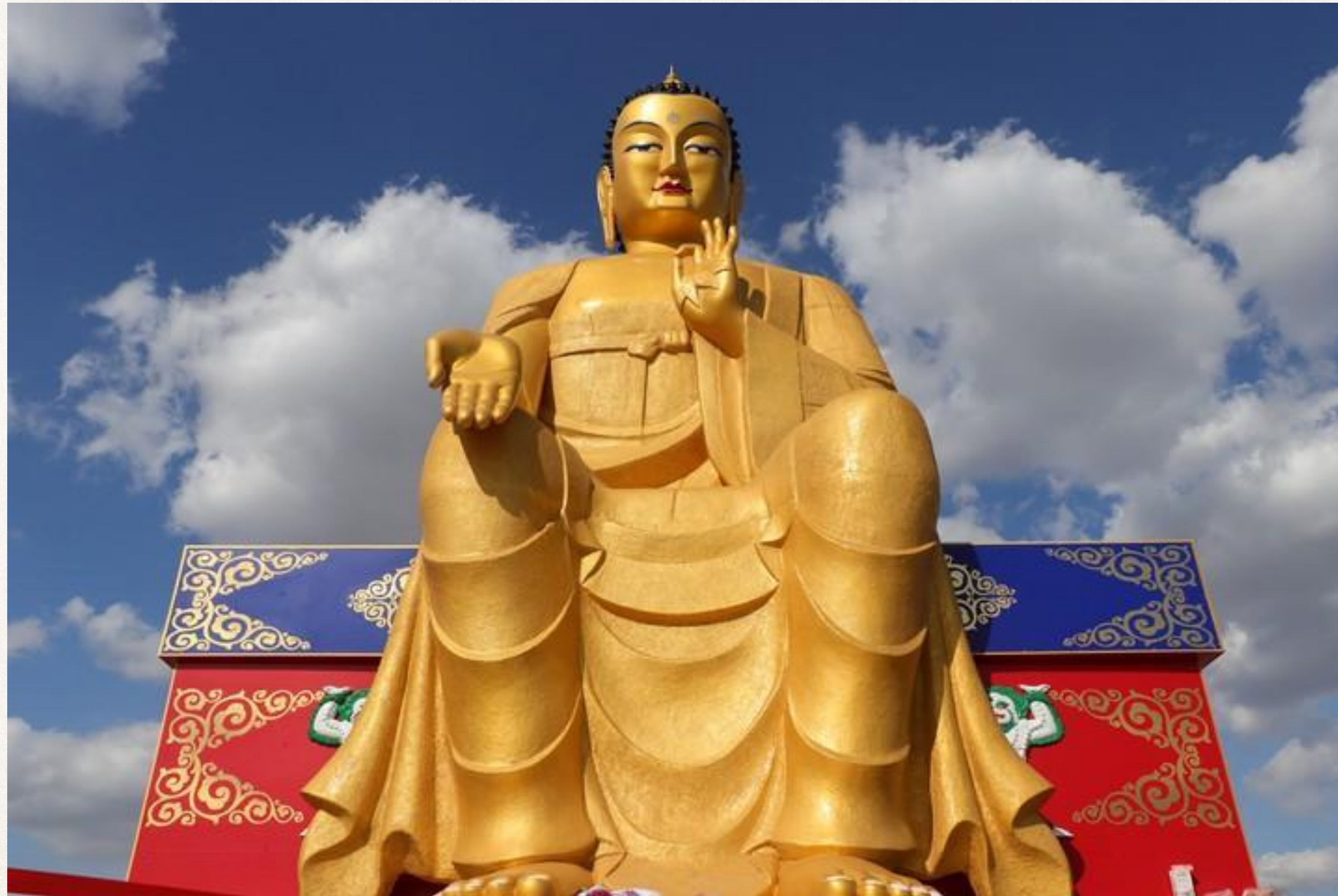
Скульптура Будды в Калмыкии