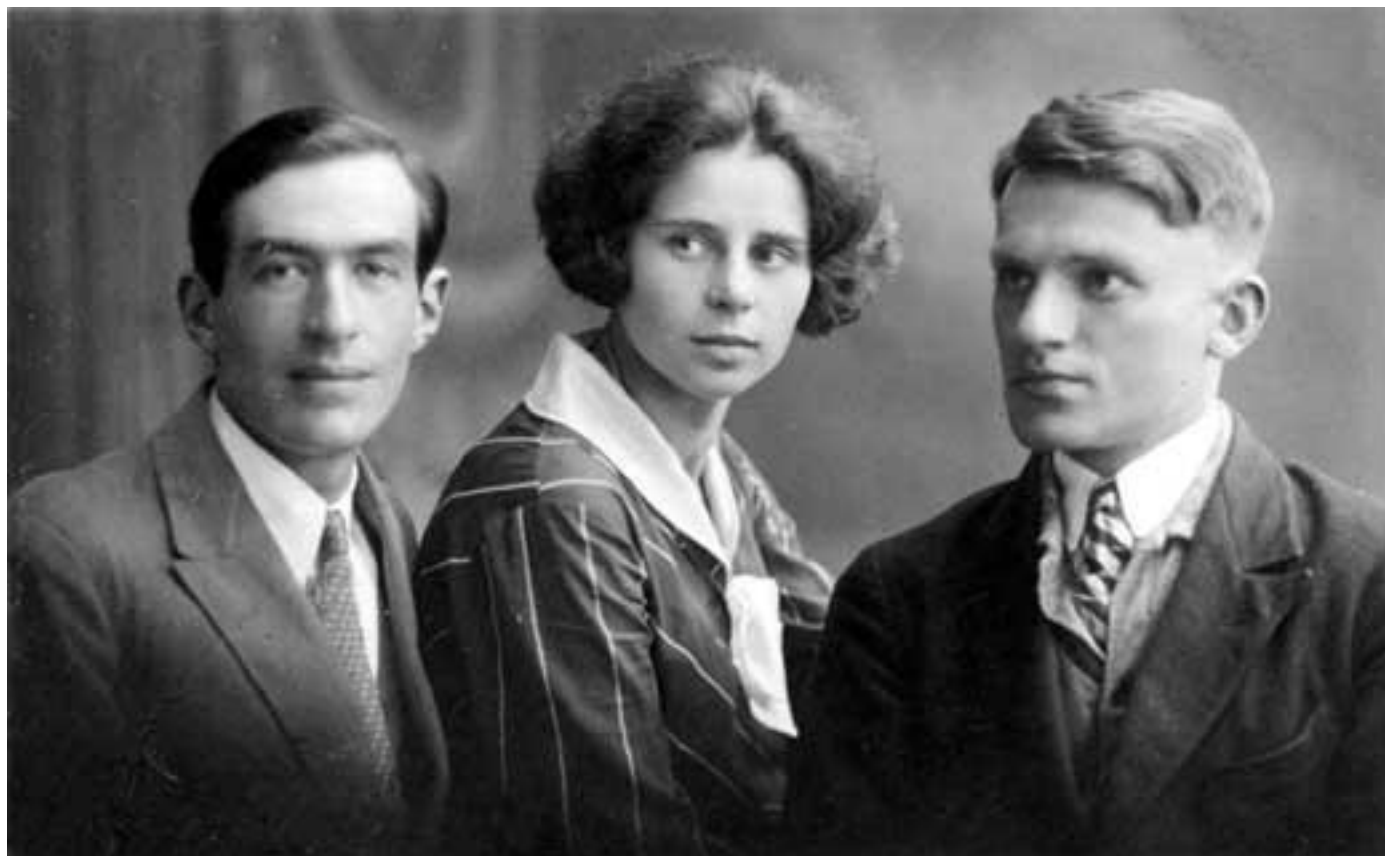
Рис. 18. А.Н. Леонтьев, Л.И. Божович, А.В. Запорожец. Начало 30-х гг.