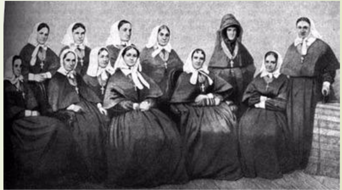
Сестры милосердия на Крымской войне

К моменту начала Крымской войны Екатерине Михайловне было 40 лет. В числе первых добровольцев она пожелала немедленно отправиться на фронт. Но попасть туда оказалось делом непростым. Родственники даже не хотели слышать о ее намерениях. Письменные просьбы в канцелярию великой княгини о зачислении в Крестовоздвиженскую общину сестер милосердия, которая была учреждена в Петербурге в начале Крымской войны по инициативе великой княгини Елены Павловны, оставались без ответа. И все-таки благодаря упорству Екатерина Михайловна добилась своего. В Крестовоздвиженской общине она прошла начальную медицинскую подготовку. Двоюродный брат, офицер Александр, знавший ее характер и волю, рассказывая ей про Крым, про скопления раненых и тифозных, сказал: «Ведь я тебя знаю, тебе теперь еще больше захотелось туда ехать». Тогда желая испытать себя, Екатерина Михайловна стала ежедневно посещать «самую гнусную» из московских больниц.