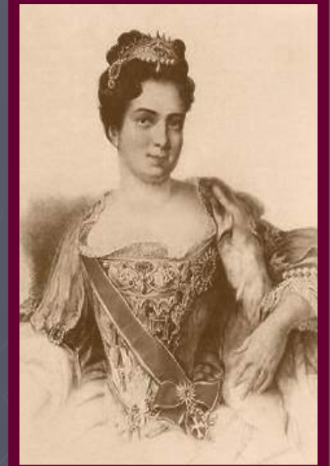
Екатерина (жена Петра)