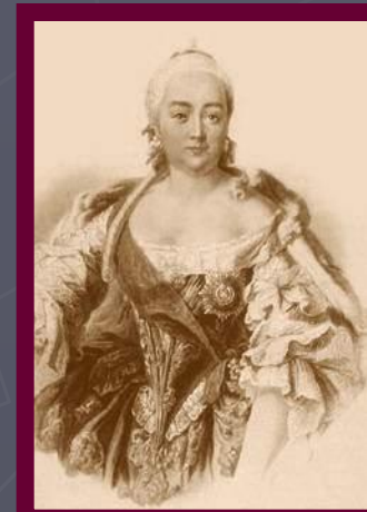
Анна и Елизавета (дочери Петра )