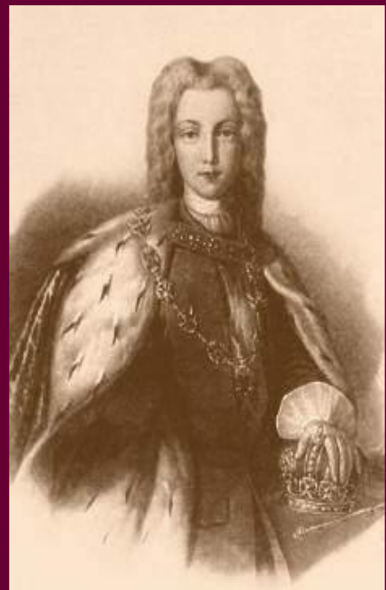
Петр (сын царевича Алексея)