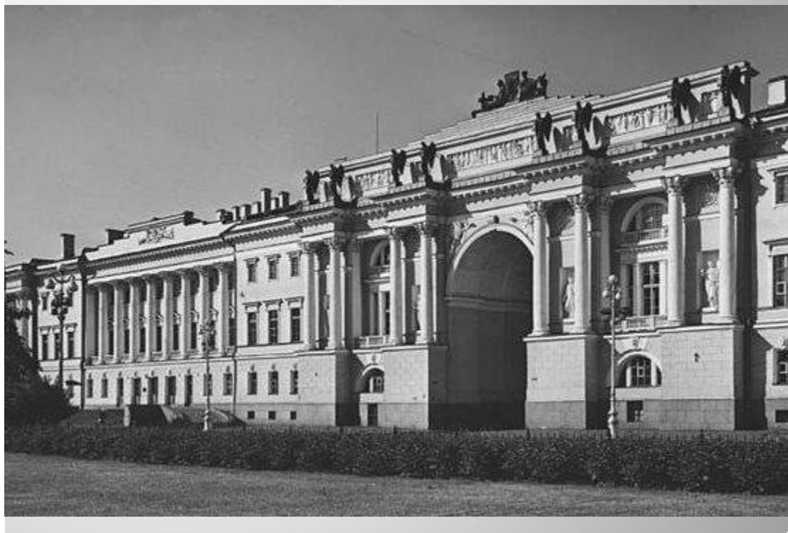
Здание Синода при Петре I, Карл Росси, Санкт-Петербург