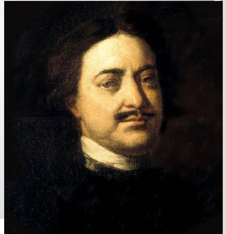
Портрет Петра I Никитин И.