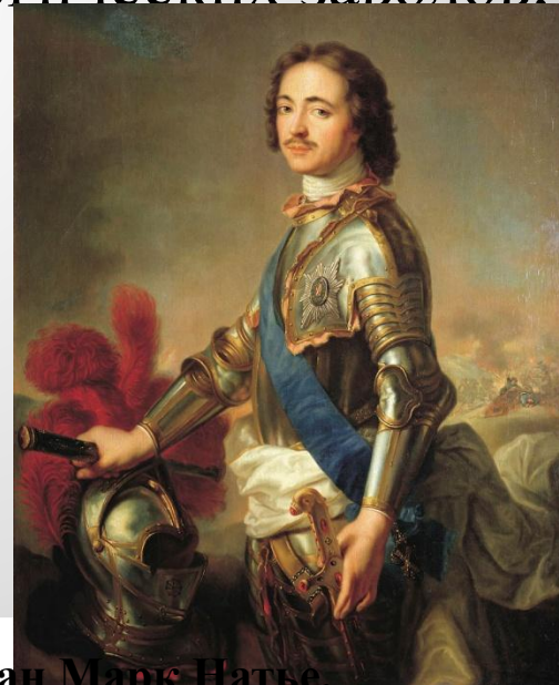
Жан-Марк Наттье. Портрет Петра I в рыцарских доспехах