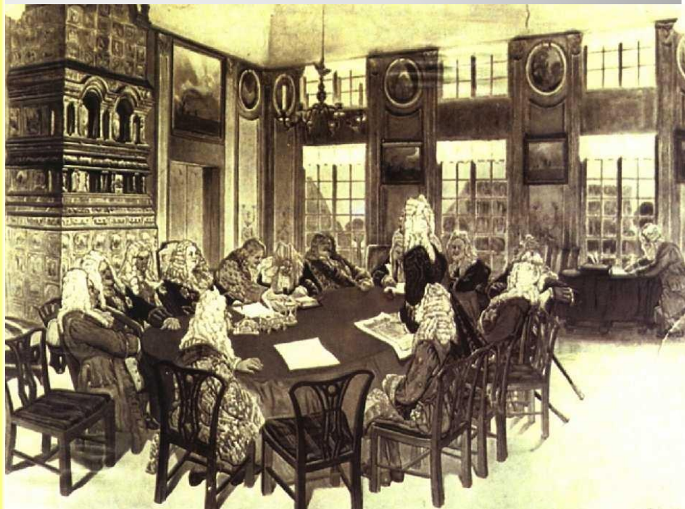
«Заседание Сената при Петре I» Кардовский Д.Н.

Решения в Сенате принимались единогласно .