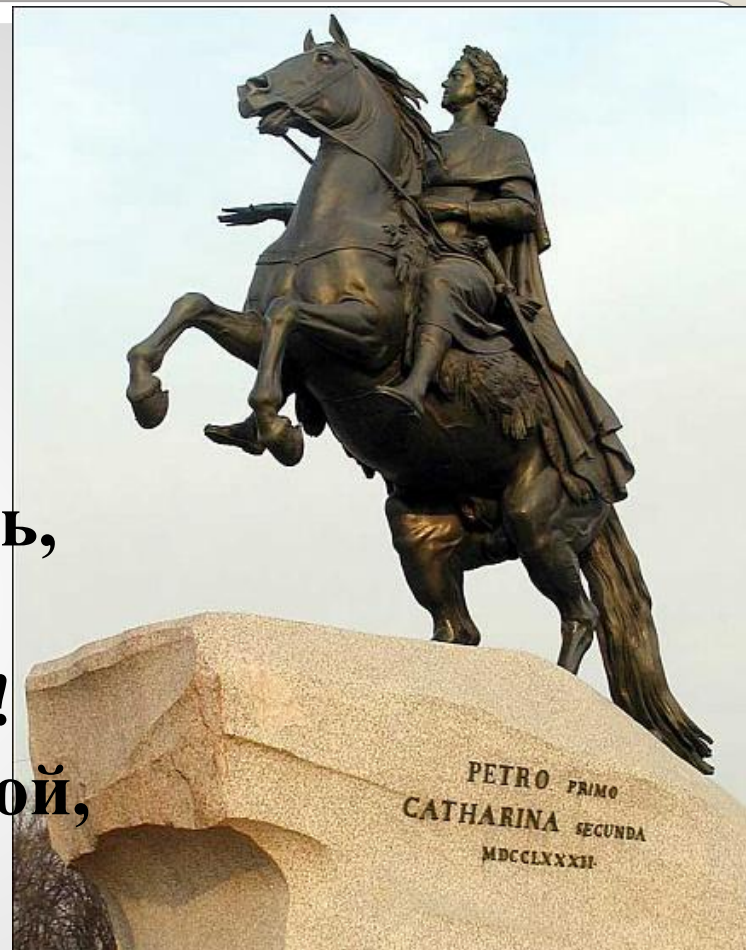
Памятник «Медный всадник», Э. Фальконе г. Санкт-Петербург

«...Какая дума на челе! Какая сила в нем сокрыта! А в сем коне какой огонь! Куда ты скачешь, гордый конь, И где опустишь ты копыта? О мощный властелин судьбы! Не так ли ты над самой бездной, На высоте уздой железной Россию поднял на дыбы?..»