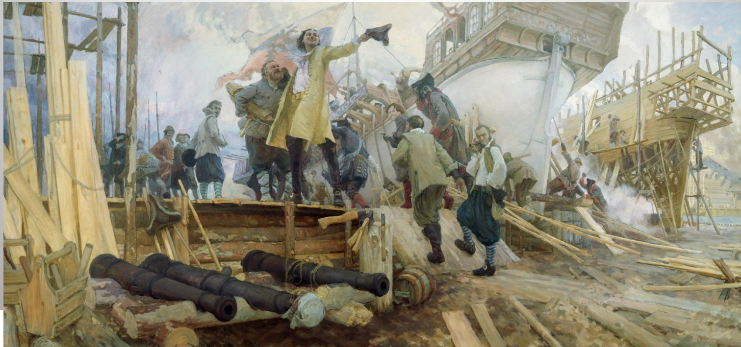
Спуск галеры «Принципиум» на воронежской верфи 3 апреля 1696 года, Кушевский Ю.

Как сильно изменилась жизнь в России после петровских преобразований?