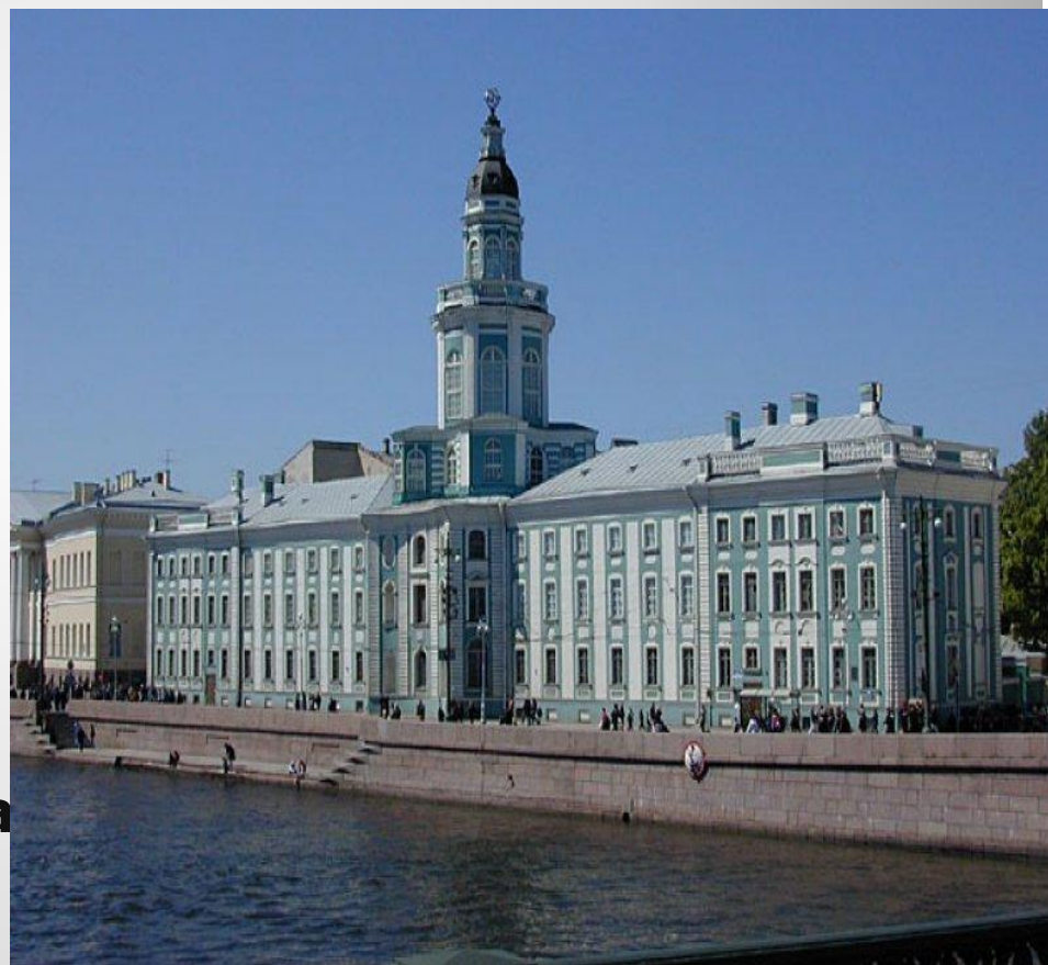
Здание Кунсткамеры, г. Санкт-Петербург