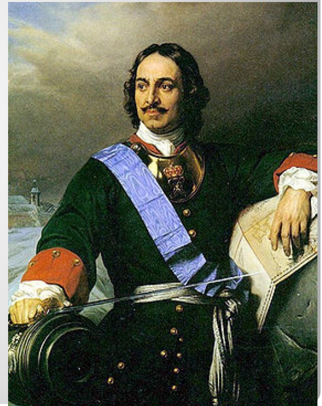
Портрет Петра I. Поль Деларош