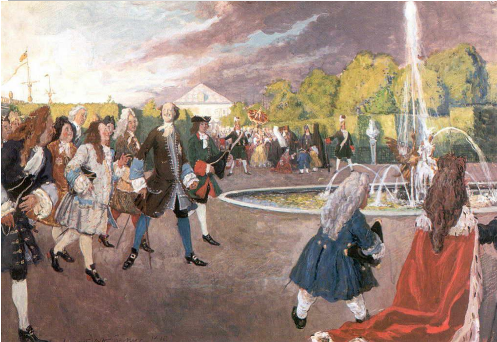
Пётр I на прогулке в Летнем саду

Какие из преобразований Петра I кажутся Вам наиболее значимыми? Объясните, почему.