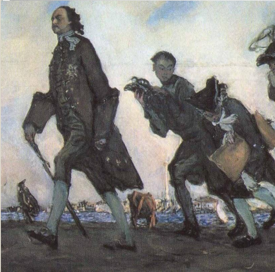
В. Серов «Петр I»