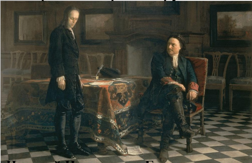
Николай Николаевич Ге. Петр I допрашивает царевича Алексея