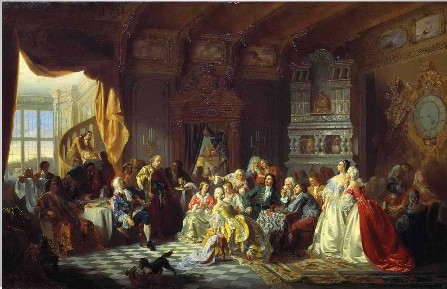
«Ассамблея при Петре 1» Хлебовский С.