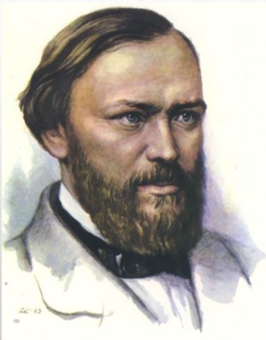
Александр Николаевич Островский (1823—1886)