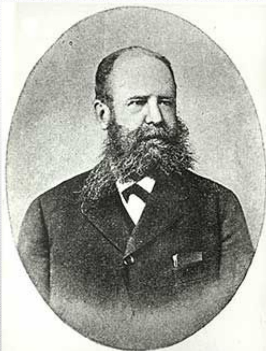
Николай Федорович Фанъ-дерь-Флитъ. Род. 7 Ноября 1840 † 27 Ноября 1896 г.