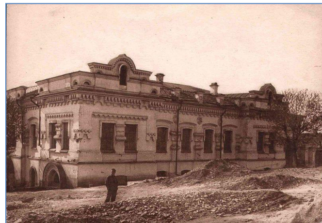
Дом купца Ипатьева в Екатеринбурге, где 17 июля 1918г. была расстреляна царская семья

Насилие в годы Гражданской войны стало нормой поведения населения страны. Белогвардейские войска и Красная Армия имели свои карательные отряды , жертвами которых стали сотни тысяч человек. Формально «красный террор» был провозглашен в ответ на «белый», после покушений на лидеров Советского государства, мятежей в центре России.