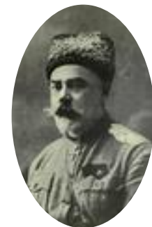
Деникин А. И.