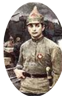
Тухачевски й М.