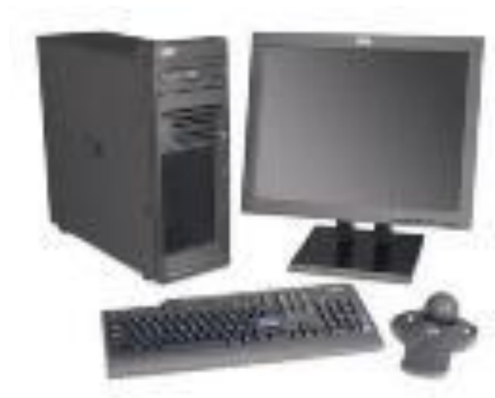
целостная система (компьютер)