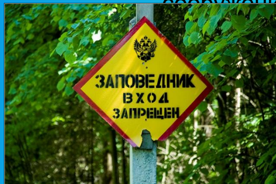
Заповедники для охраны животных