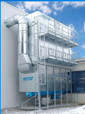
Воздухоочистительное сооружение на заводах