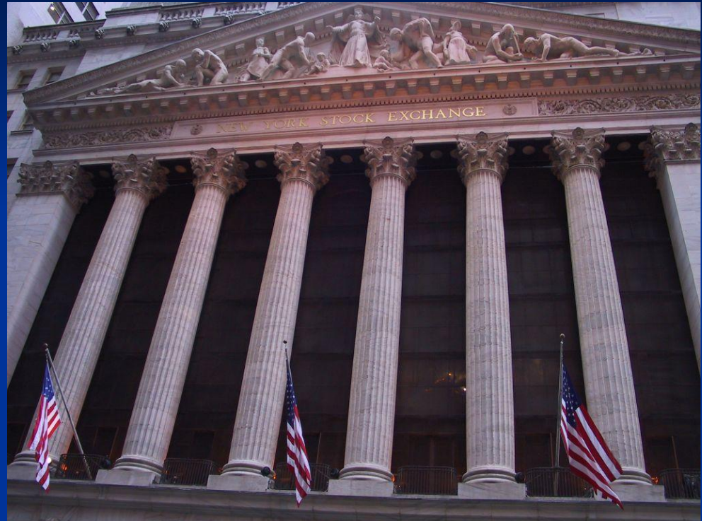
Нью-Йоркская фондовая биржа