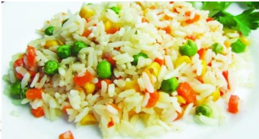
Рис с овощами 120г