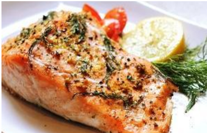
Лосось, запеченный с овощами 150г. 388р