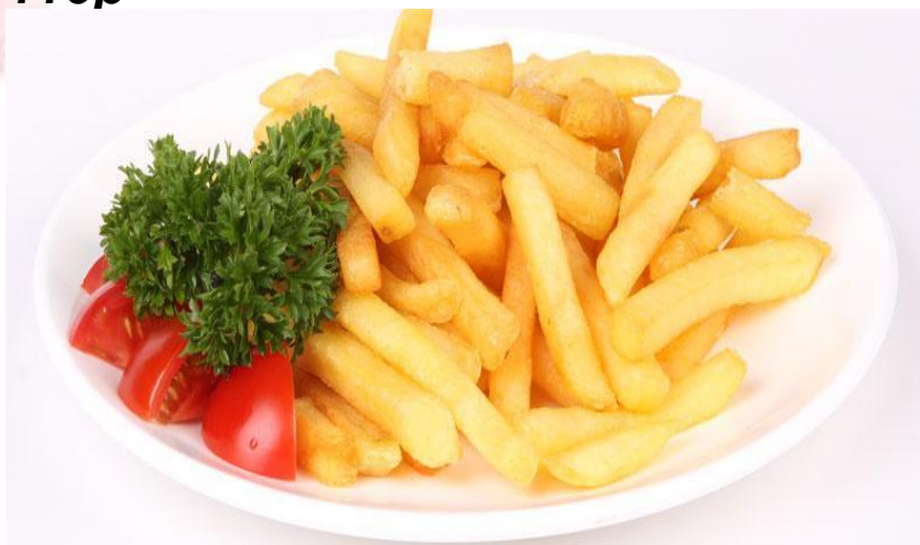
Картофель фри 100г. 130р