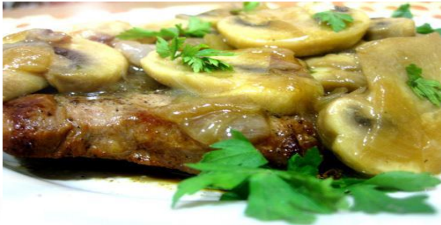
Свинина по-яснополянски 150г (с шампиньонами)