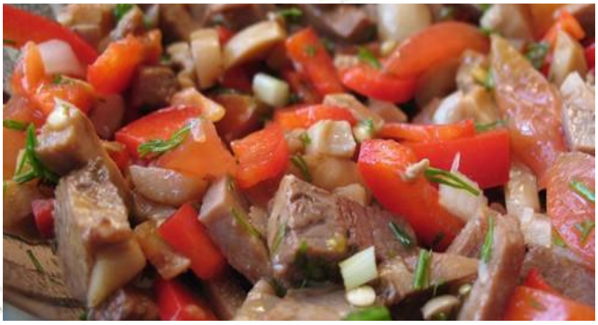
«Особый» (говядина обжаренная, шампиньоны, лук, кунжут, стручковая фасоль, оливковое масло, зелень).....250р

(говядина, шампиньоны, огурцы, помидоры, кукуруза, масло