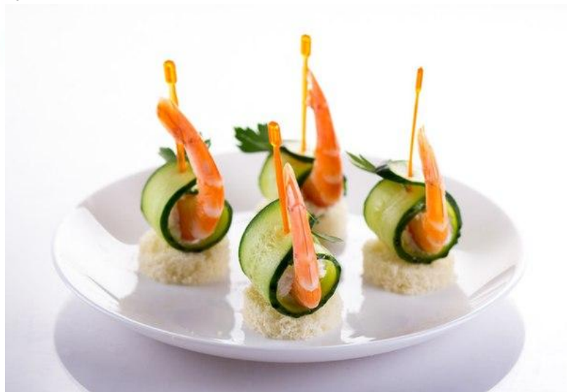
Канapé «Парусник» 60 гр. (сыр, креветка, огурец) 85р