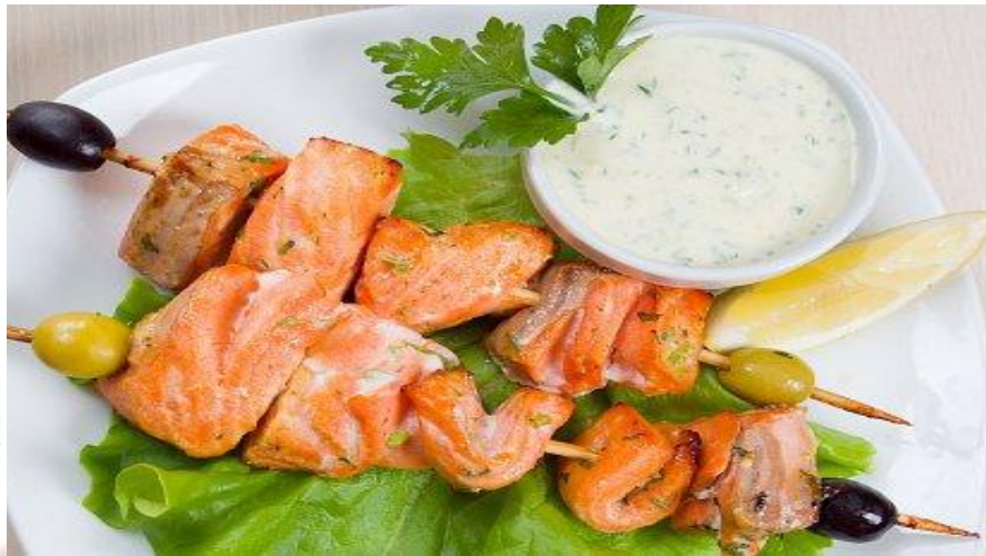
Шашлык из форели 120г. 392р