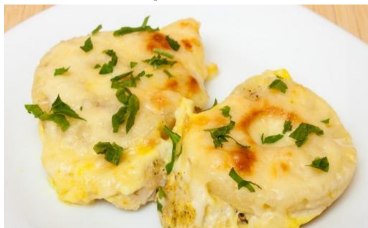
«Наслаждение» 150г (куриное филе с ананасом под сыром) ..... 295р