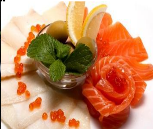
Ассорти рыбное 100г ..... 320р