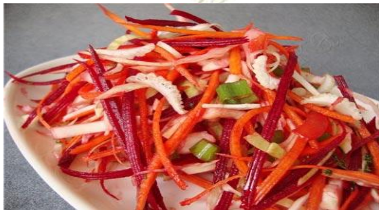
«Фитнесс» (фирменный) (свежие морковь и свекла, яблоко, лимонный сок, соус.