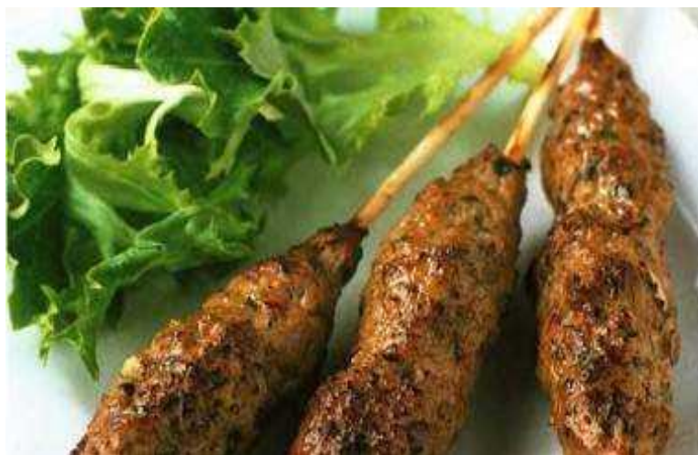
Люля-кебаб из баранины 120г 356р