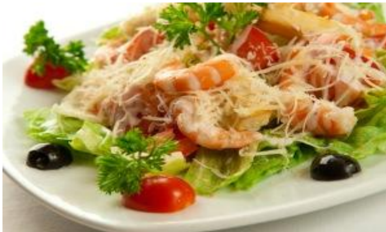
«Релакс» (лист салата, креветки, сухарики, маслины, сыр, яйцо, соус цезарь, помидоры черри) 295 р.