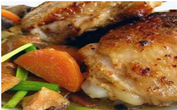
«Ореховое наслаждение» курица жареная с грецким орехом и миндалем ¼ часть курицы 250г.....350р