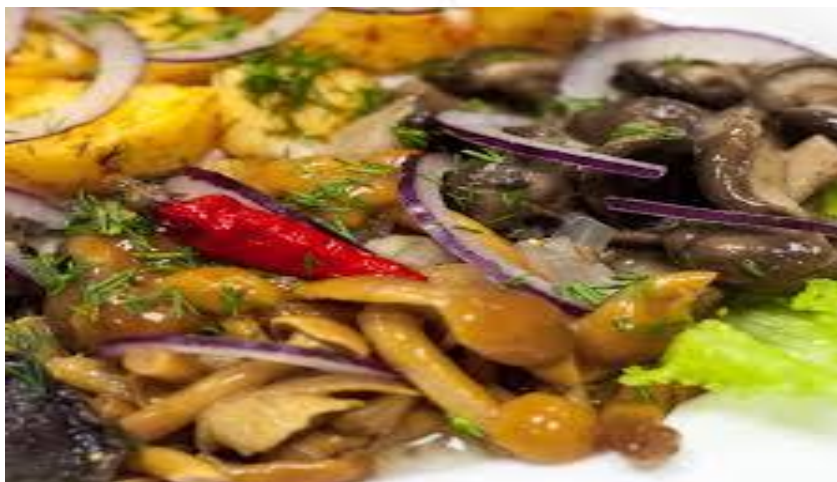
Закуска « Грибное лукошко» 100г (грузди, опята, маслята, зелень)..... 210р