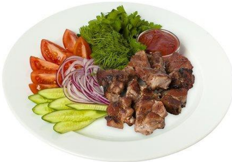
Шашлык из свинины 120г (подаётся со свежими овощами)..... 320р