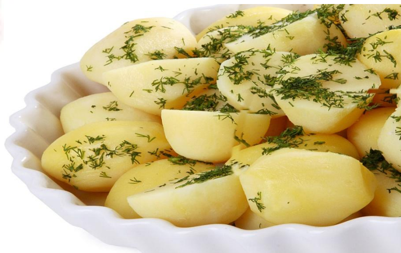
Картофель отварной по-деревенски (с зел. луком) 150г.....110р