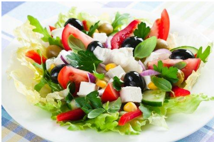
Закуска «Балканская» 100г (брынза, оливки, помидоры свежие, зелень) 230р