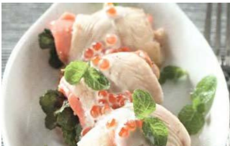
«Рулетики креатив» 150 (сельдь слабосоленая, яблоко, яйцо куриное , зелень, икра лосося ) 220 р.