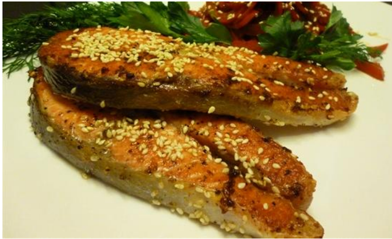
«Царская рыбка» 130г (филе пангасиуса, запеченное с кунжутом)..... 256р.