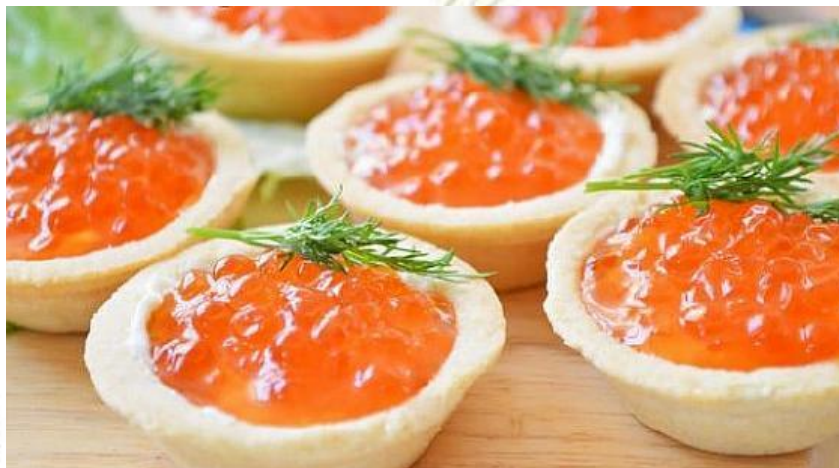
Тарталетки с икрой лосося 5/10г..... 100р

Канapé «Парусник» тост, креветка, сыр, огурец