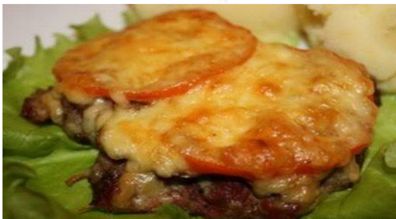
«Нежность» свинина отбивная со специями, сыром и помидором 150г.....328р