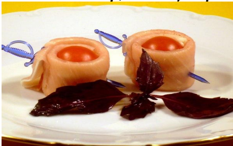
Канapé «Красная красавица» семга с/с, помидоры черри, сыр сливочный, базилик. 132р.