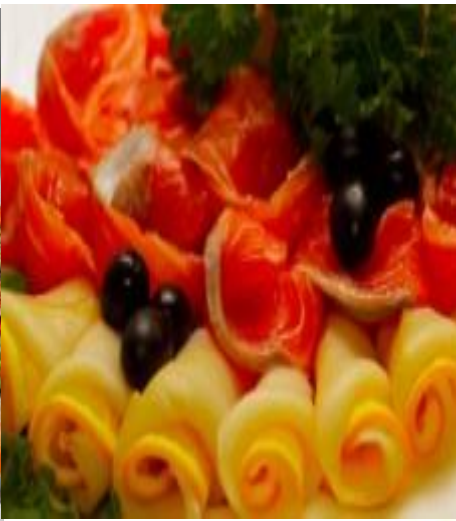
Ассорти из изобилие морепродуктов 100 г(крабы, креветки, мидии) 420 р Рыбное (в декоре с маслинами, лимоном, апельсином и зеленью): 320р