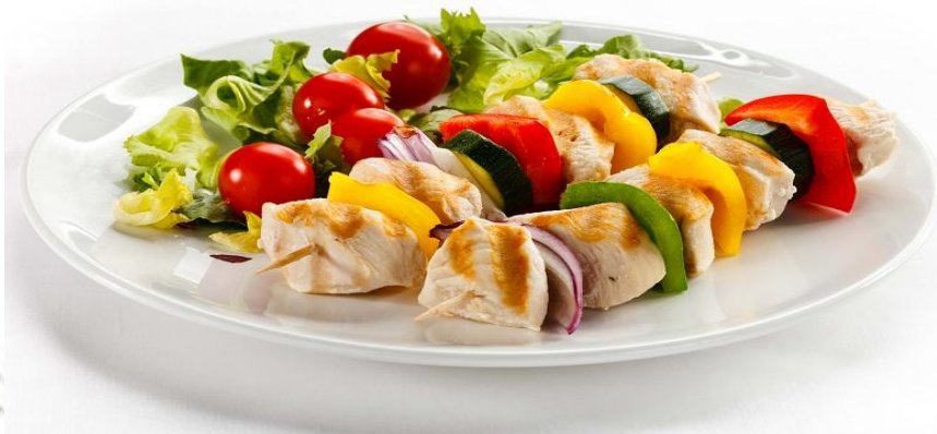
Шашлычок из курицы с овощами 150г 285р