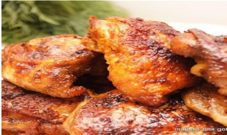
Цыпленок в гранатовом соке 150 гр. 295 р.