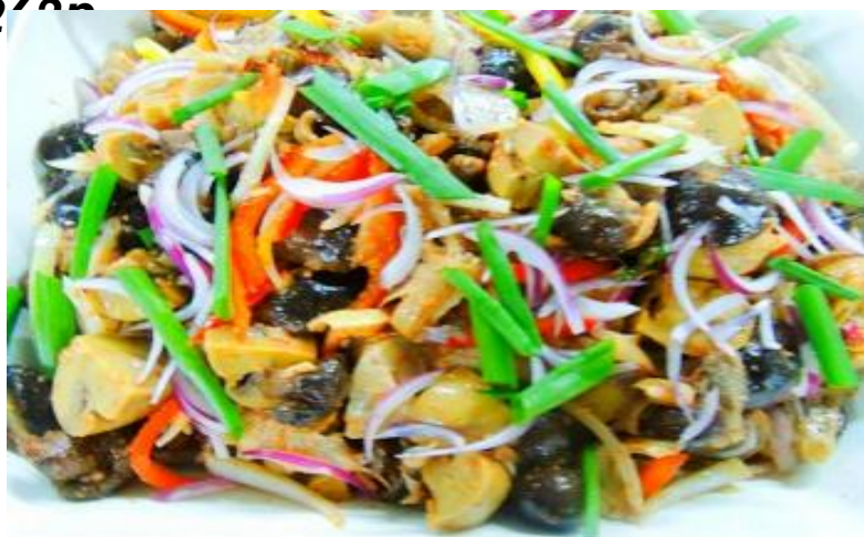
«Парад грибов» (грибы, лук зеленый, перец болгарский) 100г 262р