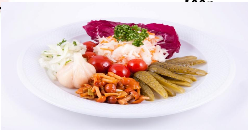
Закуска «Под водочку» 150г (огурцы и помидоры маринованные, грибы соленые, капуста квашеная, заправка, зелень) ..... 256р