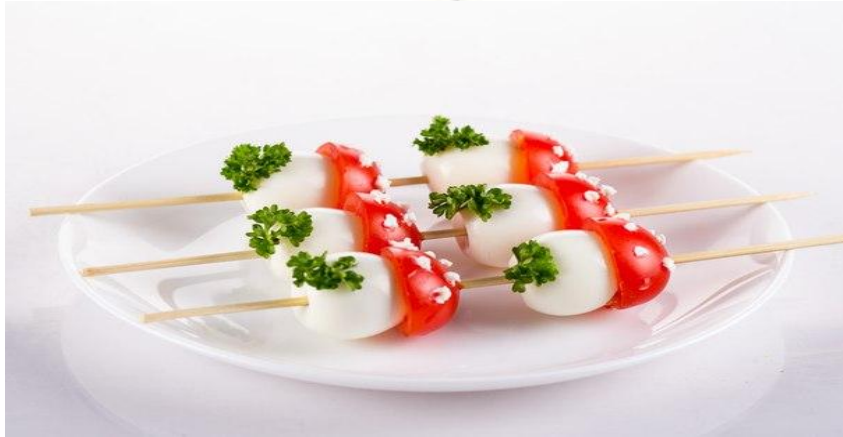
Канapé «Грибок» 60 гр (перепелиное яйцо, черри, пикантный сыр, зелень) 82р