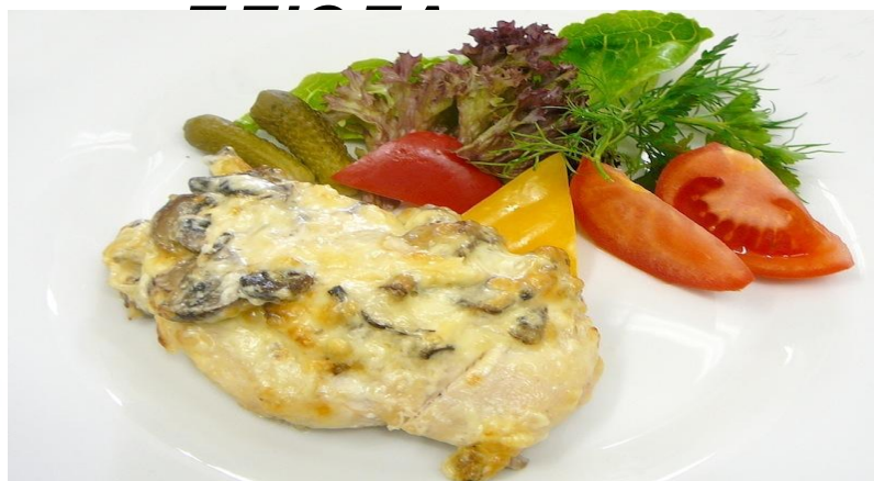
«Франция» 150г (куриное филе с шампиньонами под сыром)..... 296р