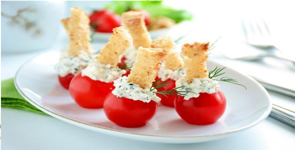
Закуска «Сербская» 80г (помидоры, фаршированные сырно-чесночной пастой, зелень)