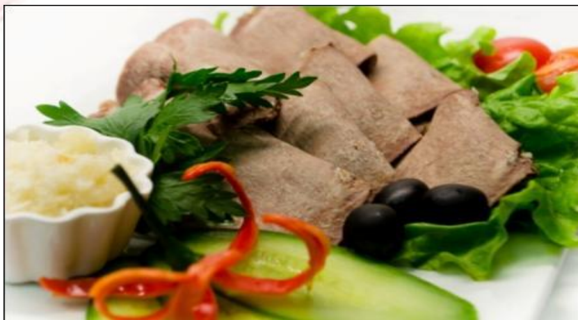
Закуска « Особая» 100г (язык говяжий с хреном и зеленью)..... 250р