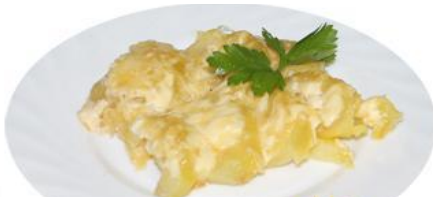
Картофель запеченный с сыром 120г .....128р