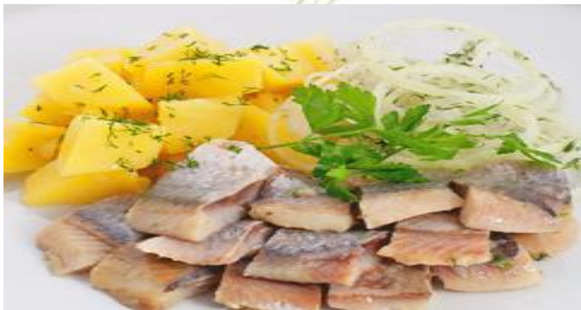
Нежнейшая селёдочка под водочку 150г (сельдь с/с, картофель отварной, зелень) ..... 192р