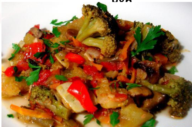
Овощное рагу 100г

(брокколи, баклажан, кабачок, фасоль стручковая, морковь, перец болгарский)