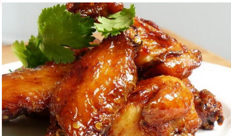
Куриные крылышки в глазури 150г..... 256р