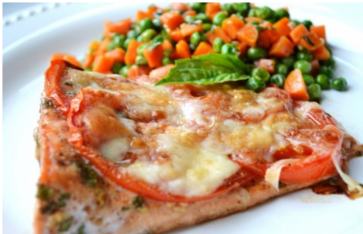
Филе кеты под овощами 180г. 260р.