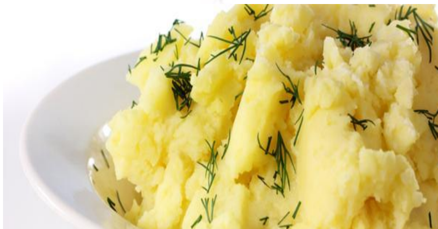
Картофельное пюре с укропом 120г. 118р