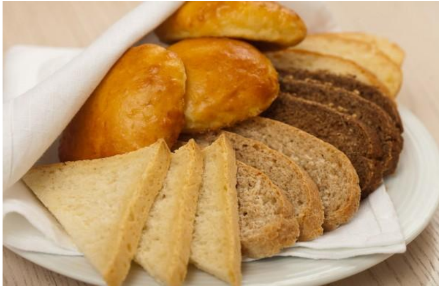
Хлебная корзина 300г .....82р