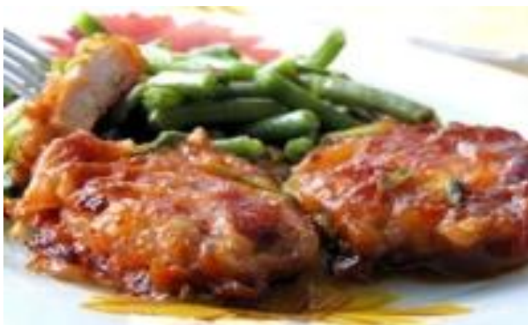
«Эскалоп» 150г (отбивная из свинины с овощами) ..... 318р