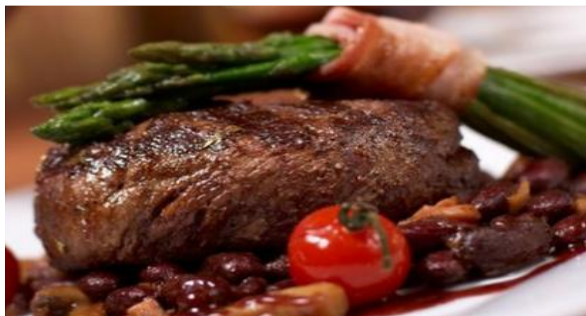
Телятина в винном соусе 130г. 386р