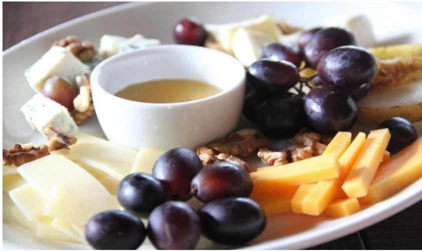
Сырная тарелка с виноградом, грецким орехом и мёдом 100г ..... 240р