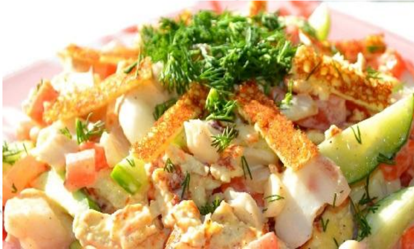
«Гибралтар» (кальмар, огурец свежий, яичные блинчики, яблоко, соус, зелень .....206 р.