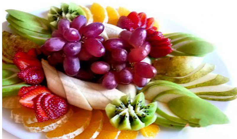
Фруктовая корзина 1кг ...450р