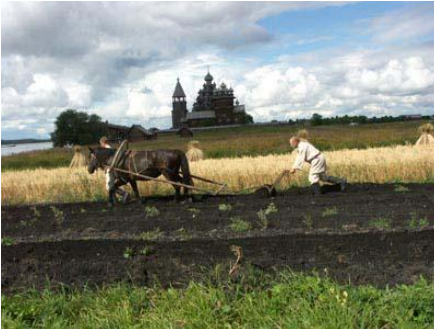
ВЕНЕЦИАНОВ «НА ПАШНЕ»