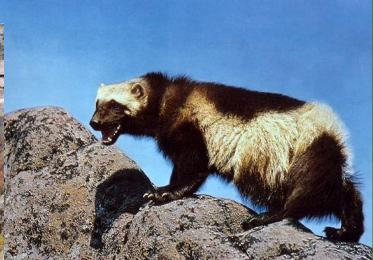
р о с о м а х а