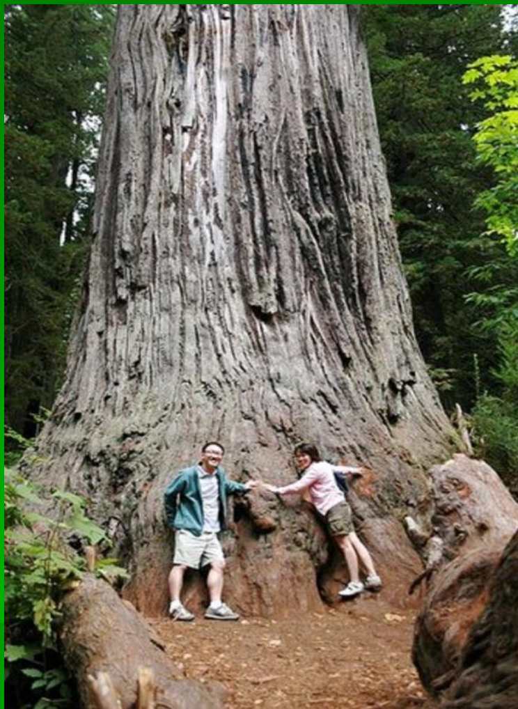
Секвойя в Национальном парке

Некоторые виды секвойи доживают до 4000 лет