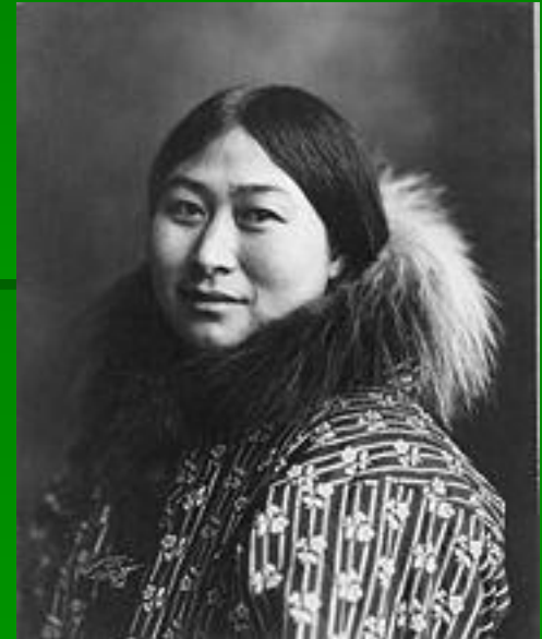
Э С К И М О С К А