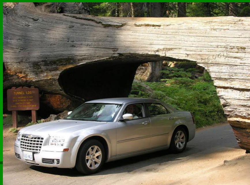
Тоннель в стволе секвойи

Некоторые виды секвойи доживают до 4000 лет