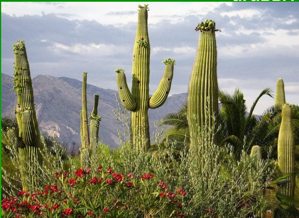
Кактусы Мексиканского нагорья

Какая природная зона не образует сплошной полосы, а напоминает мозаику, где преобладают кактусы и агавы?