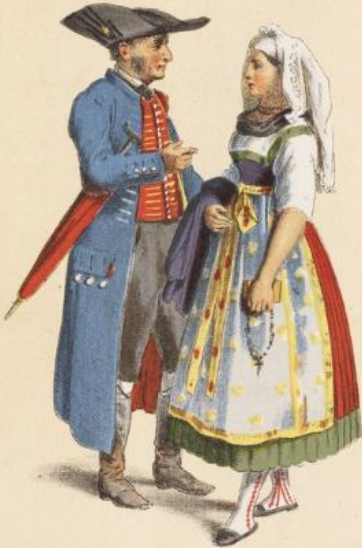
BAVARIA. Franconien, Switzerland.