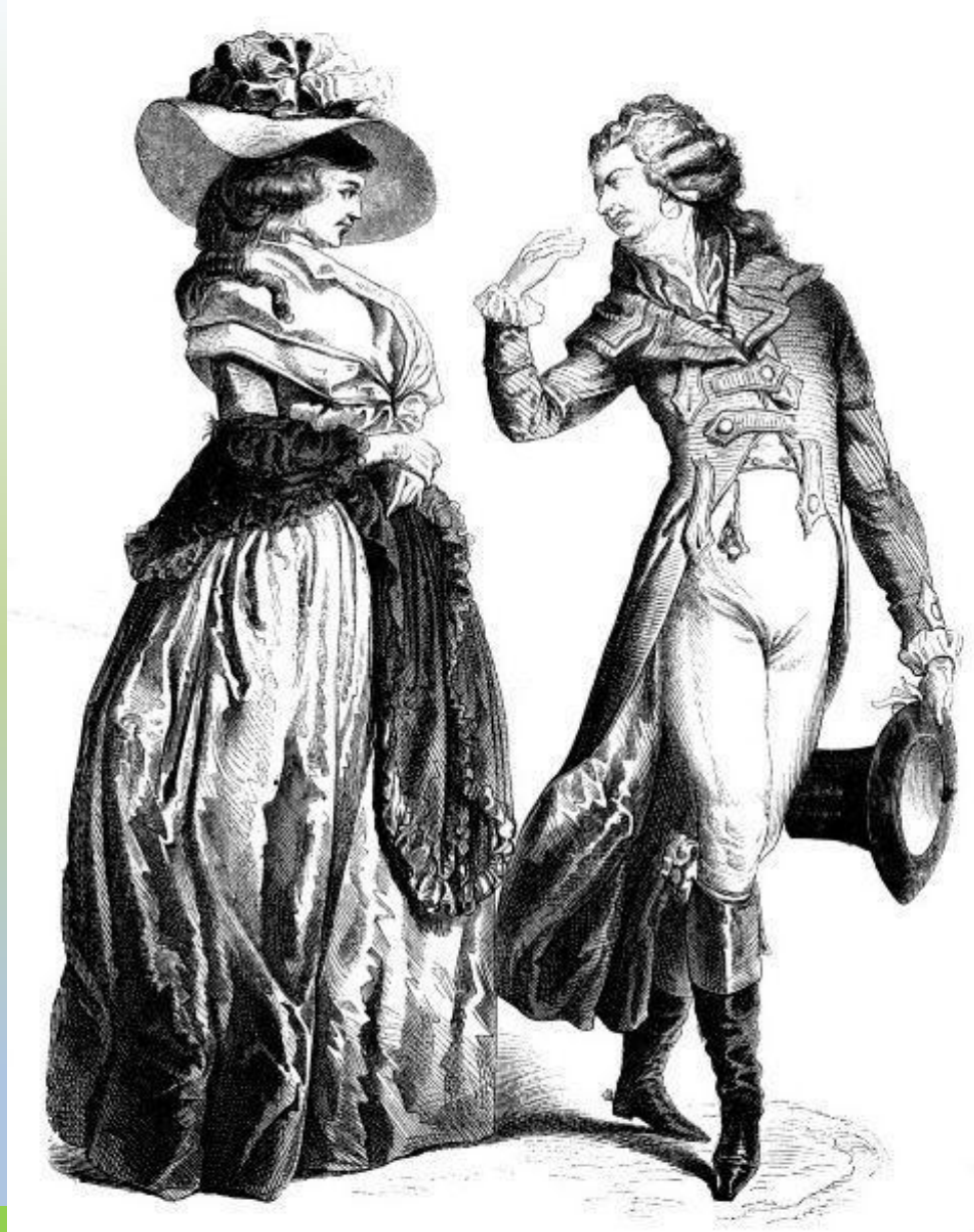
Немецкие костюмы конец XVIII века