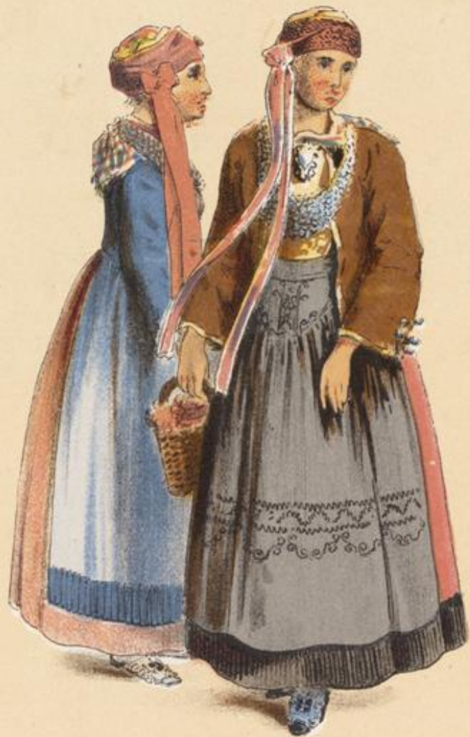
HANOVER the old Country