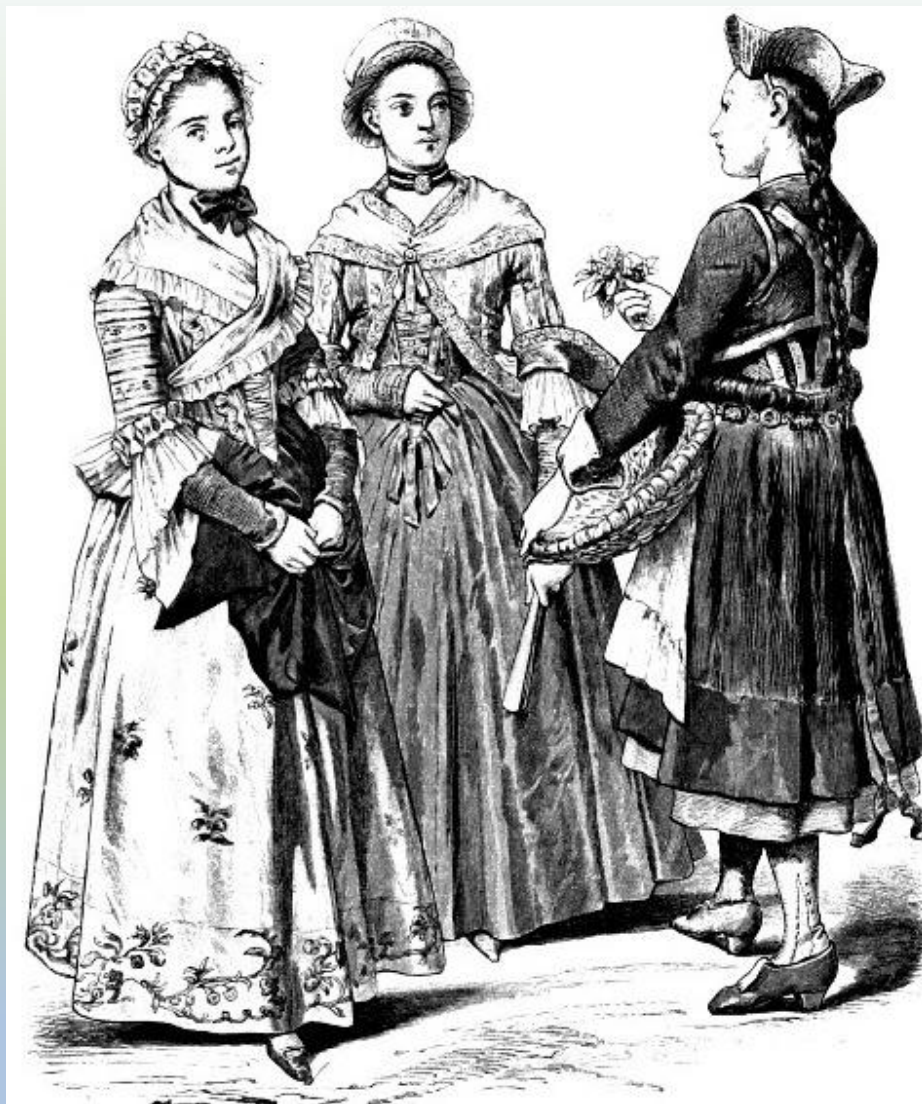
Немецкие платья конец 18 века