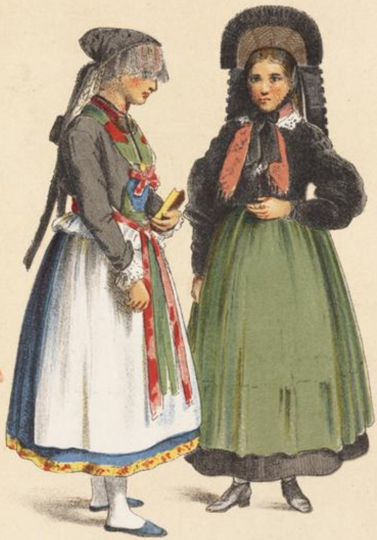
WURTEMBERG Betzingen † near Roßweil.