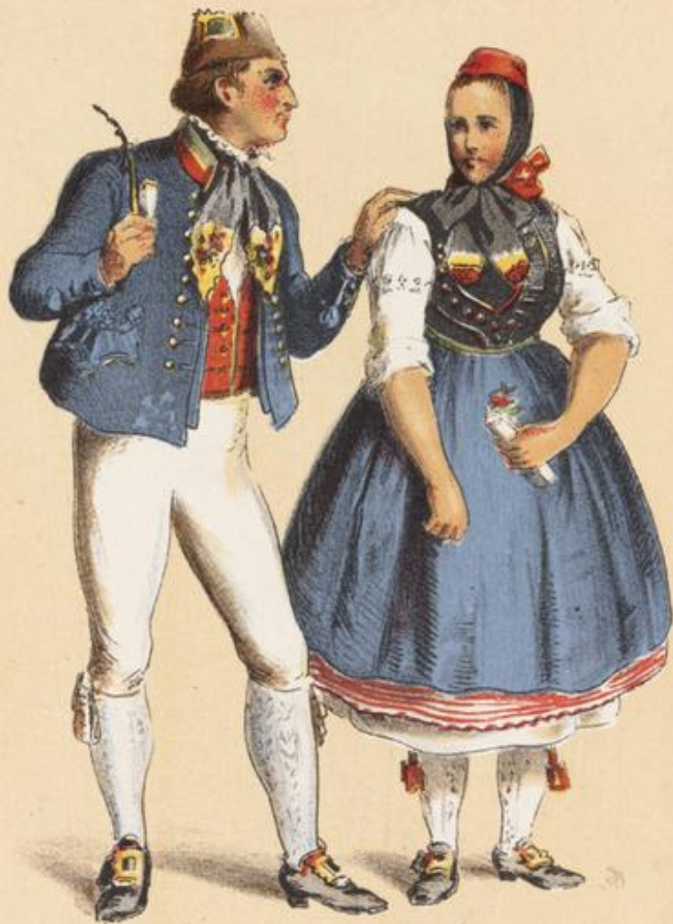
HESSE CASSEL on the Schwain.