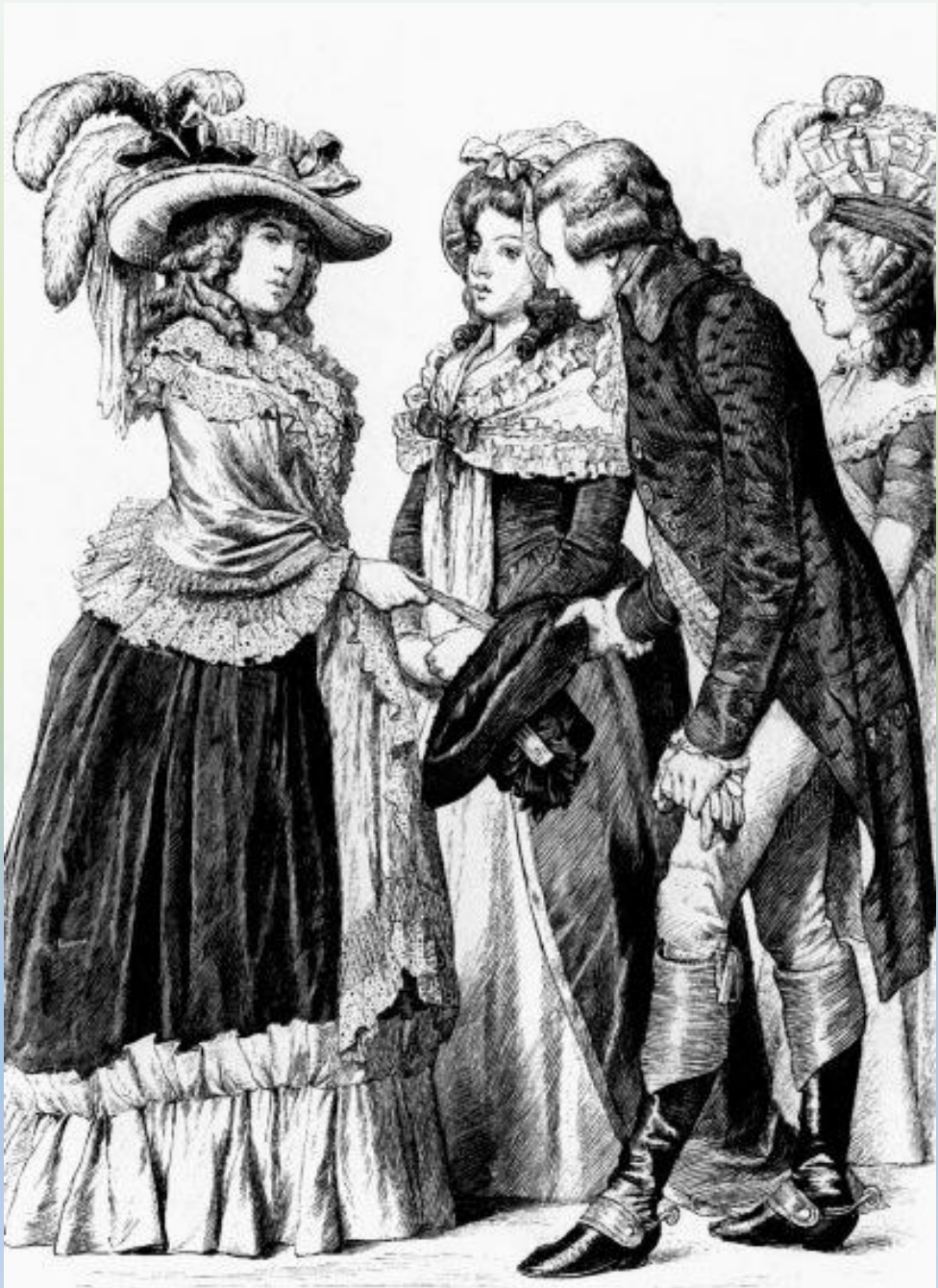
Немецкие костюмы Конец XVIII века