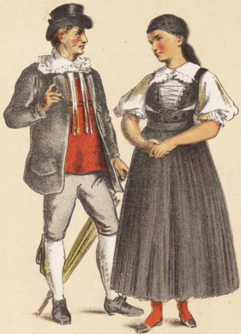
BADEN | WÜRTEMBERG Rickesbach | Schwenningen.