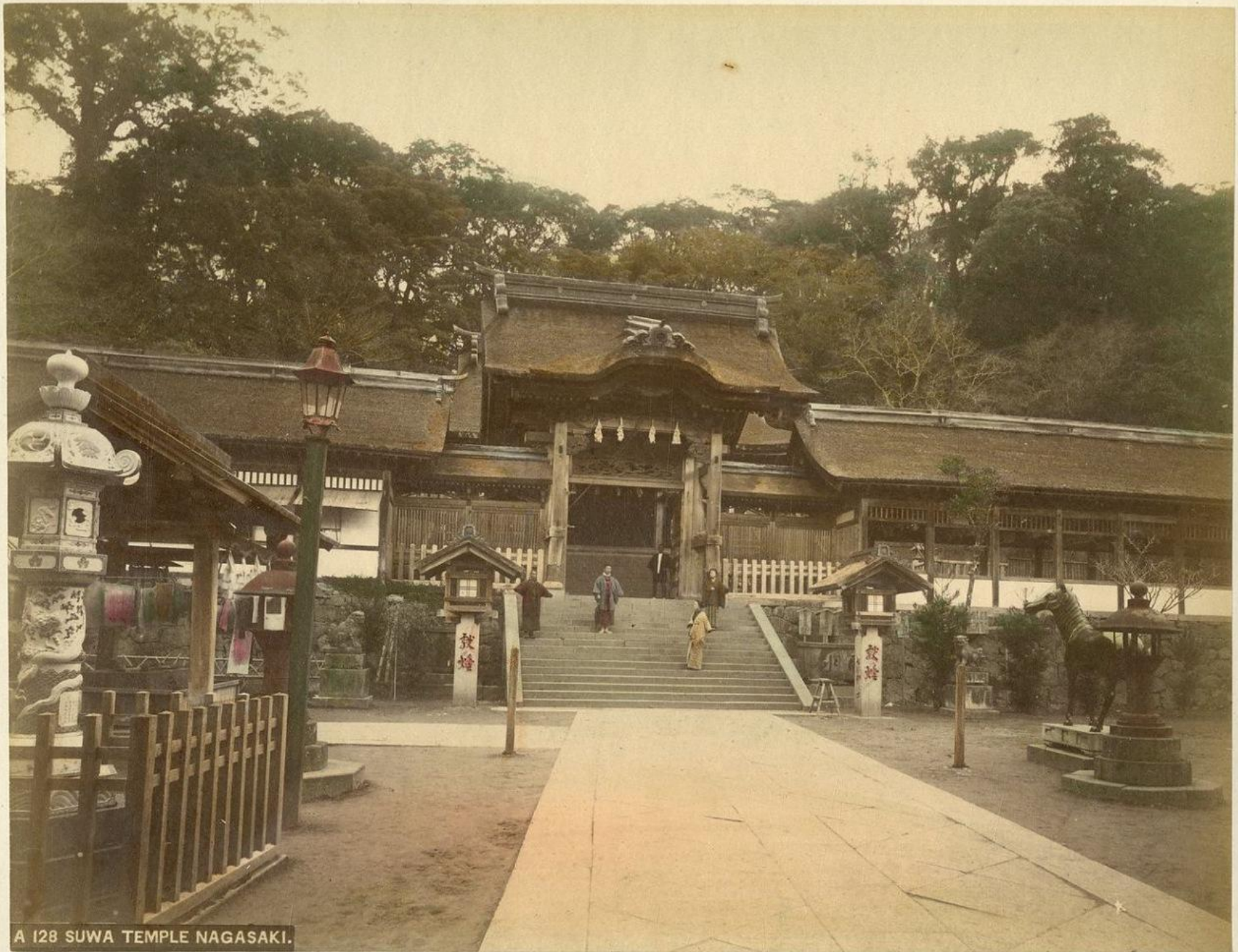
A 128 SUWA TEMPLE NAGASAKI.