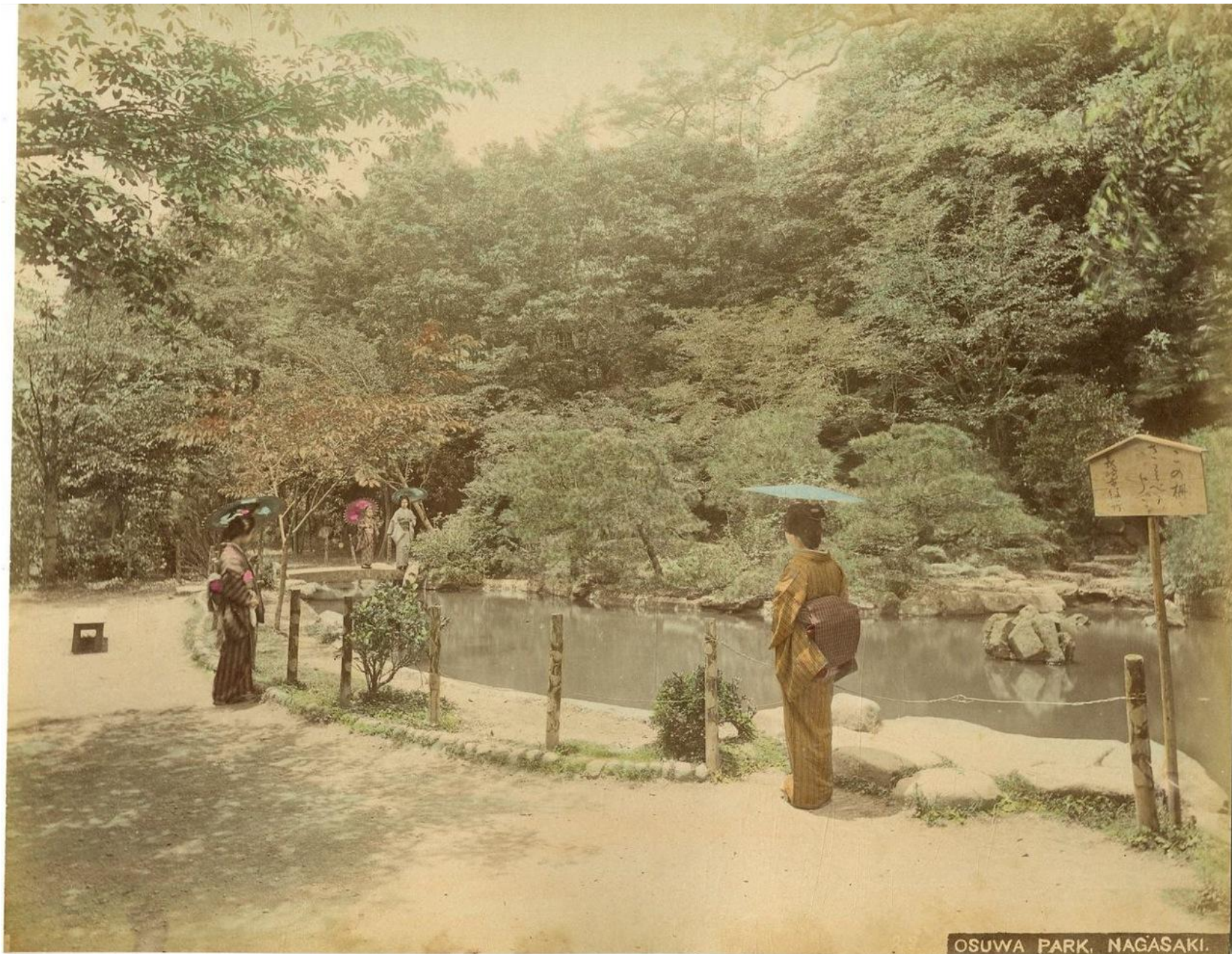
OSUWA PARK, NAGASAKI.