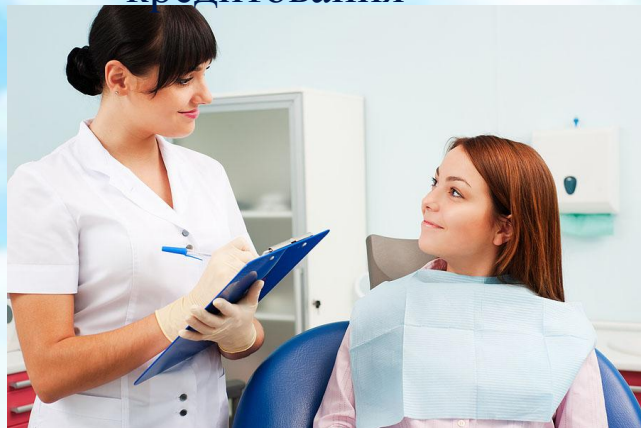
Программа добровольного медицинского страхования