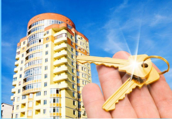
Программа ипотечного кредитования