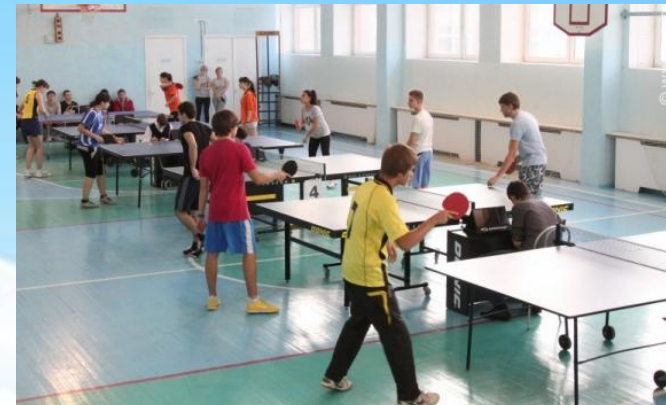
Физкультурно-оздоровительный комплекс ОАО «Ил»