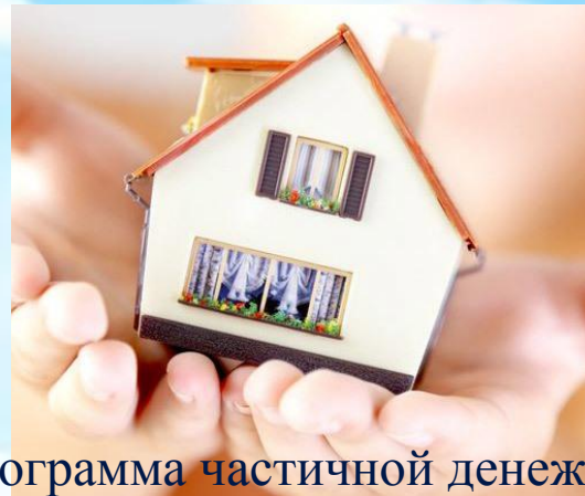
Программа частичной денежной компенсации найма жилья