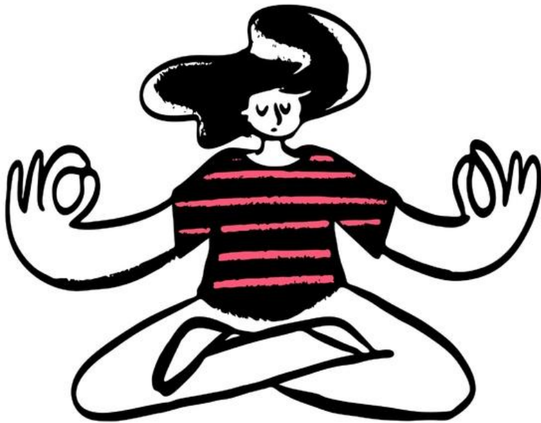
Иллюстрация добавит вашей презентации больше эмоций

Иллюстрации задают динамику вашей презентации и облегчают восприятие сложной информации. В посте мы собрали ресурсы, где можно скачать креативные рисунки абсолютно бесплатно.