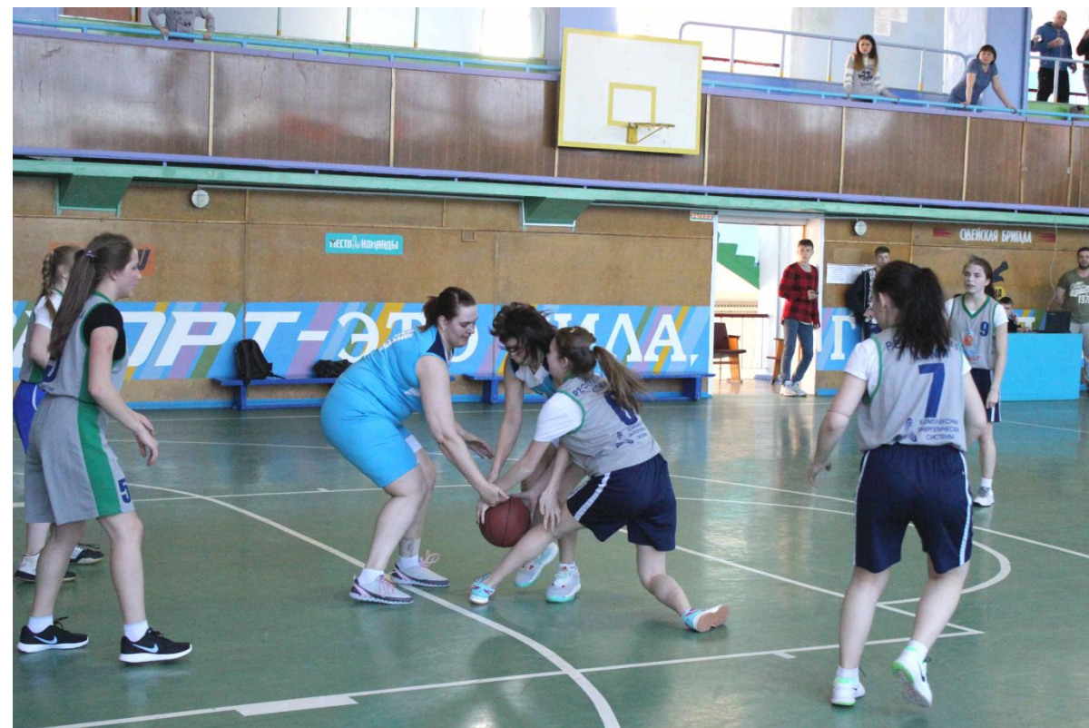
Молодежный фестиваль «Жизни – да, экстремизму – нет!» в спортивной школе «Юность».