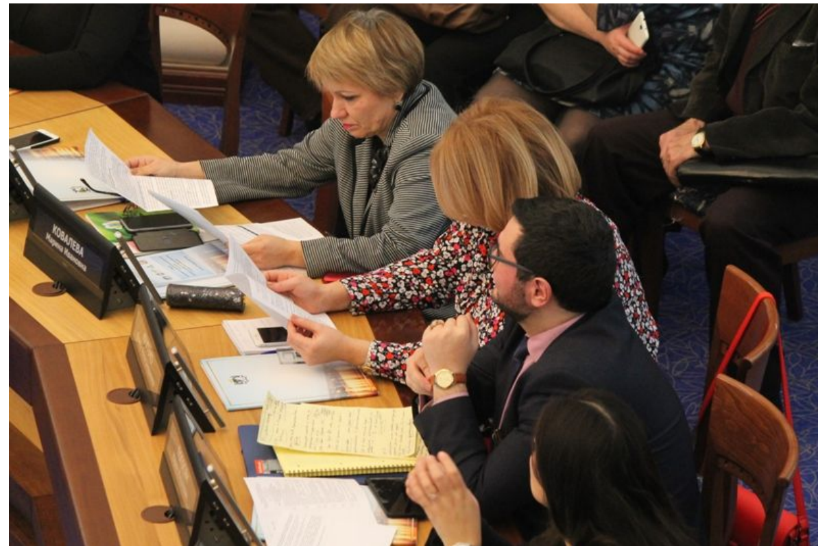
Форум «Особенности реализации молодежной политики в вопросах профилактики экстремизма в г. Новосибирск»