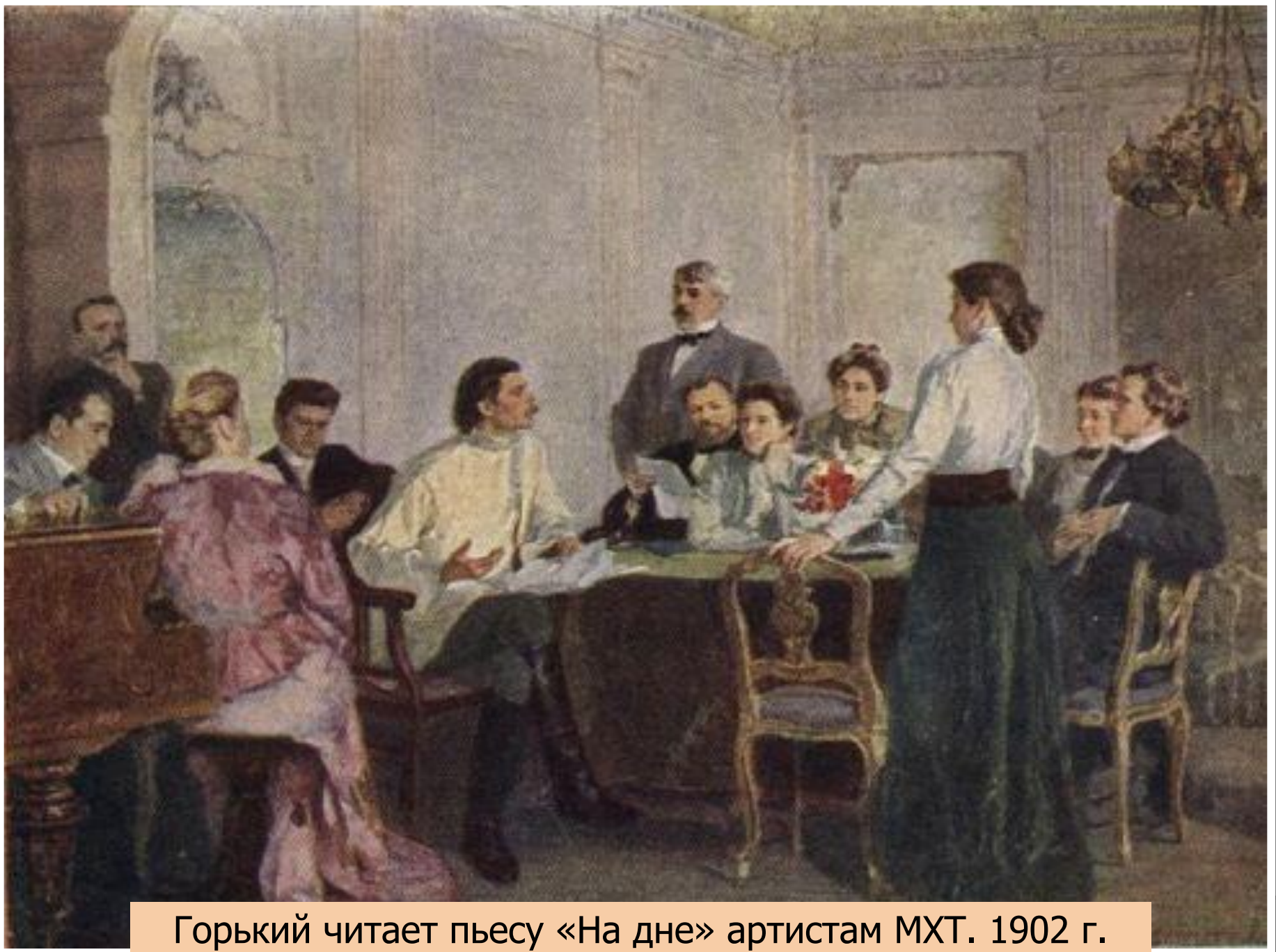
Горький читает пьесу «На дне» артистам МХТ. 1902 г.