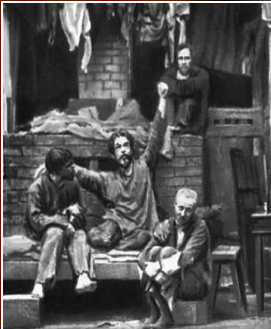
Сцена из спектакля. Сатин – К. Станиславский