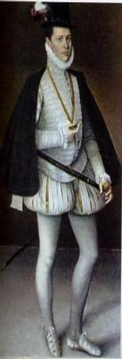
Хуан Пантоха де ла Крус. Дон Фернандо д'Арагон. 1581 г. Замок Нелагозевси. Богемия.

«Дольше, чем где бы то ни было в Западной Европе, сохранился на полуострове средневековый рыцарский уклад. Воинская доблесть, отчаянное удальство, беззаветное служение даме, корни которого надо искать в почитании Девы Марии, — вот добродетели, оставшиеся идеалом для Испании. С такими воинственными вкусами было связано тайное пренебрежение к учёности и разуму, а также невероятная гордость, прославленная по всему свету, пресловутая гордость: гордость национальная, присущая всем, гордость сословная, присущая каждому. Даже христианство утратило в Испании свойственные ему смирение и радость, оно приобрело исступлённый, мрачный, властный характер», — писал Лион Фейхтвангер.