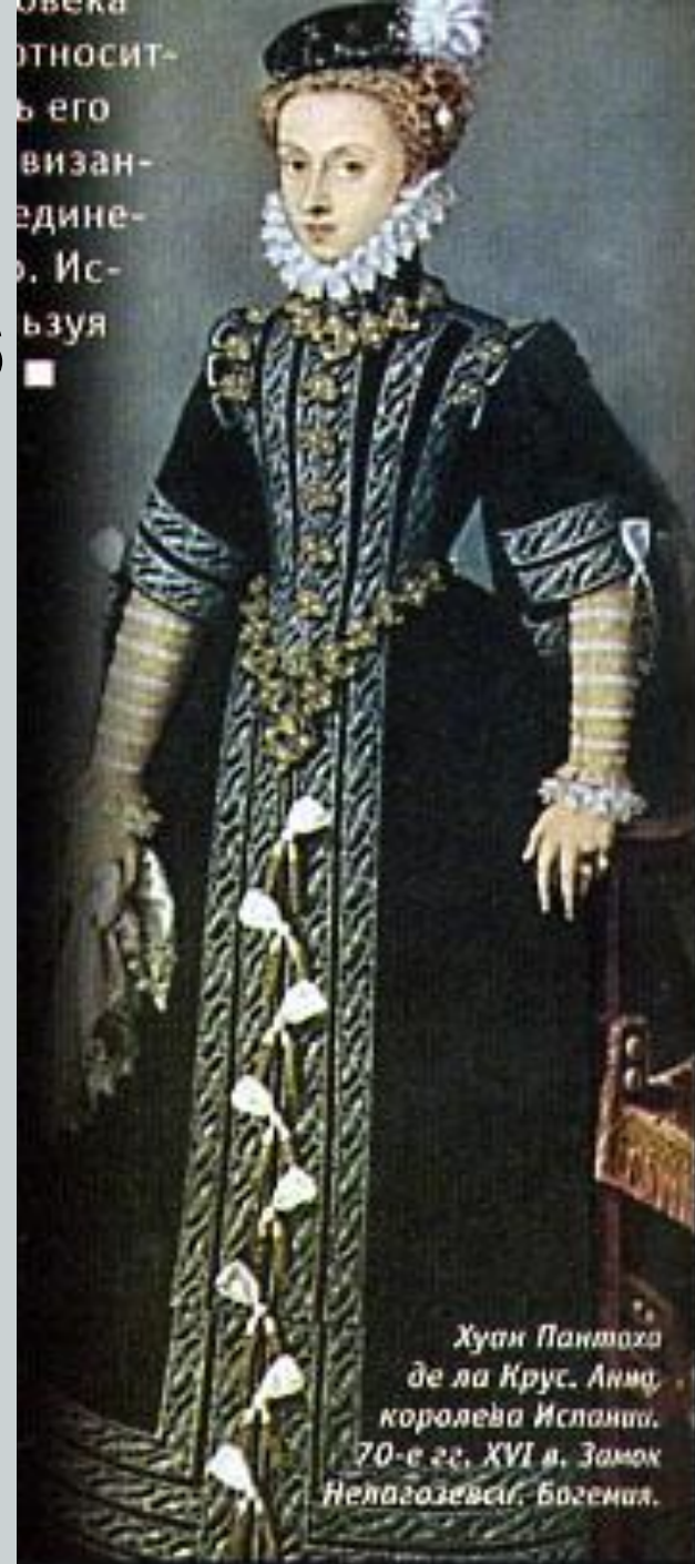
Хуан Пантоха де ла Крус. Анна, королева Испании. 70-е гг. XVI в. Замок Незагозевиц, Богемия.

В 1556г. Под власть Испании перешли Нидерланды..