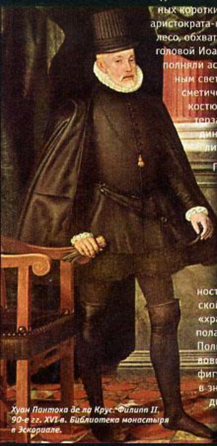
Хуан Пантоха де ла Крус. Филипп II, 90-е гг. XVI в. Библиотека монастыря в Эскориале.

В 1492 г. Первая экспедиция Христофора Колумба положила начало освоению земель в Южной и Центральной Америке, рождению огромной колониальной империи, в которой никогда не заходит солнце.