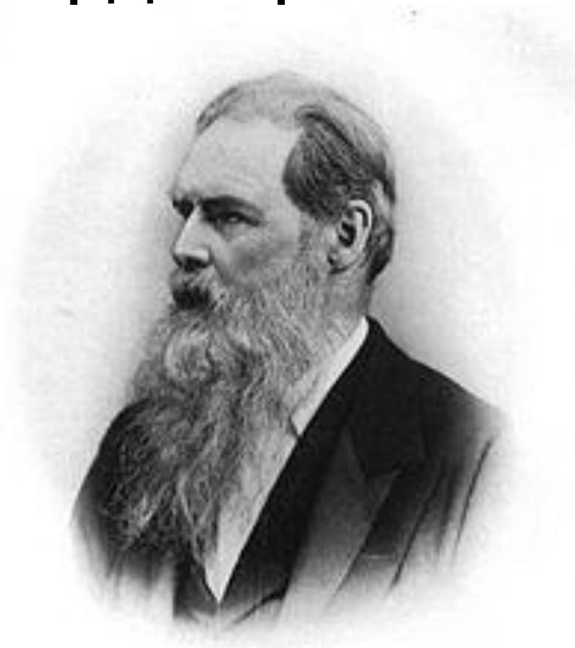
E. B. Tylor - Act. 67