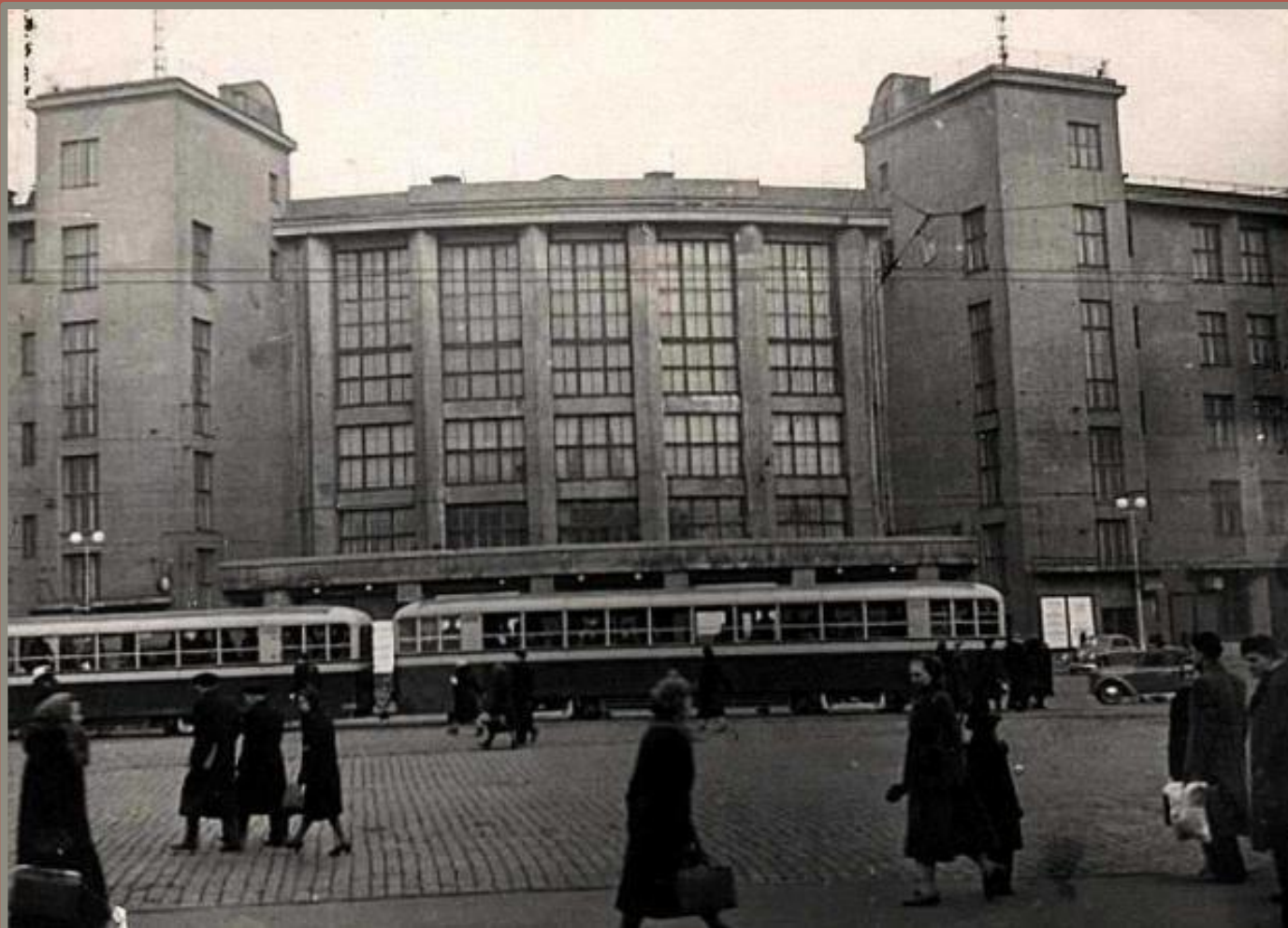
Дворец культуры им. М. Горького арх. А. Гегелло, Д. Кричевский 1927 г.