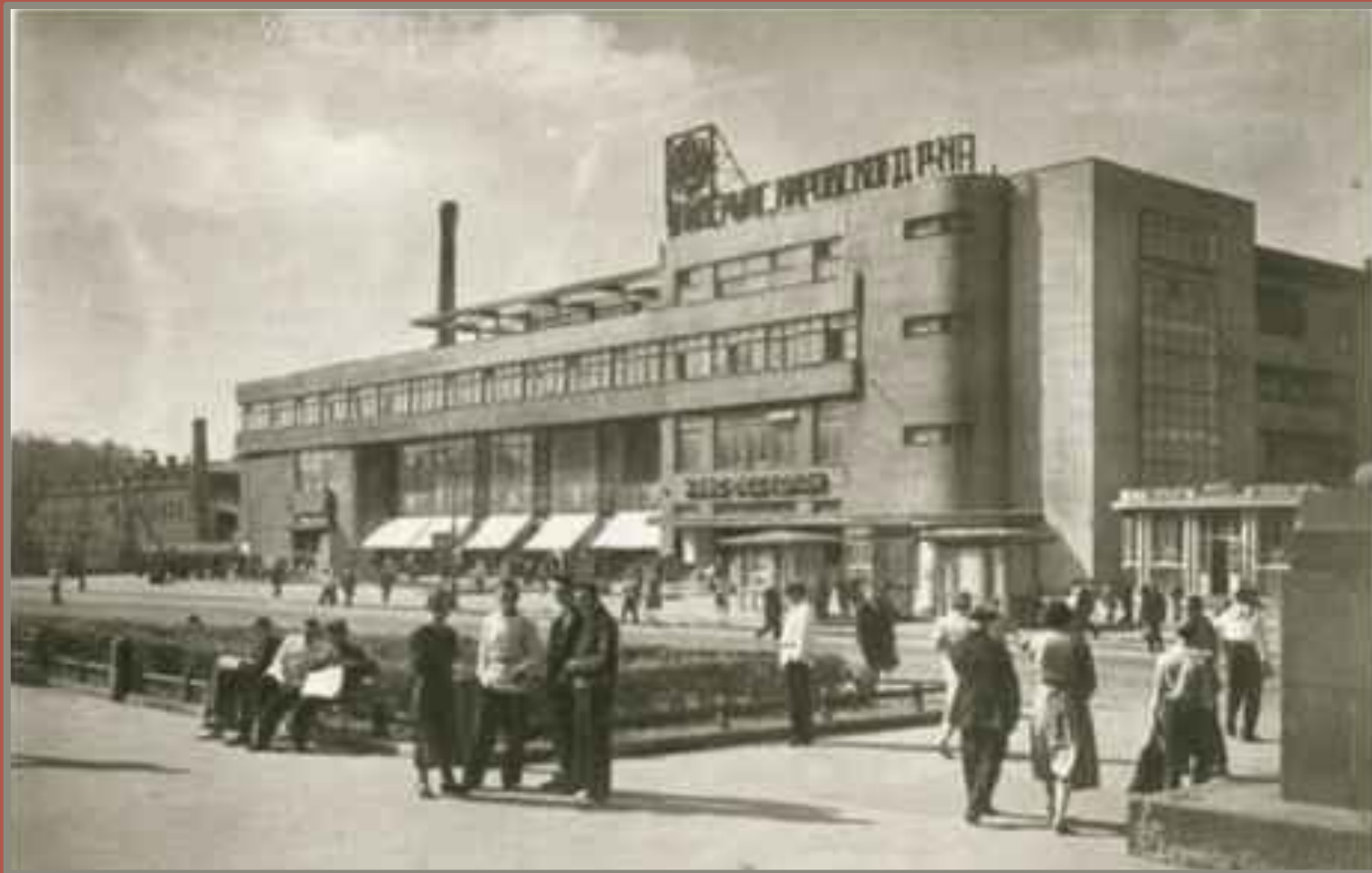
Фабрика – кухня арх. А. Барутчев 1931 г.