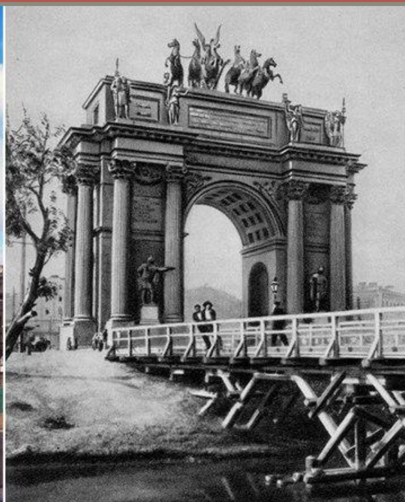
Площадь Стачек. Нарвские ворота.