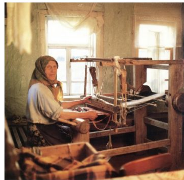
Ткацкий станок в работе (фото с.Семёновка)