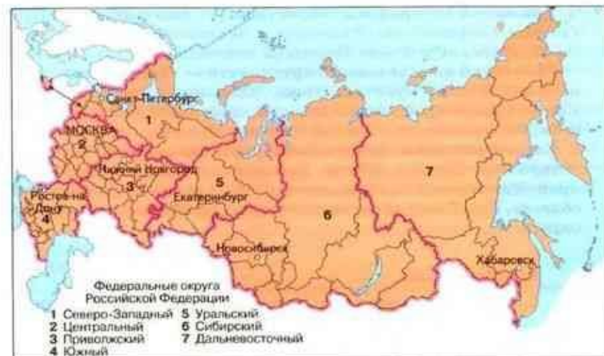
Рис. 72. Федеральные округа Российской Федерации

Калужская, Костромская, Курская, Липецкая, Московская, Орловская, Рязанская, Смоленская, Тамбовская, Тверская, Тульская, Ярославская области и город Москва.