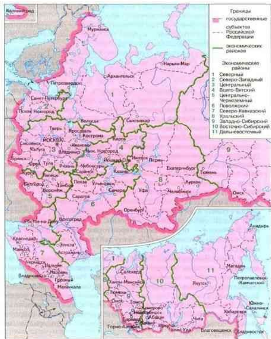
Рис. 71. Экономические районы России