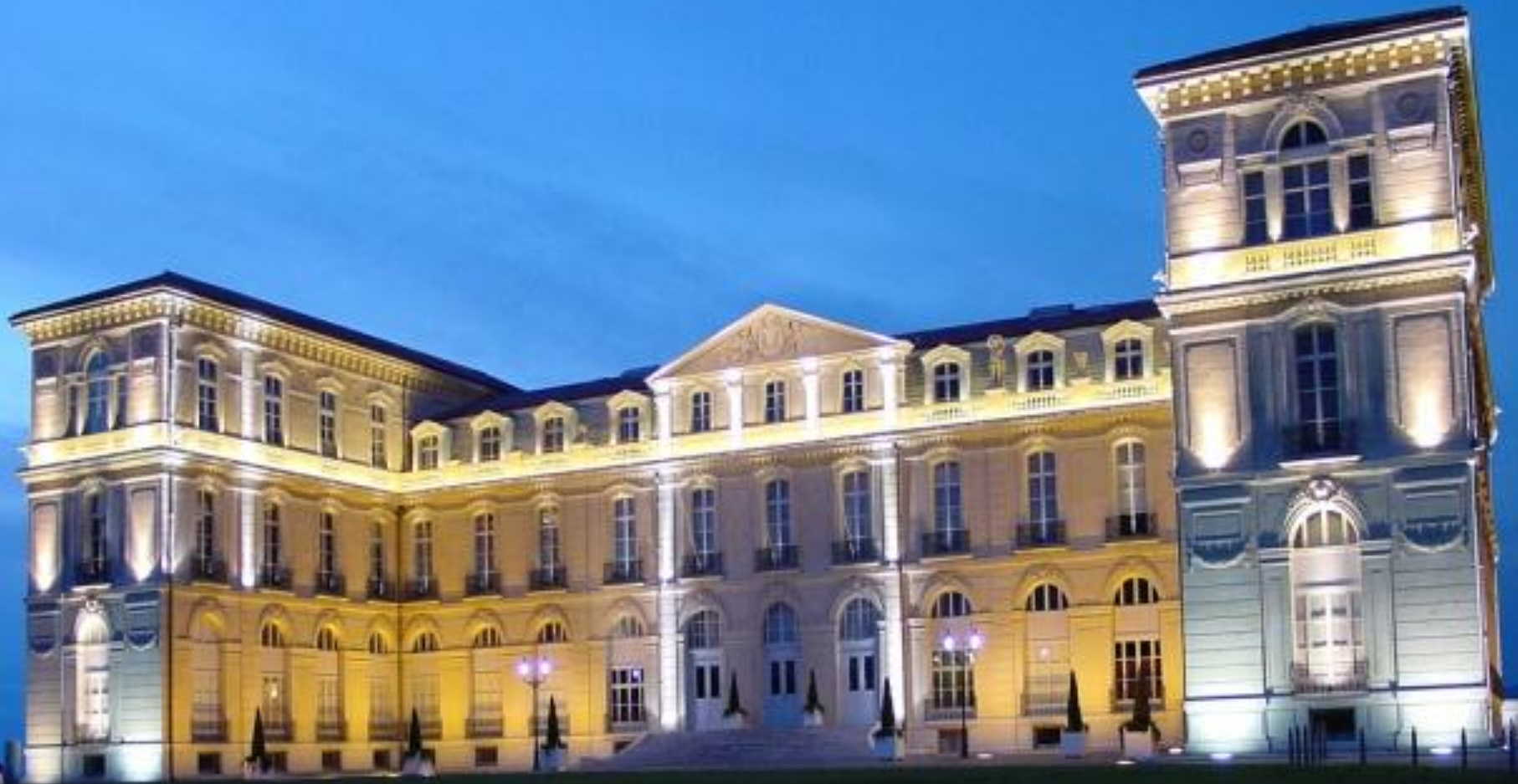
Marseille- Palais du pharo