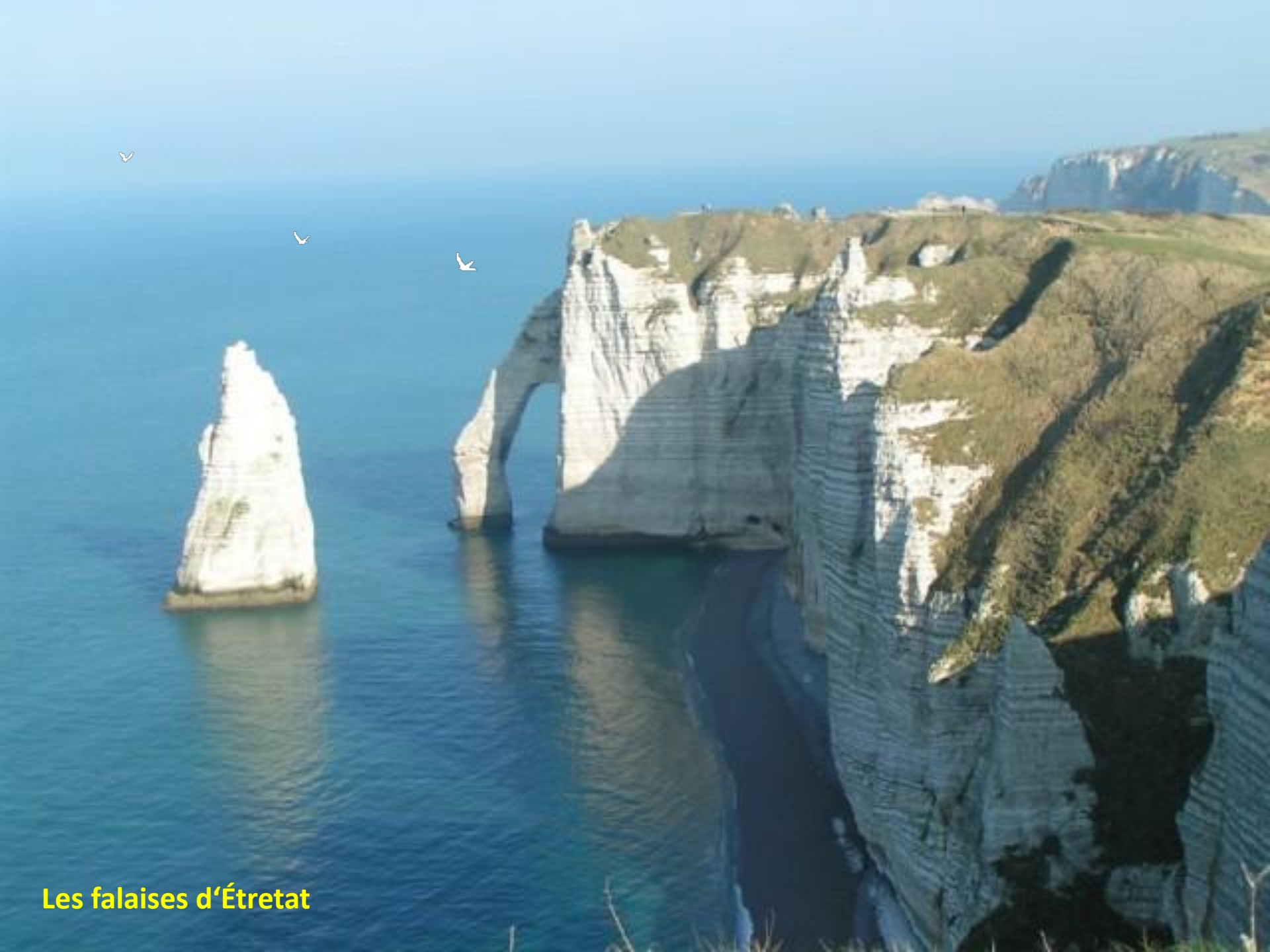
Les falaises d'Étretat