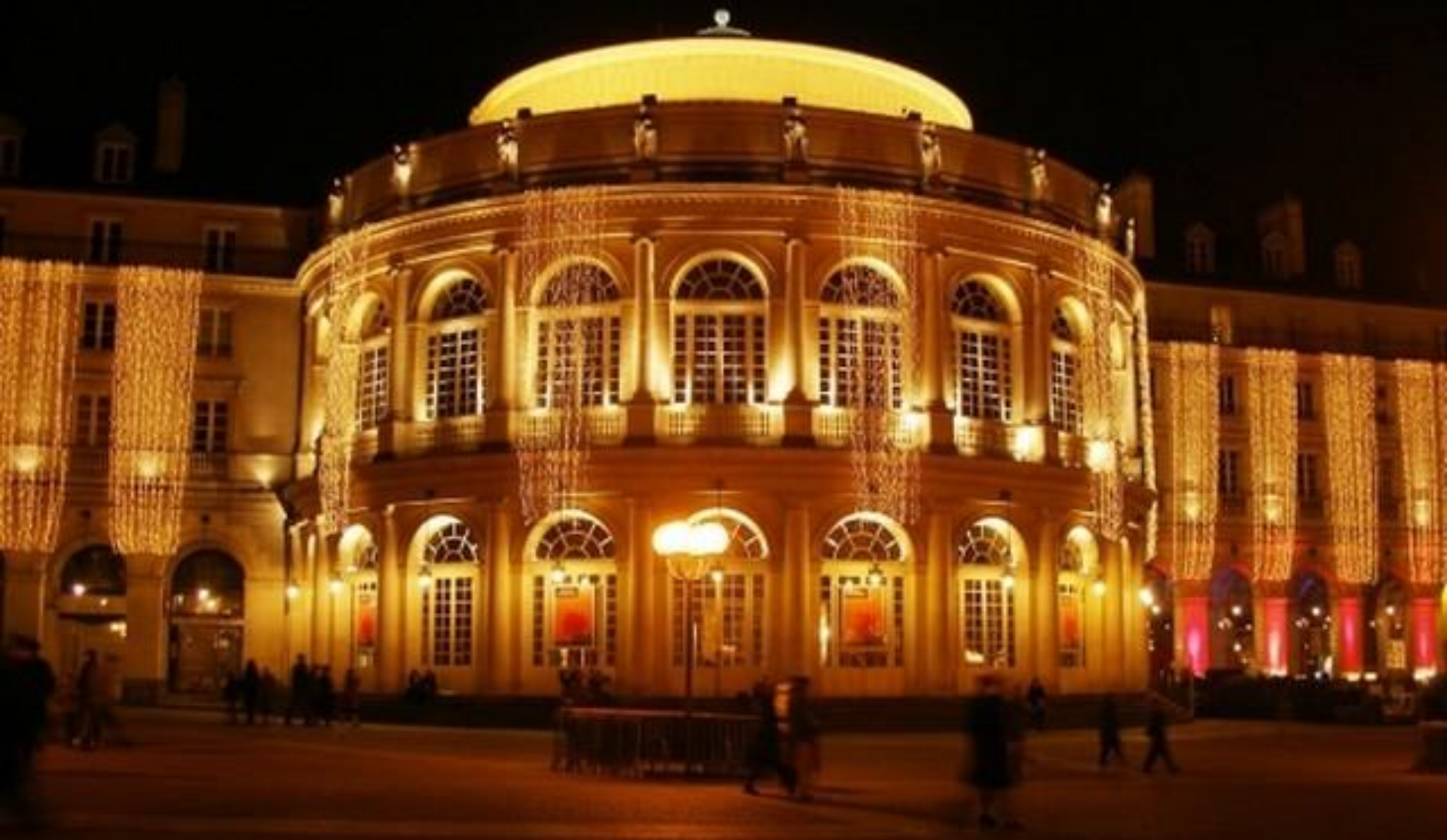
Place de la mairie à Rennes