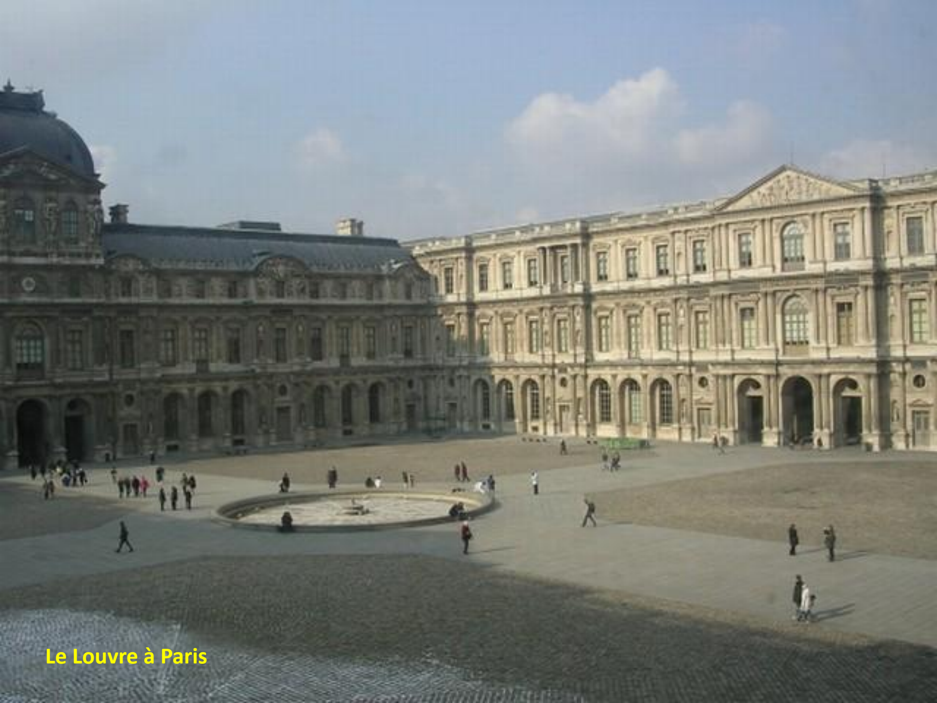
Le Louvre à Paris