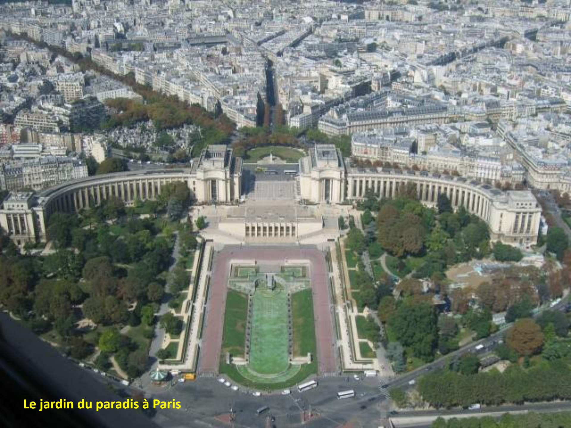
Le jardin du paradis à Paris