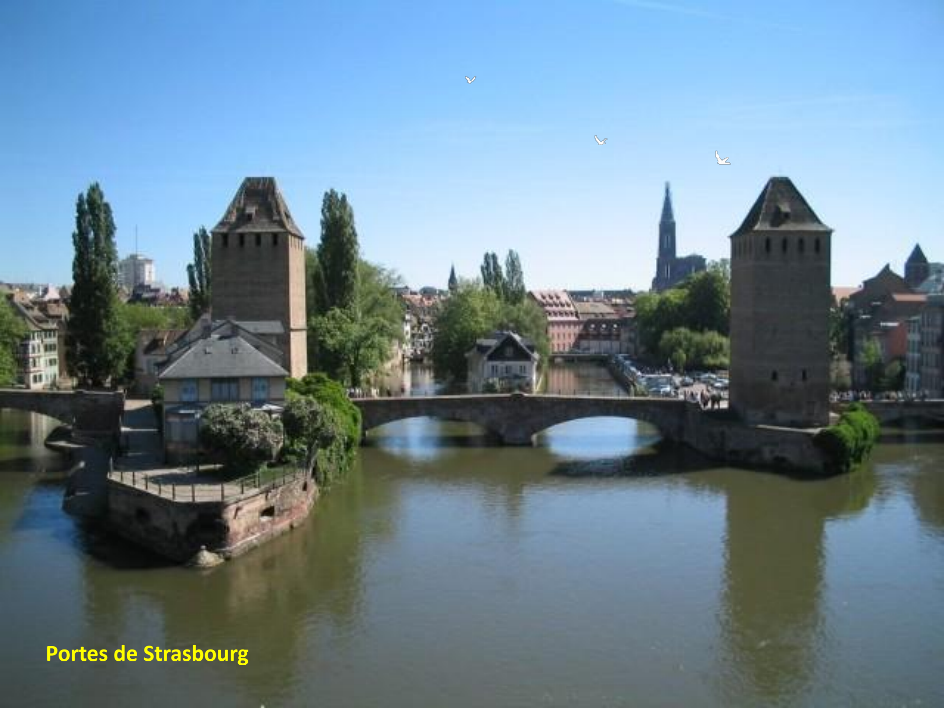
Portes de Strasbourg