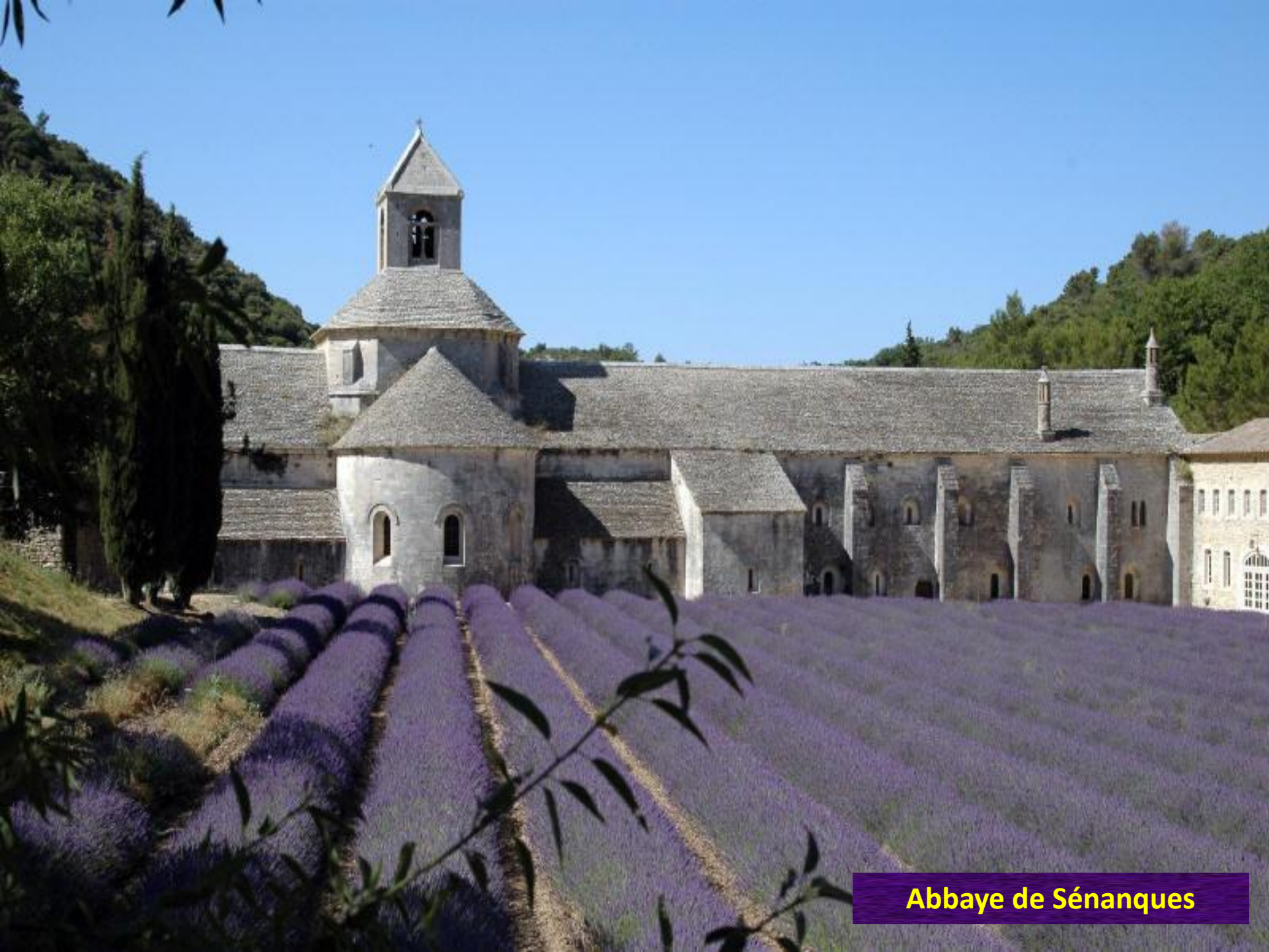
Abbaye de Sénanques