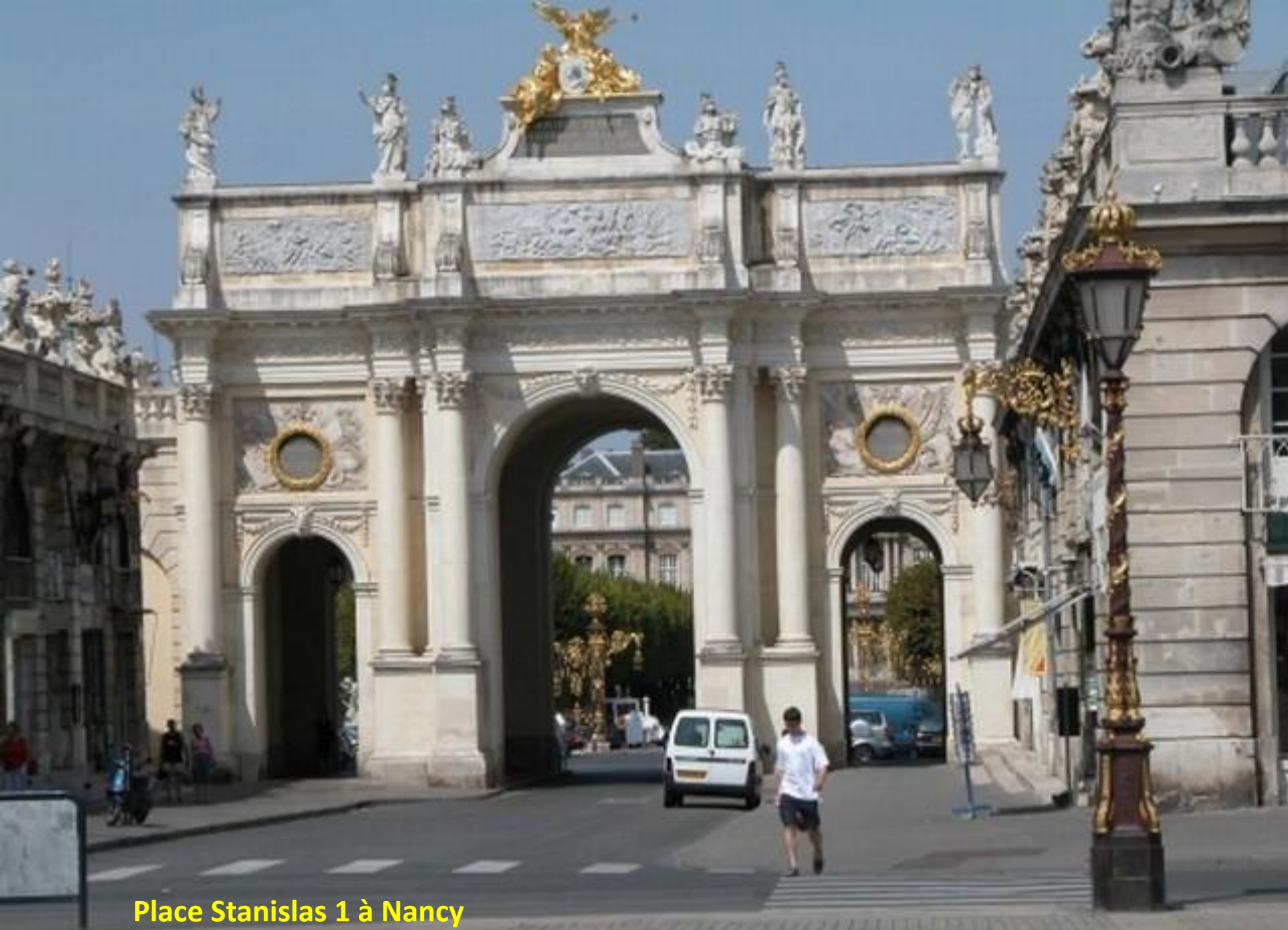
Place Stanislas 1 à Nancy