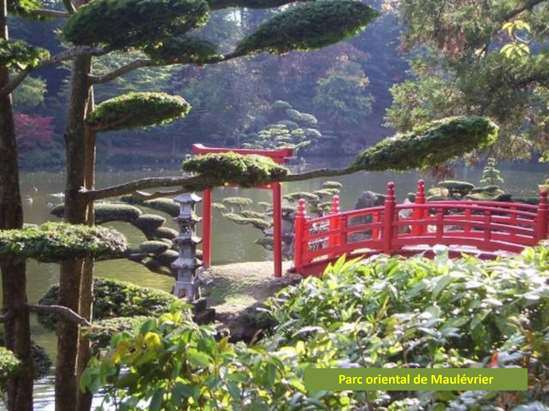
Parc oriental de Maulévrier