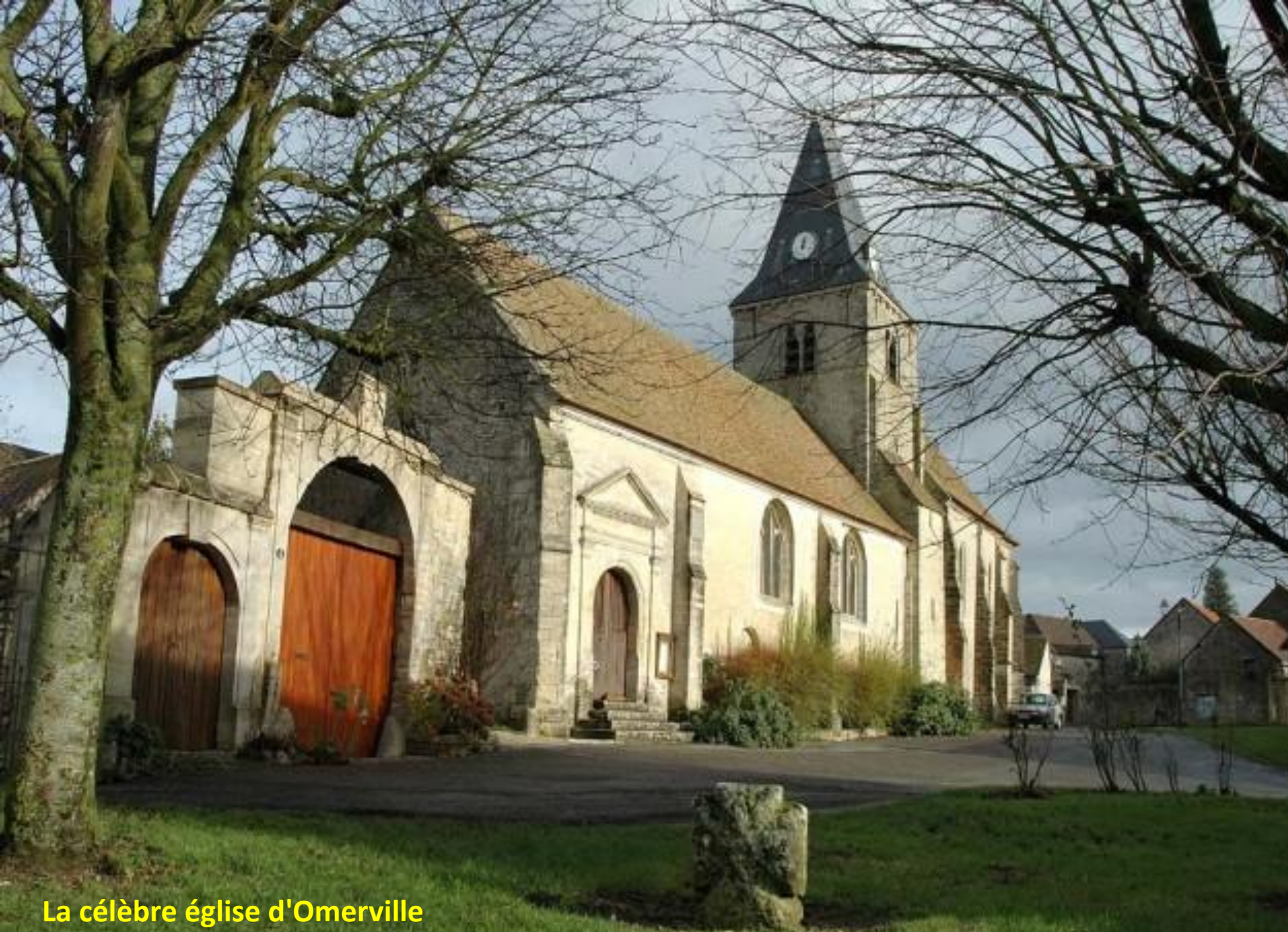
La célèbre église d'Omerville