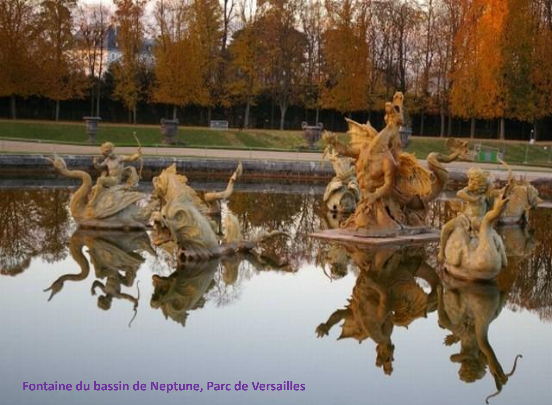
Fontaine du bassin de Neptune, Parc de Versailles