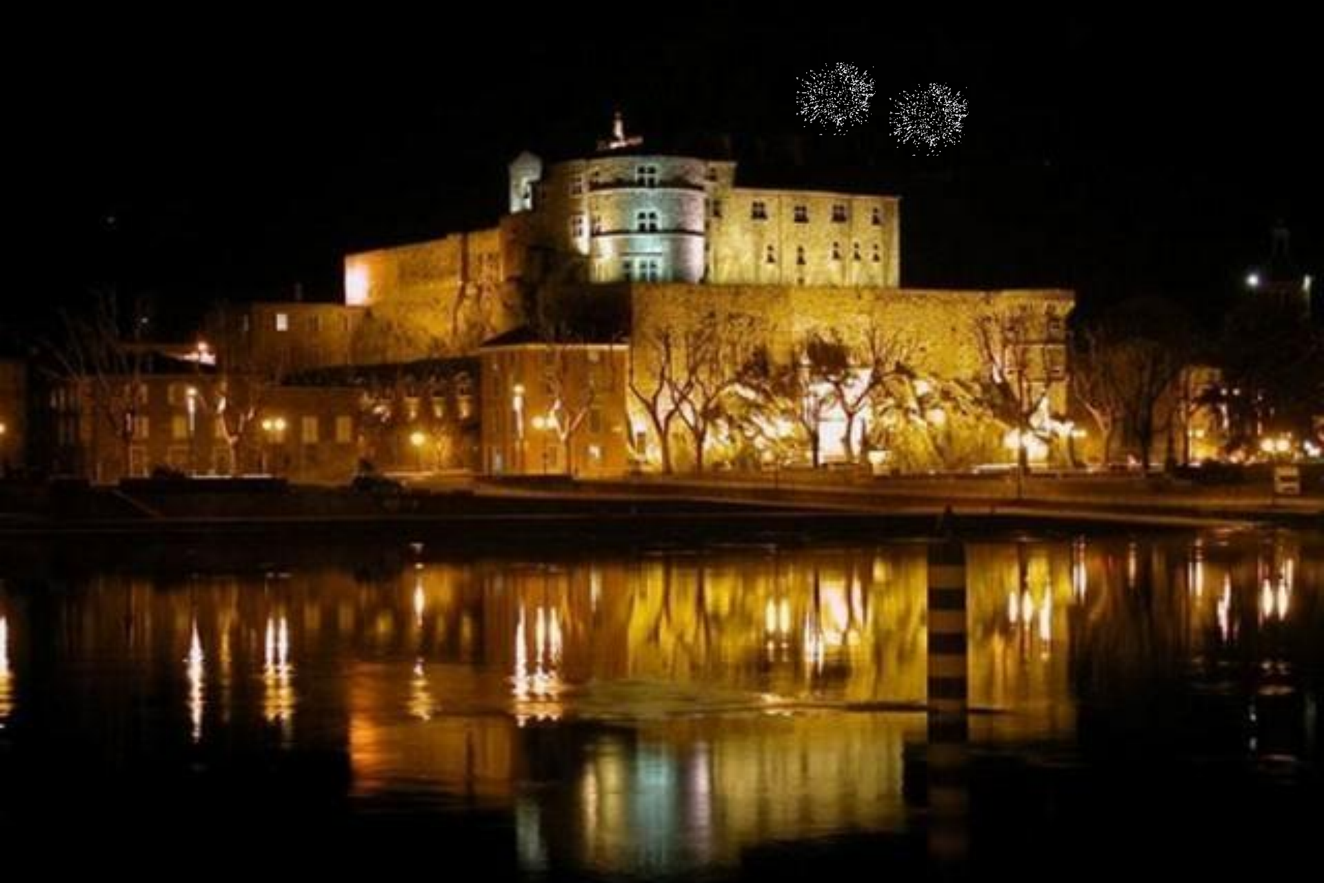
Château de Tournon